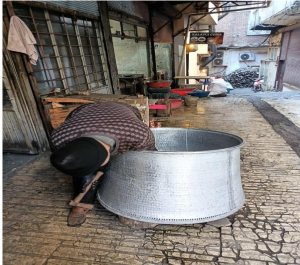
(Bakır ustası Serdar Büyükçıkıç)