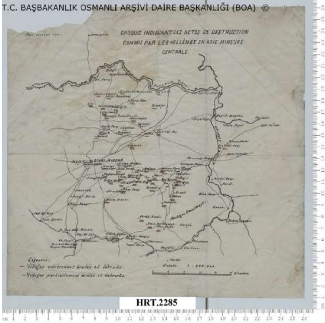
Ek 2: Sivrihisar ve civarında Yunanlıların işgal ettikleri yerlerin haritası.