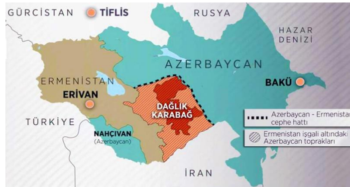
Şekil 1: Karabağ ve Dağlık Karabağ