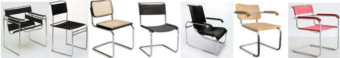
Şekil 6. Marcel Bruer Tarafından Tasarlanan B3, B5, B32, B33, B34, B35, B64 Sandalyeleri ( Designed by Marcel Breuer B3, B5, B32, B33, B34, B35, B64 Chairs) [24-25-26-27-28-29-30].

Bu süreçte tasarım kriterlerini belirleyen Breuer, hafif ve ekonomik bir malzeme olan metal kullanımına ağırlık vererek diğer tasarımlarında bu malzemeyle fark yaratmıştır. Mobilya yaratıcısı olan Breuer, minimum kuvvet sorununu, minimum etkiler yaratan hesaplanamaz faktörlerin derin bir araştırmasını yapmıştır. Özellikle ‘B3, B5, B32, B33, B34, B35, B64’ serileriyle ergonomik, standart ve hafif sandalyeler üreterek Bauhaus akımını ve ondan sonra gelen akımları etkileyerek günümüze ulaşmayı başarmıştır (Şekil 6.).