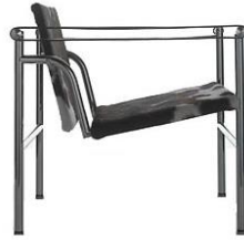
Şekil 8. Le Corbusier Tarafından Tasarlanan Basculant LC1 sandalyesi [34].

Batıda modern mimarinin resmi tarihi Le Corbusier olarak bilinmektedir (Bozdoğan,2002). Aynı zamanda modern mobilya tasarımlarının temelini oluşturan havada oturma fikri pekiştirilmiş uygulamaları yapılmıştır. Özellikle sandalyede uygulanan bu formla hem malzemede esneklik hem de görünüşte estetiklik sağlanmıştır. Le Corbusier’in farklı tasarım anlayışıyla yaklaştığı Basculant LC1a sandalyesi (Şekil 8.) modern mobilya tasarımı için önemli bir aşama olmuştur [33]. Bu sandalyeden yola çıkılarak farklı tasarım anlayışı benimsenmiştir.