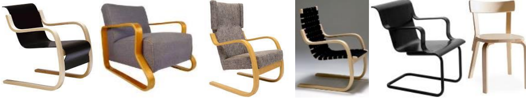
Şekil 12. Alvar Aalto Tarafından Tasarlanan Armchair 42, Armchair 44, Armchair 401, Armchair 406, Armchair 26, Chair 69 ( Designed by Alvar Aalto Armchair 42, Armchair 44, Armchair 401, Armchair 406, Armchair 26, Chair 69 [50-51-52-53-54-55]).

Aalto yıkanabilir ve hijyenik sandalyeler üzerinde durmuş, sandalyelerin malzemelerinin yaylanma özelliğinden dolayı konforlu bir oturma alanı sağlamıştır. Paimio ile başlayan modern tasarımları ‘Artek’ firmasıyla bugün bile modern sandalyeler adı altında hala devam etmektedir [49]. Bu kıvrımlı modern tasarım sandalyelerin birçok serileri mevcuttur ve Bauhaus için devrim niteliği taşımaktadır (Şekil 13.).