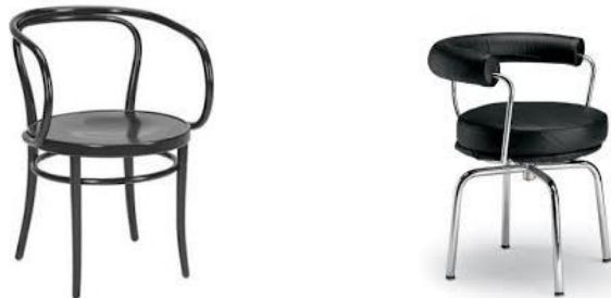
Şekil 9. Le Corbusier Tarafından Tasarlanan Thonet ve LC7 Sandalyesi ( Thonet and LC7 Sandal designed by Le Corbusier) [37-38].

Le Corbusier; dekoratif sanatın önemini yitirmesi, işleve hitap etme, yeni hayat stilini ifade etme ve aidiyetlikten ziyade aktiviteler tarafından karakterize edilen mobilyalar tasarlandığını vurgulamaktadır [35]. Bunun yanında “Ahşabın mobilya için gerekli temel malzeme olarak kalmasının hiçbir sebebi yok” diyerek mobilyada metal kullanımına olan desteğini belirtmiştir [36]. Bu söylemlerden yola çıkarak sandalye tasarımlarını ortaya koymuştur (Şekil 9.).