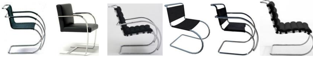
Şekil 10. Mies Van Der Rohe Tarafından Tasarlanan D42, Brno, Model 44, MR 10, MR 20, MR Armless Sandalyeleri (Designed by Mies Van Der Rohe D42, Brno, Model 44, MR 10, MR 20, MR Armless Chairs) [40,41,42,43,44,45].

Modern mekanlara modern mobilyaların uyumu da her zaman önemli olmuştur. Bu bağlamda dönemin modernist mimarlarından olan Mies Van Der Rohe çalışmalar yapmıştır. Mies Van Der Rohe'nin mimarlığında olduğu gibi mobilyalarında da bazı unsurları mevcuttur. Hem yapısal hem görsel olarak konsolluğa önem veren Mies Van Der Rohe, aynı zamanda mekan içerisinde açıklık ve transparanlık kavramlarıyla çizgisellik ilkesini benimseyerek tasarımlarında çelik profil kullanımına ağırlık vermiştir. Tasarımlarında hantal mobilyalar yerine hafiflik hissi hakimdir. Kullandığı malzemeler ve tasarım üslubu gereği belli bir gruba hitap edebilmesi için pahalılığın olması gerektiğini savunmuştur [39]. Marcell Breuer gibi çelik ve cam malzemeleri tercih eden Mies Van Der Rohe, Mies mobilya koleksiyonu ile farklı bir estetik anlayışı getirmiş, birçok sandalye tasarımı yapmıştır (Şekil 10.).