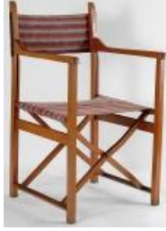
Şekil 4. Hannes Meyer Tarafından Tasarlanan Folding Chair (Folding Chair Designed by Hannes Meyer ) [22].

devam etmiştir [21]. Folding Chair adlı ünlü sandalye tasarımı Bauhaus manifestosu niteliği taşımaktadır (Şekil 4.).