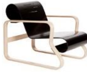
Şekil 12. Alvar Aalto Tarafından Tasarlanan Paimio Sandalyesi (Paimio Chair Designed by Alvar Aalto) [48].

Aalto yıkanabilir ve hijyenik sandalyeler üzerinde durmuş, sandalyelerin malzemelerinin yaylanma özelliğinden dolayı konforlu bir oturma alanı sağlamıştır. Paimio ile başlayan modern tasarımları ‘Artek’ firmasıyla bugün bile modern sandalyeler adı altında hala devam etmektedir [49]. Bu kıvrımlı modern tasarım sandalyelerin birçok serileri mevcuttur ve Bauhaus için devrim niteliği taşımaktadır (Şekil 13.).