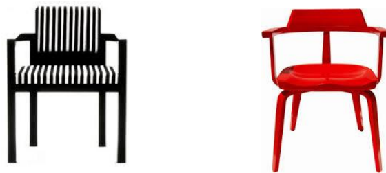
Şekil 3. Walter Gropius Tarafından Tasarlanan D 51 ve W 199 Sandalyeleri (D 51 and W 199 Designed by Walter Gropius) [19,20].

Daha çok mobilyayla bağdaşan atölyeler için ise; ‘Bauhaus atölyeleri asıl olarak, seri üretime uygun ve çağımıza özgü ürünlerin prototiplerinin geliştirildiği ve sürekli iyileştirildiği laboratuvarlardır’ [18]. demiştir. Bu ifadeleri doğrultusunda Bauhaus için önemli mobilyalar tasarlanmıştır (Şekil 3.).