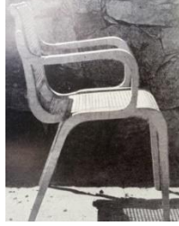
Şekil 7. Marcel Bruer Tarafından Tasarlanan Uluslararası Düşük Maliyetli Mobilya ( International Low Cost Furniture Designed by Marcel Breuer) [32].

-Daha iyi konfor yaratmak, görünüşte ve yükte hafiflik sağlamak için mümkünse tüm parçalar ve bağlantılar esnek olmalıdır” [31].