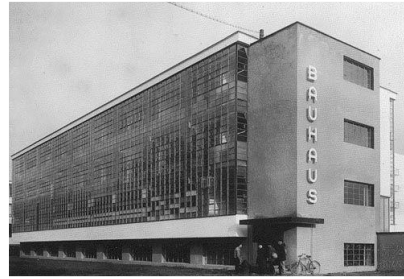
Şekil 1. Bauhaus Okulu Weimar ve Dessau Dönemi (Bauhaus School Weimar and Dessau Period) [13-14].

Hem teoride hem pratik alanda uygulamaları mevcut olan Bauhausun modernizmle böylesine yakından ilişkili olmasının en büyük etkeni uygulamaların genel geçici bir akım olmayan, günümüzde bile etkilerinin hala sürdüğü tasarımın temellerinin öncüsü olmasıdır. Modernizmin özünü oluşturan bu temeller; yeni nesnellik, faydacı, ekonomik ve sade değerler üzerine kurulmuştur.