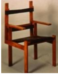
Şekil 5. Marcel Breuer Tarafından Tasarlanan Ahşap Lata Sandalye ( Wooden Lata Chair Designed by Marcel Breuer) [23].

Bu süreçte tasarım kriterlerini belirleyen Breuer, hafif ve ekonomik bir malzeme olan metal kullanımına ağırlık vererek diğer tasarımlarında bu malzemeyle fark yaratmıştır. Mobilya yaratıcısı olan Breuer, minimum kuvvet sorununu, minimum etkiler yaratan hesaplanamaz faktörlerin derin bir araştırmasını yapmıştır. Özellikle ‘B3, B5, B32, B33, B34, B35, B64’ serileriyle ergonomik, standart ve hafif sandalyeler üreterek Bauhaus akımını ve ondan sonra gelen akımları etkileyerek günümüze ulaşmayı başarmıştır (Şekil 6.).