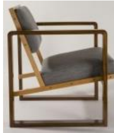
Şekil 11. Josef Albers Tarafından Tasarlanan Club Sandalye (Club Chair Designed by Josef Albers) [46].

Bunların yanı sıra mobilyada dinamizmi tercih eden Josef Albers, aynı dönemlerde seri üretim için metalin el işçiliğiyle şekillendirilmesinin zor olmasından dolayı tasarımlarında masif ahşabı kullanmıştır. Club Chair bunların en önemli örneklerinden bir tanesidir (Şekil 11.). Form- renk ilişkisini iyi bir şekilde kullanan tasarımcı, ekonomik ve verimli tasarım anlayışını benimsemiştir [12].