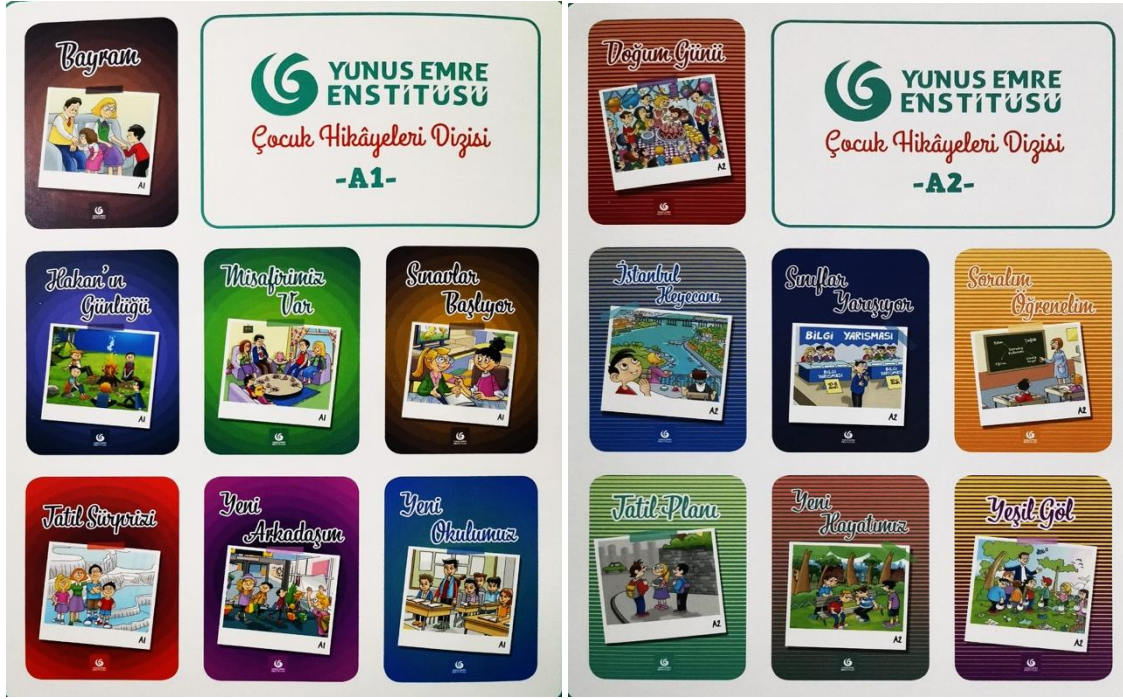
Görsel 1. A1 ve A2 düzeyindeki hikâye kitaplarının görselleri