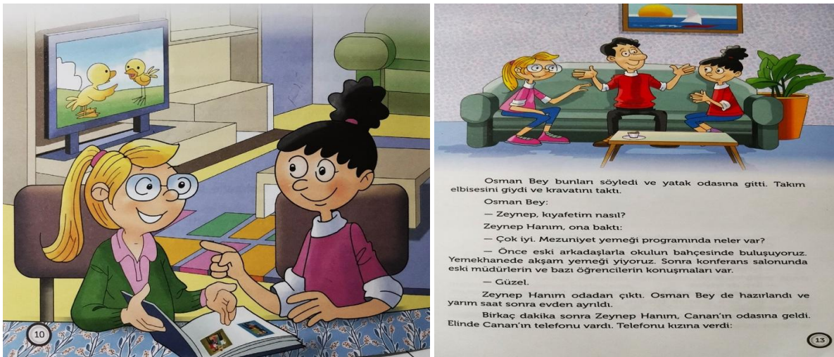
Görsel 3. İncelenen kitaplardaki resimlere örnek

Tüm kitaplarda kapak görseli için iç görsellerden biri kullanılmış. Bu yüzden anlatılan hikâye ile uyumlu görseller tercih edilmiş denilebilir. Genel olarak bakıldığında sayfaların yarısı resim olarak tercih edilmiştir. Görsellerde gerçeğe aykırılık yoktur ama basit, çizgi roman benzeri çizimler yer almıştır. Canlı ve parlak renkler, farklı desenler kullanılmış, bilgi verici görsellere yer verilmiştir. Çoğunlukla görseller anlatılanla uyumlu olsa da anlatılandan bir sayfa önce yerleştirilmiş resimler de vardır. "Doğum Günü", "Yeni Hayatımız", "Sınıflar Yarışıyor", "İstanbul Heyecanı", "Misafirimiz Var", "Yeni Arkadaşım", "Doğum Günü" kitaplarında bu tür durumlar saptanmıştır (Görsel 3 ve Görsel 4). Bazı görsellerde ise aynı zamanı anlatmasına rağmen saç ve kıyafet renginde değişiklikler göze çarpmaktadır. "Tatil Planı" ve "Bayram" kitaplarında bu tür durumlara rastlanmıştır (Görsel 3).