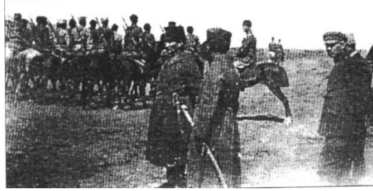
İlgın Manevrasında (1 Nisan 1922) Arkalarında Sovyet Rusya Büyükelçisi S. İ. Aralov ve Azerbaycan Büyükelçisi İ. Abilov (Aslan, 2002, s.131)