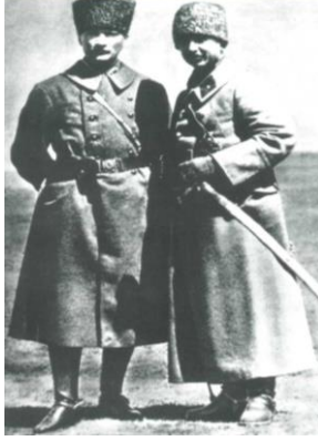
İlgın Manevrasında (1 Nisan 1922) Batı Cephesi Komutanı İsmet Paşa'yla (Özel, 2001, s. 34)