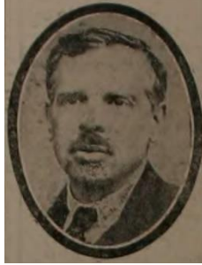
Sovyet Rus Büyükelçisi Semiyon İvanoviç Aralov (Vakit, 26 Mayıs 1922, nr.1602, s.1)