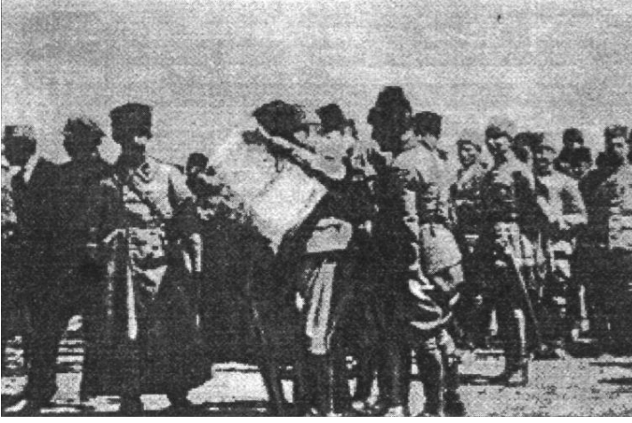
Ilgın Manevrasında (1 Nisan 1922)