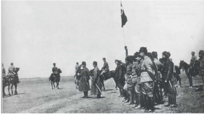
İlgın Manevrasında (1 Nisan 1922)