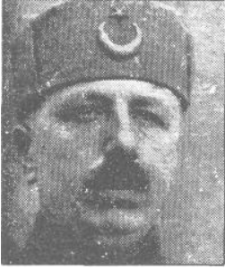
5. Süvari Kolordusu Komutanı Fahrettin (Altay) Paşa (TBMM Albümü, 1994, s. 39)

Batı Cephesi Komutanı İsmet Paşa ve 5. Süvari Kolordusu Komutanı Fahrettin Altay Paşa'yla (Ülger, 1996, s.186)