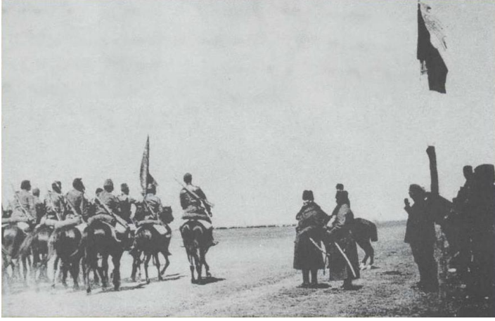
İlgin Manevrasında (1 Nisan 1922) (Ülger, 1996, s.187)