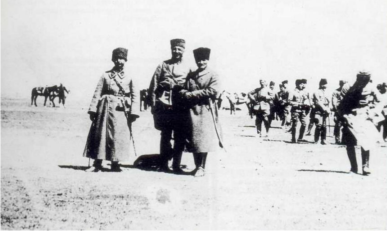
İlgin Manevrasında (1 Nisan 1922)

Batı Cephesi Komutanı İsmet Paşa ve 5. Süvari Kolordusu Komutanı Fahrettin Altay Paşa'yla (Ülger, 1996, s.186)