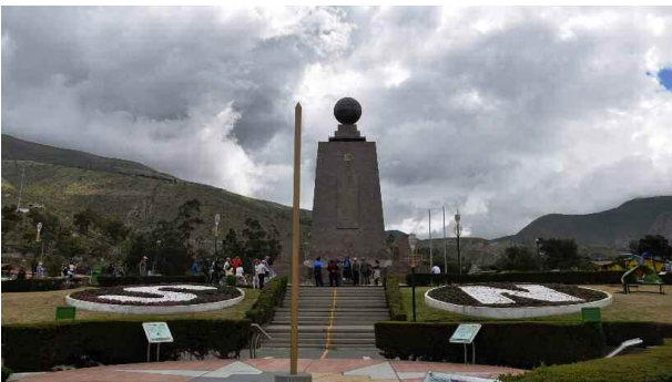
Fotoğraf 1. MITAD del MUNDO ekvator çizgisinin geçtiği varsayılan yer.

Ekvator Çizgisi'nin sembolik olarak gösterildiği "MITAD DEL MUNDO" Ekvador'un başkenti Quito kent merkezinin yaklaşık 30 km kuzeyinde bulunuyor. Buraya gününbirlik bir gezi yapıyoruz. İlk kez 1736 yılında Fransız Jeodezik Misyon'u tarafından tanımlanmış. İspanyolca anlamı, 'eşit olarak ikiye bölen. Çizginin geçtiği varsayılan bölgeye 1935 yılında Ekvador hükümeti tarafından 10 metre yüksekliğinde bir kule yapılmış. 1972 yılında bu kulenin yerine yeni bir kule 30 metre olarak inşa edilmiş. Kulenin ön ve arka tarafına Ekvator Çizgisini sembolize eden sarı renkli bir çizgi çizilmiş. Böylece neresi kuzey, neresi güney yarımküre anlayabiliyorsunuz. Günümüzde sıfır hatayla ölçüm yapan GPS cihazları bu sarı çizginin doğru olmadığını ve doğru çizginin yaklaşık 240 metre kuzeyde olduğunu söylüyor. Ekvator Çizgisinin olduğu yerde bulunmak oldukça heyecanlı (Fotoğraf 1-2).