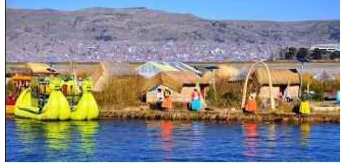
Fotoğraf 14. Totoralar aynı zamanda tekne yapımında da kullanılıyor.

ve ilaç yardımı yapıyor. Ayrıca yerliler el işi dokuma ve sazlardan yaptıkları hediyeliklerle kazanç sağlıyorlar. Uroslarla hatıra fotoğrafı çektiyoruz ve zor yaşamlarına katkı sağlamak için alışveriş yapıyoruz.