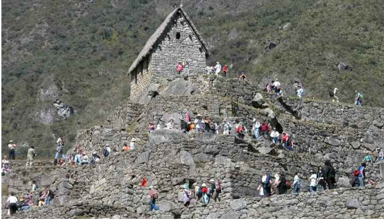
Fotoğraf 12. Machu Picchu dünyada en çok turist çeken yerlerden biri.

2011'den beri Dirección Regional de Cultura Cusco (DRC) tarafından alınan kararlar Machu Picchu'ya giriş kısıtlı. Çünkü bölgenin turist akınına uğramasının bazı deformasyonlar yarattığı gözlemlenmiş. Yağışlara bağlı toprak kaymaları ve şehrin zemine gömülmesi nedeniyle Machu Picchu'yu ziyaret edebilecek turist sayısı günlük 2.500 kişi olarak belirlenmiş (Fotoğraf 12).