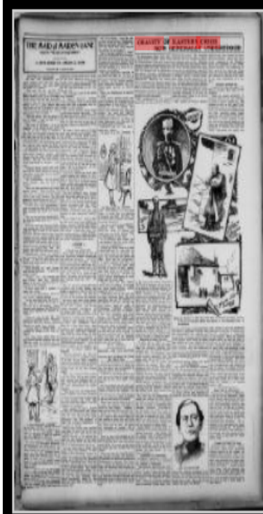
The Chanute times. (Chanute, Kan.), May 01, 1903, Image 9

Ek:2 ( Aynı Başlık Altında ve Aynı Formatta Yayınlanan Haber)