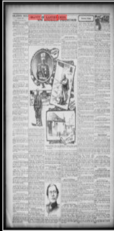
Phillipsburg herald. (Phillipsburg, Kan.), May 07, 1903, Image 2