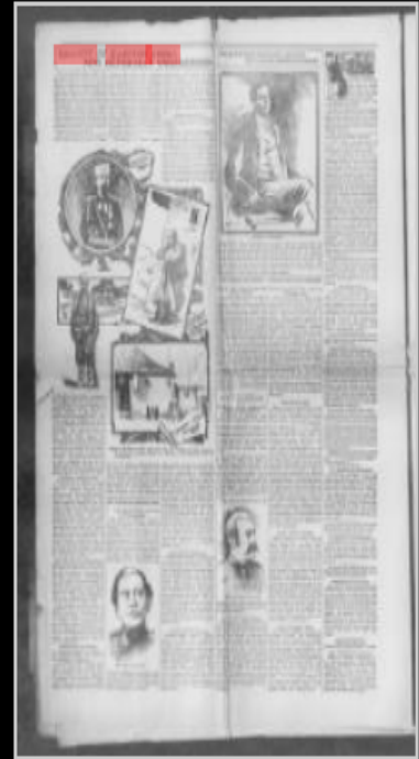
The Coalville times. (Coalville, Utah), May 01, 1903, Image 6

Ek: 3 ( İlinden İsyannında 50.000 Hristiyanın Öldürüldüğü İddia Edilen Haberler)