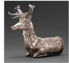
Resim 2. Gümüş Geyik Rhytonun Ağız Kenarında Yer Alan 4.5 cm. Enindeki Friz. Norbert Schimmel Koleksiyonu, New York