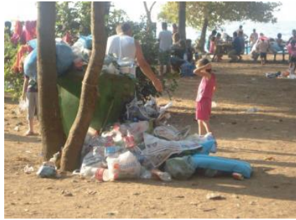
Şekil 6. Dilek Yarımadası Milli Parkı otopark kısmı ve yoğun kullanım yapılan alanlardaki çöpler.

Mili Park sınırları dâhilinde yerleşim alanlarının varlığı ve tarımsal faaliyetlerin devam ediyor olması, yönetsel ve kullanıma dayalı sorunların oluşmasına neden olmaktadır. Tarım arazilerinde sulama, gübreleme yapılması, hayvancılıkla uğraşanların hayvanları milli parkın içinde otlatması buradaki doğal