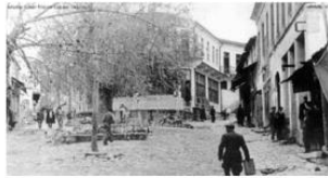
Aslanlar Sokak Girişi 1950ler