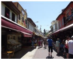
Kahramanlar Caddesi 2011