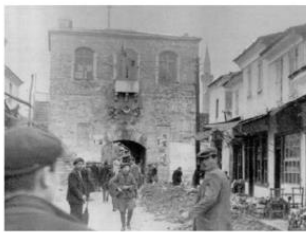
Kahramanlar Caddesi 1950ler