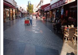
Sağlık Caddesi 2021