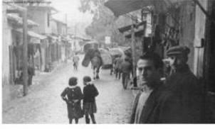
Barbaros Bulvarı 1950ler