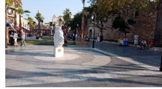
Barbaros Bulvarı 2021