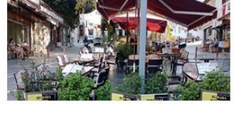
Aslanlar Sokak Girişi 2021