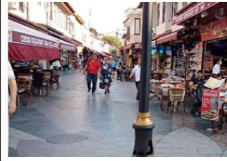
Kahramanlar Caddesi 2021