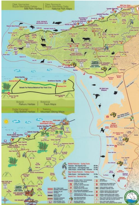
Şekil 7. Milli Park Haritası (visitaydn, 2023)

Milli Park içinde ekoturizm yaklaşımıyla birçok tur ve rota bulunmaktadır. Bunlar bisiklet turu, botanik turu, doğa yürüyüşü turu (trekking), foto-safari, kuş gözlemciliği turu, kültür yürüyüşü, manzara izleme ve yamaç paraşütüdür. Bu rotalarla ilgili oluşturulan haritalar bulunmaktadır.