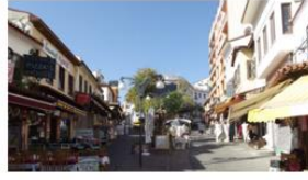
Aslanlar Sokak Girişi 2011