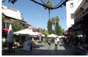
Barbaros Bulvarı 2011