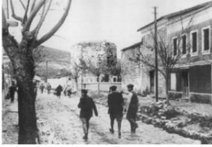
Sağlık Caddesi 1950ler