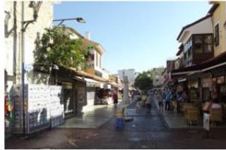
Sağlık Caddesi 2011