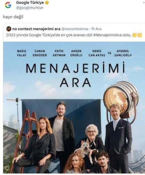
Şekil 5. Diyalojizm yapısıyla Twitter (X) örneği

Resimdeki içerik, Google Türkiye'nin sosyal medya üzerinde bir dizi ile ilgili yaptığı paylaşımı göstermektedir. Bu bağlamda, Bakhtin'in diyalojizm kavramını kullanarak, Google'ın bu etkileşime dâhil olmasıyla ilgili akademik bir yorum yapmak mümkündür.