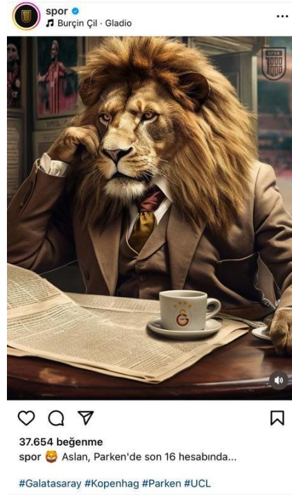
Şekil 3. Grotesk yapısıyla Instagram örneği

Bu görseldeki aslan figürü, grotesk realizmin öğelerini kullanarak futbolun ve özellikle Galatasaray Spor Kulübü'nün simgesel anlatısını canlandırmaktadır. Mikhail Bakhtin'in karnavalesk teorisinde grotesk, genellikle olağan dışı veya normları alt üst eden imgelerle ilgilidir. Aslan, Galatasaray'ın takım sembolü olarak güç ve cesareti temsil etmektedir. Burada bir insan gibi giyinmiş ve insan davranışlarını sergileyen aslan, Galatasaray'ın futbol dünyasındaki prestijli ve saygın yerini, karnavalesk bir yaklaşımla yeniden yorumlamaktadır.