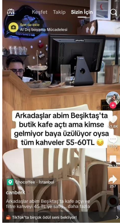
Şekil 4. Pazar Meydanı olarak TikTok örneği

Karnavalesk kuramın pazar meydanı boyutu, genellikle toplumun farklı katmanlarından insanların bir araya gelerek etkileşimde buldukları, sınırların ve hiyerarşilerin geçici olarak kalktığı canlı ve dinamik bir sosyal alanı ifade etmektedir. Mikhail Bakhtin'in kavramsallaştırdığı bu teori, halkın sesinin duyulduğu ve sosyal normların tersine çevrilebildiği bir alan olarak düşünülmektedir.