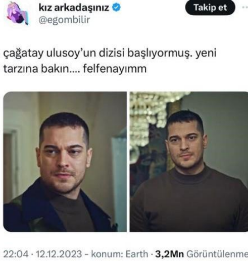
Şekil 6. Pazar Meydanı Dili yapısıyla Twitter (X) örneği

Paylaşılan görselde, bir sosyal medya kullanıcısının tanınmış bir dizi oyuncusunun yeni projedeki görünümüne ilişkin bir yorumunu içeren bir metin bulunmaktadır. Bu tür yorumlar, Mikhail Bakhtin'in karnavalesk kuramının bir alt boyutu olan pazar meydanı dilinin güncel bir tezahürü olarak değerlendirilebilir. Pazar meydanı dili, toplumun çeşitli kesimlerinin bir araya gelip serbestçe iletişim kurduğu, resmiyetin ve otoritenin sorgulandığı, halkın sesinin ve popüler kültürün yankılandığı bir alandır.