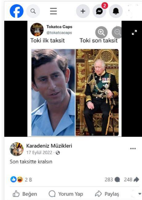
Şekil 1. Tepetaklak Dünya olarak Facebook örneği

Çalışmanın evrenini Türkiye geneli sosyal medya kullanıcıları oluşturmaktadır. Araştırmada karnavalesk kuramın unsurları olan karnaval gülüşü, grotesk, diyalojizm, tepetaklak dünya, pazar yeri dili ve pazar meydanı temel alınarak rastgele örnekleme ile seçilen paylaşımlara dair içerik analizi yapılmıştır. Çalışmada bu paylaşımların sosyal medya kullanıcıları üzerindeki etkileri ve bu tür paylaşımların toplumsal anlam ve önemi tartışılacaktır. Böylece sosyal medyanın sadece bilgi paylaşımı ve iletişim aracı olmanın ötesinde kültürel ve toplumsal ifadenin zengin ve çeşitli bir alanı olarak nasıl işlev gördüğüne dair derinlemesine bir anlayış elde edilecektir.