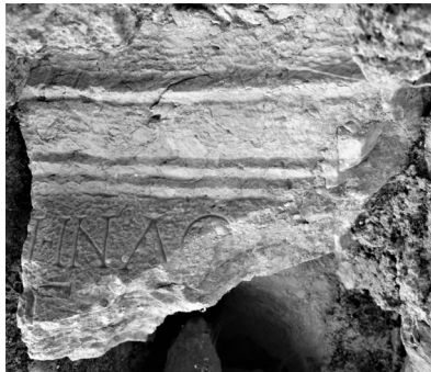
Fig. 4 Yazıt nr. 4