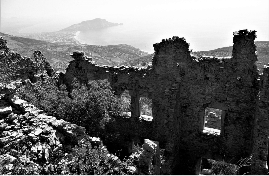
Fig. 6 Hamaksia'dan Korakeion'a Bakış