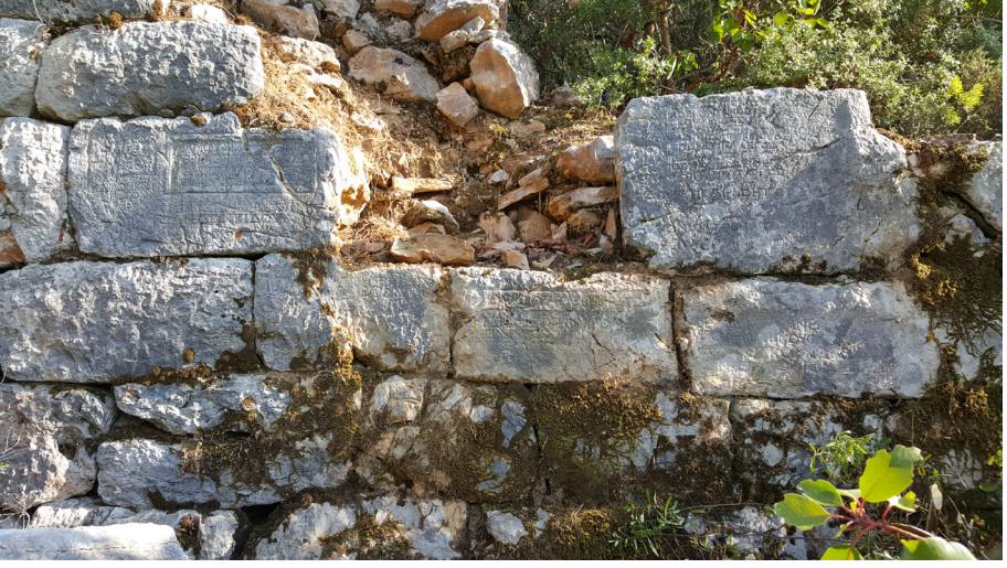
Fig. 8 Hermes Rahip Listeleri