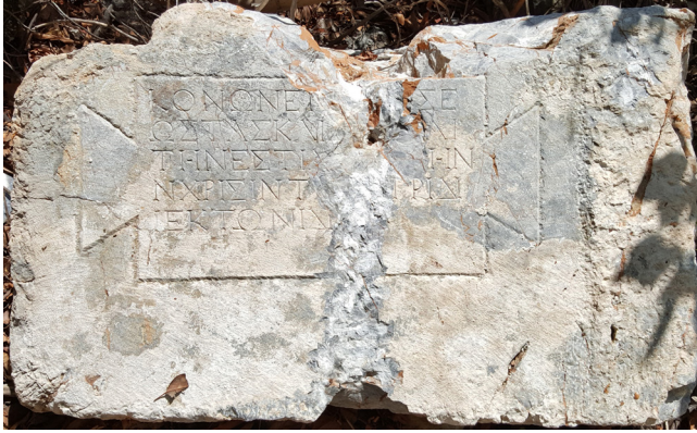
Fig. 1 Yazıt nr. 1