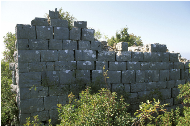
Fig. 7 Hellenistik Kule