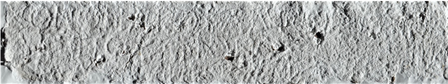
Fig. 3 Yazıt nr. 3