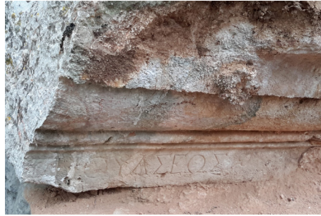
Fig. 2b Yazıt nr. 2 Blok B