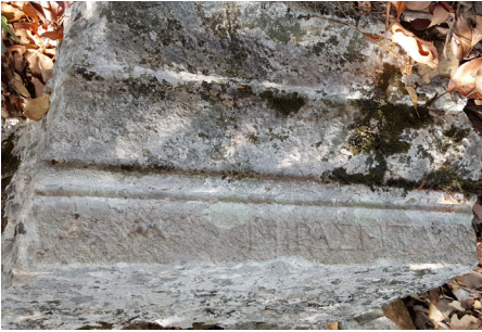
Fig. 2a Yazıt nr. 2 Blok A