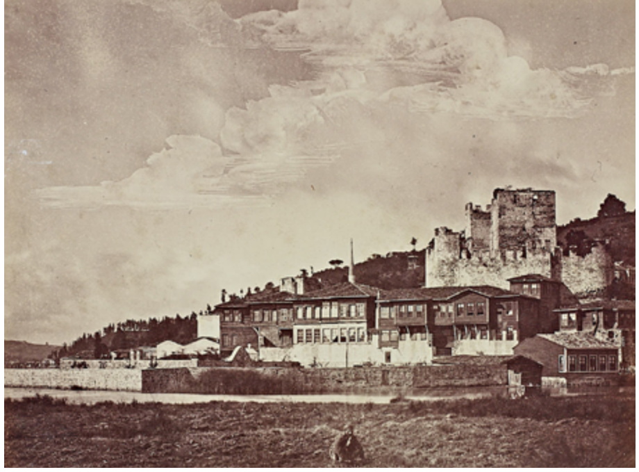
Şekil 5: Anadoluhisarı genel manzarası. (...)

tehlikesine karşı yapının çatı kısmının demir kiriş üzerine Marsilya kiremidi kaplamalı olmasına karar verilmiş bu da maliyeti artırmıştır. Yapılan bu ikinci keşifte duvarların altında temel olmadığı ve harap halde olduğu tespit edilince ilk keşifte bahsedilen inşanın mümkün olmadığı anlaşılmış bu nedenle duvarların yıkılarak yeniden yapılması planlanmıştır. 36