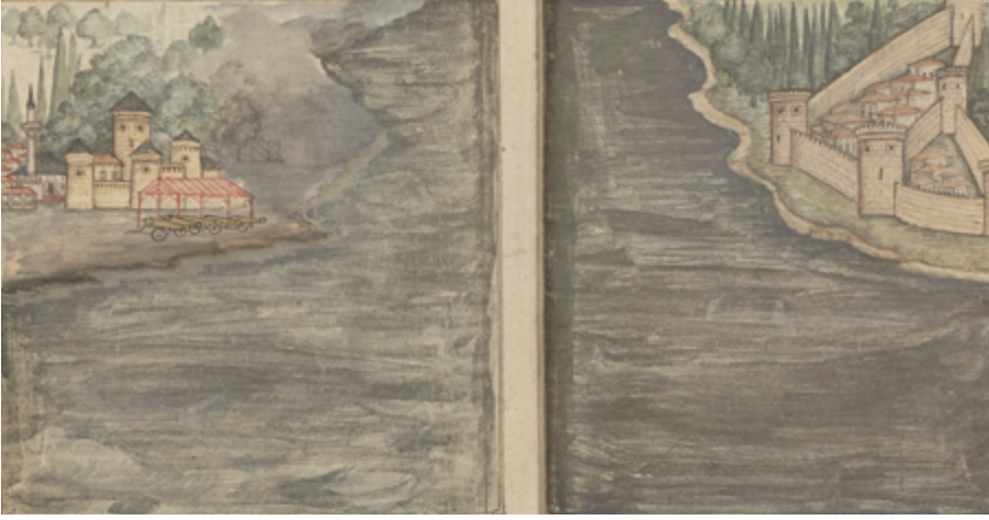
Şekil 1: Anadolu ve Rumeli hisarlarının tasviri. Nevizade Atayî, Hamse , Milli Saraylar İdaresi Başkanlığı Topkapı Sarayı Müzesi Kütüphanesi, R.816, 71b-72a.

çikan yangındır, dolayısıyla belge ve kitabe birbirini doğrulamaktadır. Ayrıca II. Abdülhamid dönemine ait onarım bitirildikten sonra—gelenek olduğu üzere—caminin giriş cephesi üzerine yerleştirilmiş olan kitabe yapı yıkılırken sökülüştür. Minarenin inşa edilen yeni yapıya taşınmasının ardından da demir bir çerçeve içerisine yerleştirilerek kaidesine asılmıştır. Bilindiği üzere kitabelerin yerleştirilmesinde böyle bir uygulama bulunmamaktadır. Yapım ve onarım kitabeleri mutlaka yapının cephesindeki bir yere gömülerek yerleştirilir.