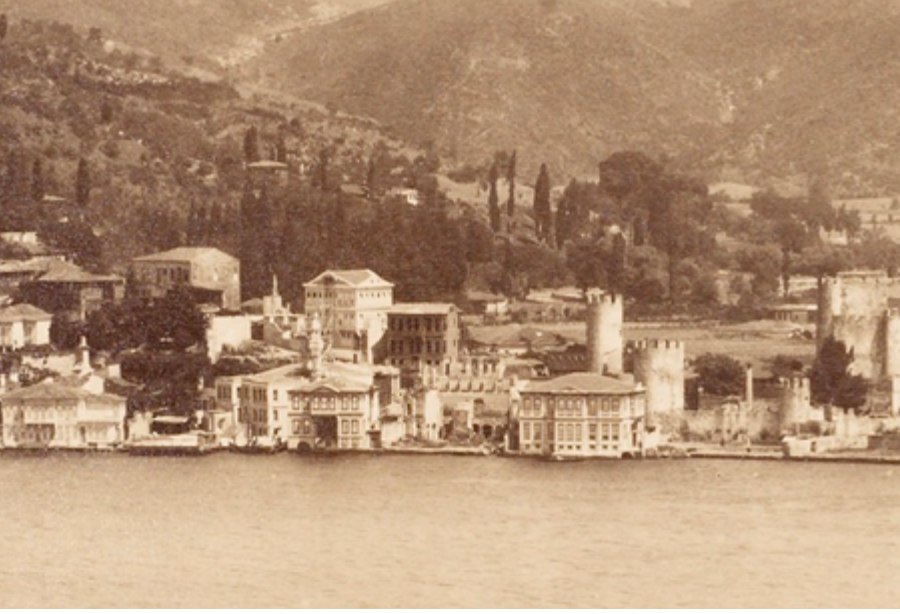
Şekil 6: 1883 yılına ait bu fotoğrafta caminin minaresinin yapım aşamasında olduğu etrafına kurulmuş iskeleden anlaşılmaktadır.

II. Abdülhamid dönemindeki 18 Ekim 1880 tarihli belgede çizilen plan ve mekân düzeni II. Mahmud döneminde düzenlenen 5 Aralık 1836 tarihli masraf defterinde tasvir edilmiştir. Dolayısıyla yapının II. Abdülhamid döneminde sahip olduğu plan ve mekân düzeninin II. Mahmud döneminde tasarlandığı, Sultan Abdülmecid döneminde de uygulamaya alındığı ortaya çıkmaktadır.