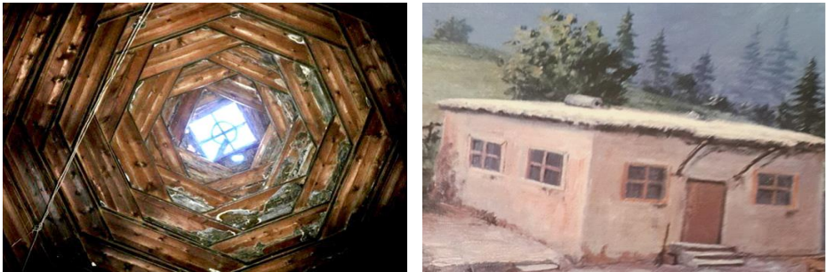
Fotoğraf 3. Yapının iç kısmında bulunan tavan motifi (Kırlangıç-Tüteklikli Örtü örneği) (a) ve evin BACA görünümü (b).

Birçok yerde olduğu gibi, Erzurum evlerinin yapımında, iklim koşulları ve sosyoekonomik durumun göz önüne alınması neticesinde, o yörede bolca bulunan ve ucuz olan malzeme türleri kullanılmıştır (Soylu, 2000: 200). Geleneksel Erzurum evlerinin temel yapı malzemesi “karataş, boztaş ve kamber taşı” türleri olup (Yılmaz, 2013: 55), taştan sonra en çok kullanılan yapı elemanı ise ahşap olmuştur. Duvarları bağlayan hatillar (taş duvarlara belli aralıklarla yatık olarak konan ahşap tabaka), toprak örtüyü taşıyan kirişler, yer döşemeleri, tavanlar ve bütün doğramalar ahşap malzemeden yapılmıştır. Ahşap malzemeler için kullanılan ağaç türleri içerisinde sarıçam, kavak ve söğüt en çok kullanılan türlerdir. Özellikle çatıların örtülmesinde örtü malzemesi olarak, duvarların örülmesi esnasında ise kaynaştırıcı malzeme olarak kullanılan toprak, geleneksel Erzurum evlerinin en fazla kullanılan malzemeleri arasındadır (Fotoğraf 3). Soğuk havadan korumak ve ısı kaybını azaltmak için duvarlar, 80-100 cm kalınlığında inşa edilmiş ve kireç harcı ya da kil ile sıvanmıştır (Kırbaş & Hızlı, 2016: 792).