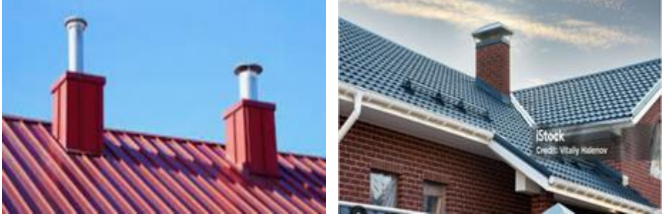
Fotoğraf 1. Duman veya gaz çıkışı sağlayan baca örnekleri (URL-1).