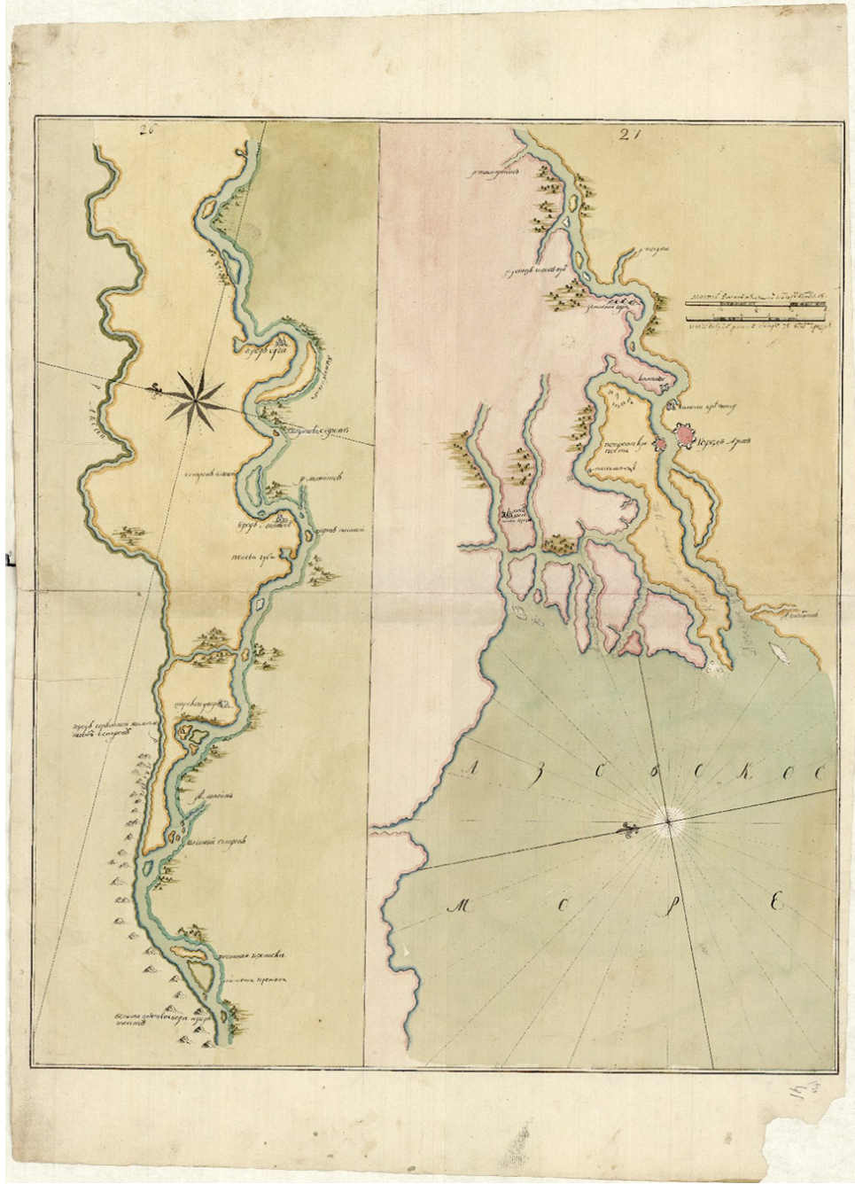
Harita 2: Don Nehri'nin Azak Denizi'ne döküldüğü yeri ve Azak Kalesi'nin bulunduğu konumu. (RGAVMF, F. 1331, Op. 4, D. 746, L. 40ob-41).