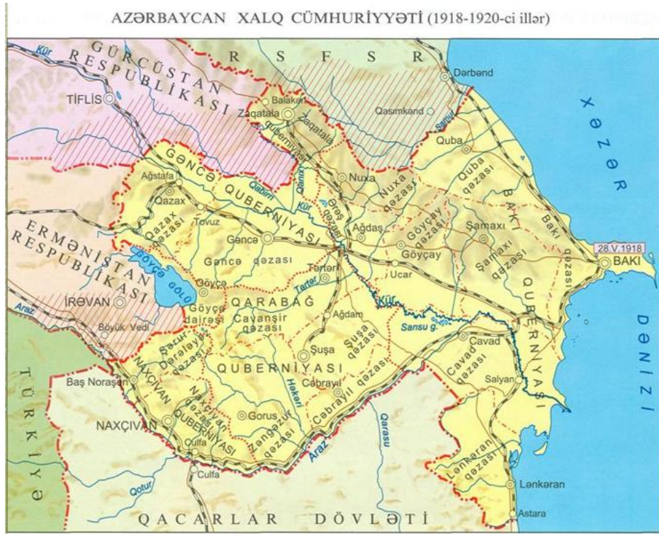
Harita 2: (1918-1920 Yılları Arasında Azerbaycan Halk Cumhuriyeti Haritası, t.y.)

taşeronluğunu yürütüyor görünmektedir. Yukarıda işaret ettiğimiz Azerbaycan'ın 2020 yılı sonbaharında gerçekleştirdiği bir buçuk aylık Karabağ harekâtı, bölgede ve mücavir alanda yaklaşık 30 yıl sürmüş Ermeni işgalini sonlandırmıştır. Bu harekâtın Azerbaycan açısından başarılı olduğu açıktır. Ancak 10 Kasım 2020'de imzalanan ateşkesin ardından savaş sonunda Zengezur'un tazminat olarak Azerbaycan'a verilmesi ve "Zengezur Koridoru" gibi mühim meseleler gündeme gelmiştir. Herhangi bir neticeye varılamamakla beraber diplomasi'nin uzun yolculuğu, Azerbaycan'ın toprak bütünlüğünün sağlanması için gündemde kalmaya devam etmektedir. Azerbaycan'ın hatta Türk dünyasının bu ilimikten kurtulması, bugün adı geçen koridorun açılması bilhassa Türkiye ve Azerbaycan arasındaki ilişkilerin güçlendirilmesi anlamına gelmektedir. Aynı zamanda Türk dünyası ile de ekonomik ve kültürel ilişkilerin gelişeceği de öngörülmektedir. Dolayısıyla bu koridor sadece bölgesel değil küresel anlamda bir etkiye sahip olacaktır.