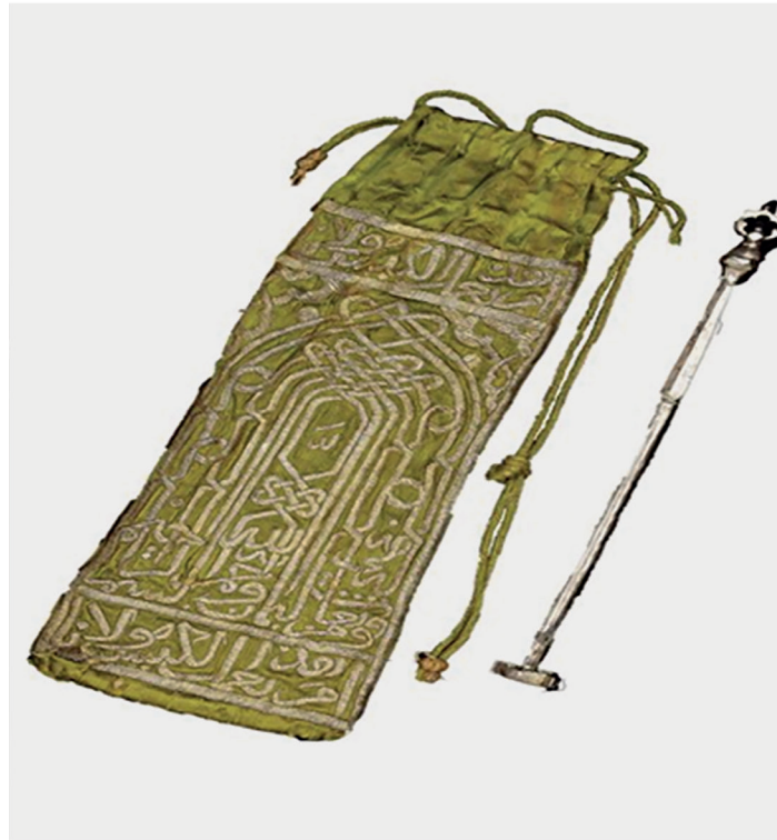
Ek 1: Topkapı Sarayı Müzesi, Kutsal Emanetler, Millî Saraylar Koleksiyonu (Kâbe Anahtarı ve Kesesi): No: 21/16