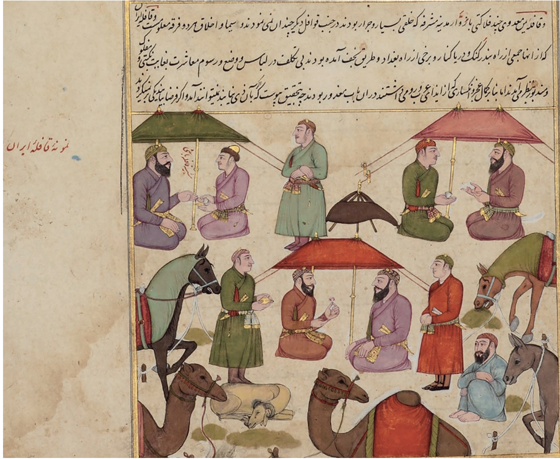
Ek 2: 1677'de Mekke'de İran hac kafilesi.

(L. York Leach, Paintings from India, The Nasser D. Khalili Collection of Islamic Art , (London: 1998, cat. 34), 8: s. 124-9.)