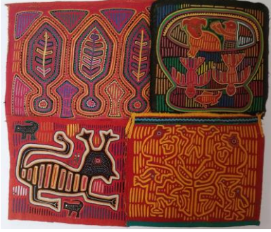
Şekil 6. Çok renkli Mola örnekleri, 19.yy (Schoeser, 2003: 174)

kumaş katmanlar halinde üst üste birleştirilir ve sonra tasarımın şekillendirilmesi için katmanlar sırasıyla kesilerek kenarlar kıvrılır ve görünmez dikişle dikilir. Her kesim ve kıvrımda alta yerleştirilen renk ortaya çıkar (Şekil 6).