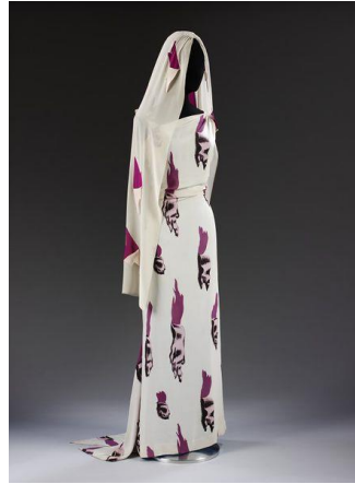
Şekil 9. "Tears Dress", Elsa Schiaparelli, (1890 – 1973). http://collections.vam.ac.uk (Erişim: 03.02.2017)

Schiaparelli'nin 1938 yılına ait 'Circus Collection' defilesinin bir parçası olan, soluk mavi suni ipek ve ipek karışımı krep dar uzun elbise, gözyaşı şeklinde açılan boşluğa applike edilen magenta rengi kumaş ve pembe tonlarındaki baskılarla dekore edilmiştir. "Tears Dress" isimli bu elbise Victoria&Albert Müze Koleksiyonunda yer almaktadır (Şekil 9).