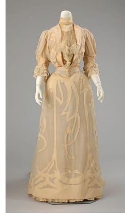
Şekil 7. 1901 yılına ait ters applike tekniği kullanılmış gelinlik. http://www.metmuseum.org , (Erişim: 26.03.2017)

Giysiler üzerinde geniş desen ve doku alanları yaratan applike teknikleri, farklı malzeme ve tekniklerle yorumlanarak, farklı yıllarda tekrar ortaya çıkmıştır. Araştırılan kaynaklar göz önüne alındığında, bilinen ilk örneklerinden biri, Metropolitan Sanat Müzesi'nde bulunan, 1901 yılına ait İtalyan gelinliktir. İncelenen görsel belgeye göre, bu gelinlikte, iki kat kumaşın çeşitli dikiş teknikleriyle bir araya getirilmesiyle, ters applike tekniğinin uygulandığı anlaşılmaktadır. Üstteki yün kumaşta oluşturulan desenler kesilerek çıkarılmış, alt zemine, ipek kumaş yerleştirilerek etkili bir görüntü elde edilmiştir (Şekil 7).