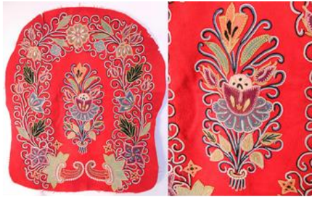
Şekil 3. Yün kumaşın zincir dikiş ile aplikeli edildiği, İran aplikeli, nakışlı Antik Resht, 19.yy, http://www.1860-1960.com . (Erişim: 12.02.2017)