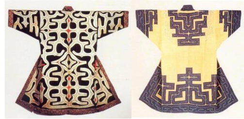
Şekil 5. İşleme ile kombine edilmiş applike deseni (Yang ve Narasin, 2000: 124-125)

Yeryüzünde varlığını kabul ettiren bütün kültürlerde olduğu gibi, Japon tarihinin ilk dönemlerinden beri süsleme ve işlemler önemli yer tutmaktadır. En önemli örneklerden biri de Japon Ainu kadınları tarafından uygulanan aplikelerdir. Giysilerine, simetrik olarak yerleştirdikleri geleneksel motifleri applike etmişler, zemin kumaşı üzerine simetrik yerleştirdikleri motifleri, zincir dikiş, sık iğne, ilik ve sarma dikiş tekniklerini kullanarak işlemişlerdir. Applike edilen motifler simetrik ve bu motiflerin, giyen kişinin bütün vücut parçalarını koruduğuna inanılmaktadır. Motiflerin yerleşmesi de aynı önemi taşımaktadır (Şekil 5). “ Kol ağzı açıklığı, yaka açıklığı ve etek uçları, giyenin vücuduna girmek isteyen kötü ruhları tutmak için dekore edilmiştir ” (Yang, 2000: 124-125).