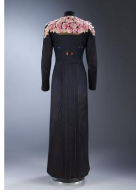
Şekil 10. Gece Mantosu, Elsa Schiaparelli, (1890 – 1973)

Schiaparelli'nin bu siyah ipek mantosu, ayak bileğine kadar uzun, astarlı, yakasız ve siyah tek düğmeli bel hattına sahiptir (Şekil 10). Elsa Schiaparelli tarafından tasarlanan bu muhteşem gece mantosu, Cocteau ile olan yakın sanatsal işbirliğinin en güzel örneklerinden biridir. Cocteau, Fransız sanatçı, şair ve film yapımcısıdır.