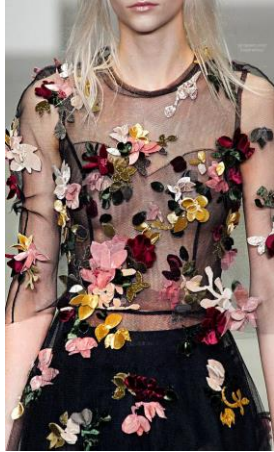
Şekil 13. John Rocha, 2014 sonbahar/kış koleksiyonu. http://nowfashion.com/john-rocha (Erişim: 20.03.2017)