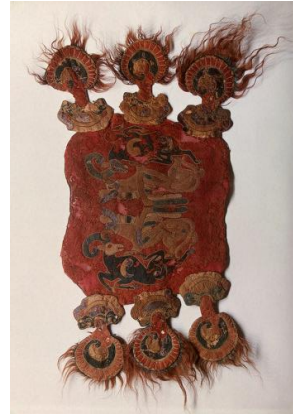
Şekil 2. Pazırık Kurganı'nda bulunan applike eyer (Demirkan ve Batur, 2009: 122)

Tarihi süreç içerisinde, en önemli applike örneklerinden bazıları da çeşitli kaynaklarda da aktarıldığı gibi Orta Asya Türklerine aittir. Türk el sanatlarının ilk örneklerinin bulunduğu Pazırık kurganı çok önemli bir yere sahiptir. (Şekil 2) "Pazırık ve Noin Ula Kurganlarında bulunan kırmızı, mavi, sarı, beyaz renkli keçe parçaları ile yapılmış eyer örtüleri, örtüler, perdeler Asyalıların M.Ö. 1.yy.'da kumaş boyama ve applike yapmadaki ustalıkları göz önüne sermektedir" (Barışta, 1995: 6).