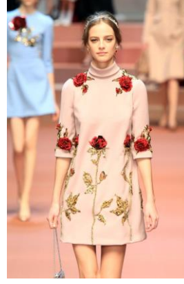
Şekil 15. Dolce & Gabbana, 2015 sonbahar/kış koleksiyonu http://www.glamourparis.com (Erişim: 26.03.2017)