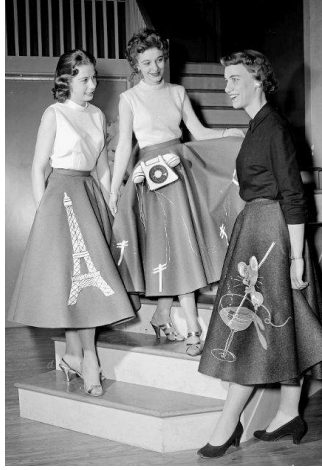
Şekil 11. 1955 yılı, poodle etek. https://i.pinimg.com/originals (Erişim: 12.03.2017)

Klasik ve çağdaş sanat akımlarının ve bu dönem sanatçıların eserlerinin yanı sıra sosyal, ekonomik, politik olaylar moda dünyasının şekillenmesinde etkin olmuş, disiplinler arası bu etkileşim, giysi tasarımcılarının, sanat ve sanatçıyla birlikte çalışmasına olanak sağlamıştır. Bu yaklaşım giysiyi zamanla bir sanat nesnesine dönüştürmüştür. Kavramsal yaklaşımlar, farklı malzeme arayışları, her türlü malzemenin kullanılabilirliği özgün tasarımlara zemin hazırlamıştır. Daha çok, uzay çağı temasının vurgulandığı 60'lı yıllarda başlayan bu deneysel yaklaşımlarla ortaya çıkan yenilikçi ve özgün giysi tasarımları, günümüz modasına da şekil vermiştir. Bugün teknolojik gelişmelerin de etkisiyle hızlı tüketim göz önünde bulundurularak, hedef kitleyi etkileyen basit düz formlu giysiler üzerine, yenilikçi tekniklerle her türlü malzemenin kullanıldığı, kumaşta doku, boyut, derinlik ve yarılsama etkisinin yaratıldığı yüzey düzenlemeleri oluşturulmaya çalışılmış ve bu yaklaşımlar, makalenin konusu olan applike tekniğinin sınırsız gelişiminde etkin rol oynamıştır.