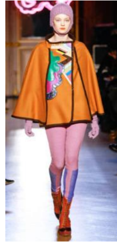
Şekil 12. Tsumori Chisato, Sonbahar-Kış 2011 koleksiyonunda.

2014 sonbahar/kış koleksiyonlarının sergilendiği, Londra Moda Haftası'nda applike