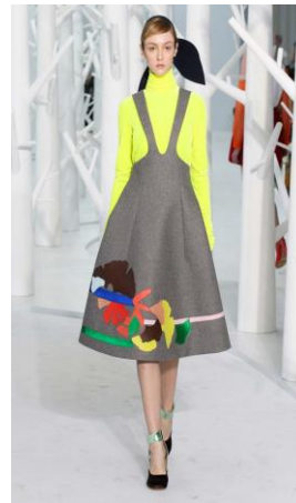
Şekil 17. Delpozo, 2015 sonbahar/kış koleksiyonu https://www.modaoperandi.com/delpozo (Erişim: 28.03.2017)