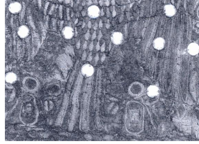
Şekil 1. Tutankhamun Mezarından çıkan applike ve nakışlı tunik (Shaw ve Nicholson, 2000: 280)

Yeni Krallık dönemine ait, Tutankhamun mezarından applike ve nakış teknikleri ile süslenmiş kıyafetler bulunmuştur. Bu applike kullanımının ilk örnekleri arasında yer almakta ve büyük önem taşımaktadır (Şekil 1). Bu applike nakışlı tunikte, düz zemin üzerine kırmızı ve mavi şeritlerden oluşan akbaba motifi tasvir edilmiştir. Amarna'da bulunan bir başka applike örneği de düz zemin üzerine renkli tekstil aksesuarlarıyla süslenmiştir. Fakat applike örneğinin yapım ve kullanım amacı bilinmemektedir ve bu tekniğin sadece kraliyet giysilerinde kullanılmadığını kanıtlamaktadır (Shaw ve Nicholson, 2000; 280).