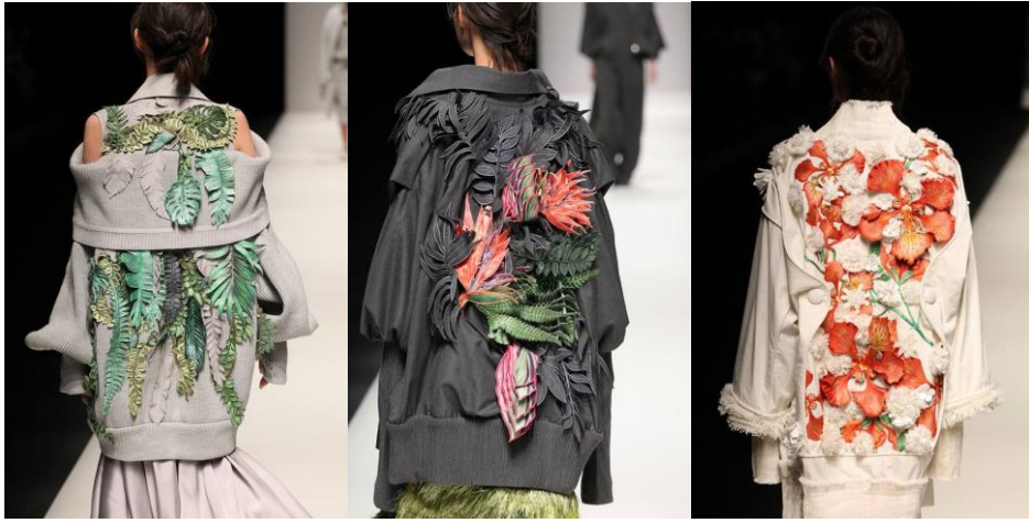
Şekil 18. Nguyen Cong Tri, Tokyo Moda Haftası sonbahar/kış 2017

estetik görünümleri farklı boyutlara ulaşmıştır (Önlü,2004: 92-93). Gelişen teknolojinin desteklediği yaratıcılıkla birlikte, yenilikçi kumaşlar üzerinde manipülasyonlar yaratarak applike tekniğini, giysilerde doku, renk ve desen açısından üçüncü boyuta taşıyan, bu sayede tasarımcıların koleksiyonlarında yenilikçi fikirler ve güçlü etkiler yaratan özgün tasarımlar görülmeye başlanmıştır.