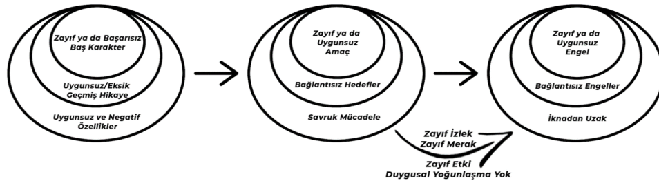
Şekil 2. Başarısız dizilerin logline kuruluşu

Bütünüyle bakıldığında başarısız dizilerin logline öğelerinin oldukça dağınık olduğu, hikayelerinin baş karakterlerini genelde tayin etmedikleri, amaçlarının muğlak olduğu ya da inandırıcı olmadığı, engellerinin de aynı şekilde muğlak ve tek boyutlu olduğu ortaya çıkmaktadır. Bu durum hikayelerin işlenişine de yansımakta, bu dizilerin 3 perdeli yapıya uymadığı, oldukça dağınık bir hikaye anlatım tarzı benimsediklerini göstermektedir. Bu türden dizilerin logline yapısı aşağıdaki şekilde görselleştirilebilir.