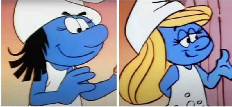
Şirine'nin Eski ve Yeni Hali