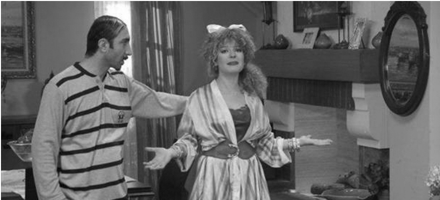
Resim 7: Çocukların sosyal medyada paylaştıkları video görüntüsü

Berkowitz'e göre, şiddet gösterimini izlemek arınma yaratmak şöyle dursun, saldırganlık eğilimini arttırmakta; bu ise, yaşamda şiddete yöneltebilmektedir. Bandura ve diğerlerine göre, şiddet gösterimini izlemek kişiye şiddet örneklerini öğretip kazandırmakta; çevremizdeki diğer modellerde olduğu gibi, kitle iletişimi araçlarındaki şiddet gösteriminden öğrendiğimiz bu modellerden de ilerisi için davranışa hazırlık biçimleri edinmemize yol açmaktadır. Böylece; ileride, benzer bir durumla karşılaştığımız herhangi bir anda o zamana kadar unutulmuş gibi duran bu davranışsal hazırlıklarımız, küçük bir belirtken uyarı ile karşılaşır karşılaşmaz aktifleştirmekte; şiddet davranışlarında bulunmamıza yol açmaktadır. (Bandura, 1977: 30) Şiddet gösterimini izlemek Bandura'ya göre, kişiye şiddet enformasyonlarını öğretmektedir. Birey, öğrendiği anda değil, benzer olaylarla karşı karşıya kaldığı gerekli olduğu anlarda kullanılmaktadır.