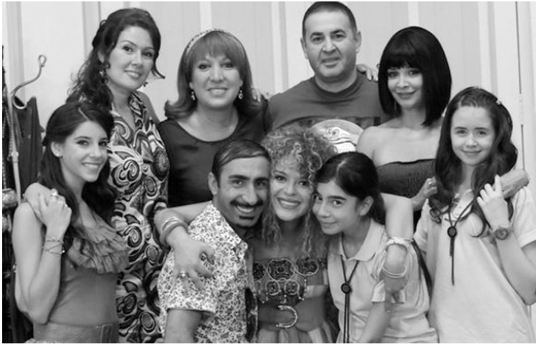
Resim 1: “Alemın Kıralı” dizi oyuncuları

Dizilerde şiddet konusu, en yaygın kitle iletişim araçlarından biri olması gerekçe gösterilerek daha çok televizyon içeriklerinin incelenmesi yöntemiyle ele alınmaktadır. Televizyon geniş kitlelere ulaşmanın en kolay yoludur. Araştırmamızda ATV televizyon kanalında yayınlanan “Alemın Kıralı” dizisi ele alınmış, dizide yer alan kadına yönelik şiddet sahneleri incelenmiştir