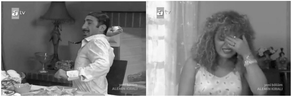
Resim 4: Kubat karakterinin eşi Nihale'ye uyguladığı şiddet görüntüsü

Kubat ve Nihale'nin birlikte görüldüğü her sahnede ortam neresi olursa olsun şiddet görüntüleri ve gülme efektleri bulunmaktadır.