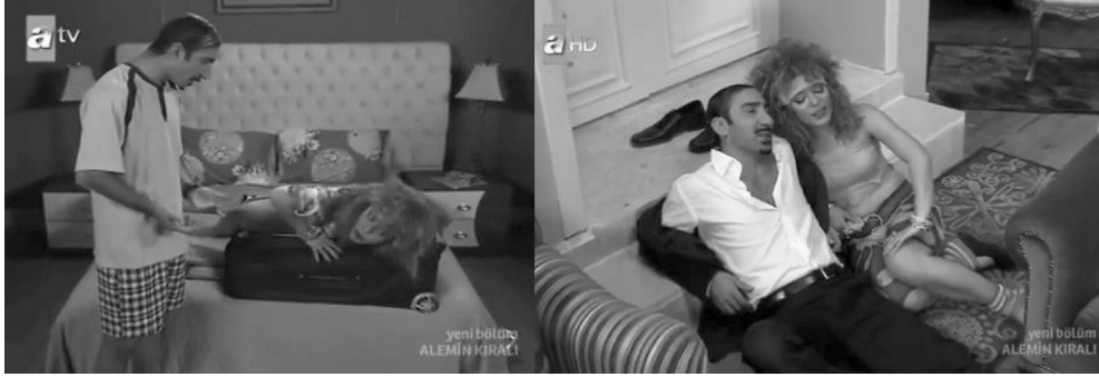
Resim 5: Kubat karakterinin eşi Nihale'ye uyguladığı şiddet görüntüsü

Yukarıda yer alan görüntülerden ilkinde Kubat eşi Nihale'yi ceza olarak bir bavula koyup bavulun içinde bekletmektedir. İkinci görüntüde ise Kubat eşi Nihale'yi dövmekten, Nihale ise dayak yemekten yorulduğunu söylemektedir.