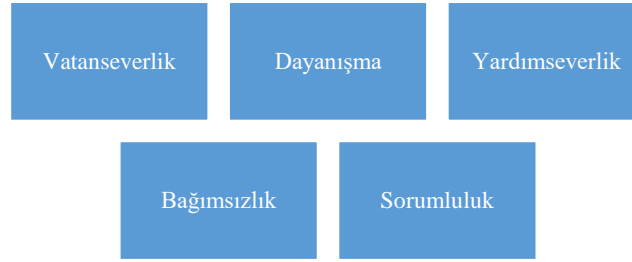
Ateşten Gömlek Romanında Yer Alan Değerler

Ateşten Gömlek romanında şekil 1’de de görüldüğü gibi Sosyal Bilgiler Öğretim Programı’nda (MEB, 2018) yer alan beş değer yer almaktadır. Bu değerler vatanserverlik, yardımseverlik, dayanışma, bağımsızlık ve sorumluluk şeklindedir. Bu değerlere ilişkin kitapta bulunan bulgular aşağıda verilmiştir: