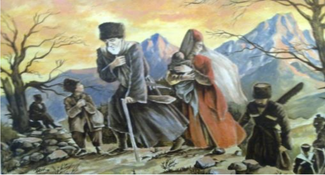
Görsel 1: Çerkes Göçü-1860 (Özbay, Çerkes Göçüyle Tetiklenen Evlâtlık Uygulamaları, 2014)

1860'da Kırım Savaşı sonrasında Kafkas göçmenlerin Osmanlı topraklarına kitleler halinde gelişi, evlâtlık kurumu açısından bir dönüm noktası olarak ele alınabilir. Bu göçle Çerkez köle ticareti yeniden canlanmıştır. Savaş ve göç sırasında kimsesiz kalan, fakir çok sayıda kız çocuk ve kadın cami avlularında satılmıştır. Şen, 1864-1866 yıllarında Kafkas göçmenlerinin köle yapılmalarını önlemek için devlet eliyle evlâtlık olarak ailelere dağıtıldığını anlatmaktadır. Bu rastladığımız, devlet eliyle kız çocukların evlere ilk toplu dağıtımı örneğidir. Belki de evlâtlık kurumunun köle benzeri bir hizmetçiliğe dönüşmesinde etken olan bir olaydır. Şen'e göre bu yeni politika köleciliğin ortadan kalkmasında etkin olmuştur. (Özbay, 2014) (Bkz Görsel 1).