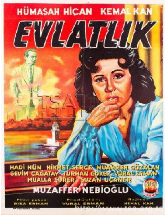
Görsel 2: 1959 yapımı yönetmenliğini Kemal Kan'ın yaptığı siyah-beyaz film... (Kan, 1959)

Türkiye Radyo ve Televizyonları (TRT)'de uzun yıllar çizgi dizi olarak yayınlanan Johanna Spyri 'nin 1881'de yayınlanmış kitabının çıplak ayaklı kahramanı Heidi de yetim bir kız çocuğudur. İsviçre 'de verdingkinder her ne kadar “Sözleşmeli Çocuk” olarak çevirile de, aslında “Köle Çocuklar” anlamına gelen ve çıplak ayaklarıyla bilinen çocukların dramatik hikâyesi olarak anlatılmıştır (2013).