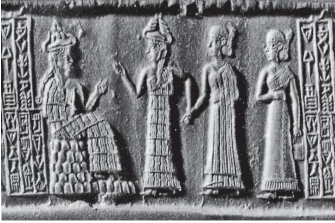
Fig.1 Akad Dönemi Tanrıça Lama'nın Sunumu

balık ve yeni sürgünlerin miktarı hakkında bilgi vermesini sağlamak amacıyla, Gudea'nın balıkçılık müfettişi Lama'yı Tanrı Ningirsu'ya tanıttı... 28