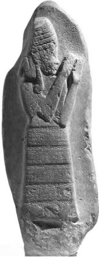
Fig. 2 Babil-Kasitler Dönemi Koruyucu Tanrıça Lama Yazıtlı Heykeli (Brinkman, 1976)

KUBABA ve LAMA'nın koştur bir biçimde tapınım gördüğü anlaşılan Mezopotamya'daki temel ayırım Asur, özellikle Yeni Asur kayıtlarıyla netleşmeye başlamıştır. Mezopotamya'da dişil özellikleri ve koruyucu tanrıçalıklarıyla anılan bu iki kutsal unsurun Anadolu'daki yansımaları yine benzer, ancak betimlenmeleri, özellikle LAMA'nın, farklılıklar arz etmiştir. KUBABA ve LAMA Geç Tunç Çağı sonlarına doğru Sumer kökenli, Anadolu ve Doğu Akdeniz coğrafyalarına özgü hale getirilmiş bir inancın temel figürlerini oluşturmuştur.