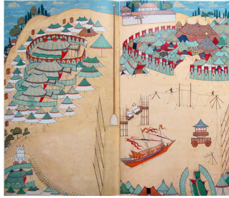
Fotoğraf:6 1720 düğününde Okmeydanı'nda kurulan çadır kent tasviri, III. Ahmed Surnamesi