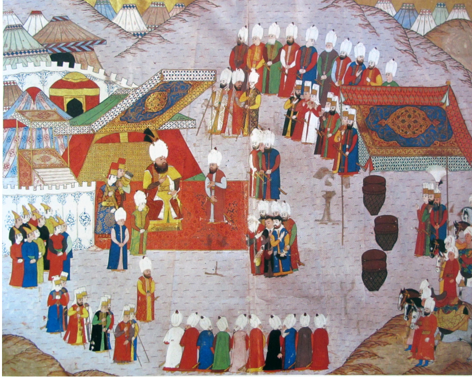
Fotoğraf:9 III. Mehmed'in otağında Macarları kabulü, Şehname-i Sultan Mehmed III, 1596

örneklerini minyatürlerde görmek mümkündür. Bu minyatür örneğindeki ziyafet çadırı da son derece görkemli ve süslüdür. Kırmızı çadırın üzerinde şemse formunun içinde altınla çalışılmış stilize çiçek ve yapraklardan oluşan bir kompozisyon vardır. İki yana açılan eteğin içi yeşil renkte, üzerinde tekrar eden ve içi stilize desenle süslenmiş formlar vardır. Padişahın yastığı pembe üzerine altın rengi, oturduğu minderi ise turuncu üzerine kırmızı stilize desenlerle süslenmiştir. Çadırın iki yanındaki gölgeliklerde ise lacivert-turuncu ve lacivert- türkuaz renkli bordür içerisinde pembe üzerine kırmızı çift tahrirli bir kompozisyon uygulanmış ve desenin boşluklarında ise altın kullanılmıştır. Yine bu minyatür örneği de, çadırda renkli, altın işlemeli ve değerli kumaşların kullanıldığının kanıtıdır.