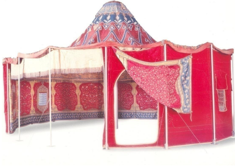
Fotoğraf:5 Askeri Müzede korunan Sultan II. Mahmut'a ait tek direkli çadır örneği

Estetik açıdan bakıldığında, bütünüyle birer sanat eseri olan otağların iç düzenlemeleri de oldukça zengin ve göz kamaştırıcı, tabanına altın ve gümüş teller ilâvesiyle dokunmuş ipek halılar serilir, kıymetli halılar ve kumaşlarla örtülü sedirlerin üzerlerine özenle işlenmiş yastıklar konulur ve bütün bölümler sarayda olduğu gibi değerli taşlarla bezenmiş altın ve gümüş eşya ile tefriş edilirdi (Çürük, 1993, s.163). Bu çadırlar etrafı en iyi şekilde gören küçük tepeler üzerine kurulur, boyutları ve dış süslemeleri ile diğer çadırlardan ayrılan bir tür ve İslam öncesi Türk hakanlarından devam ettirilen bir gelenektir.