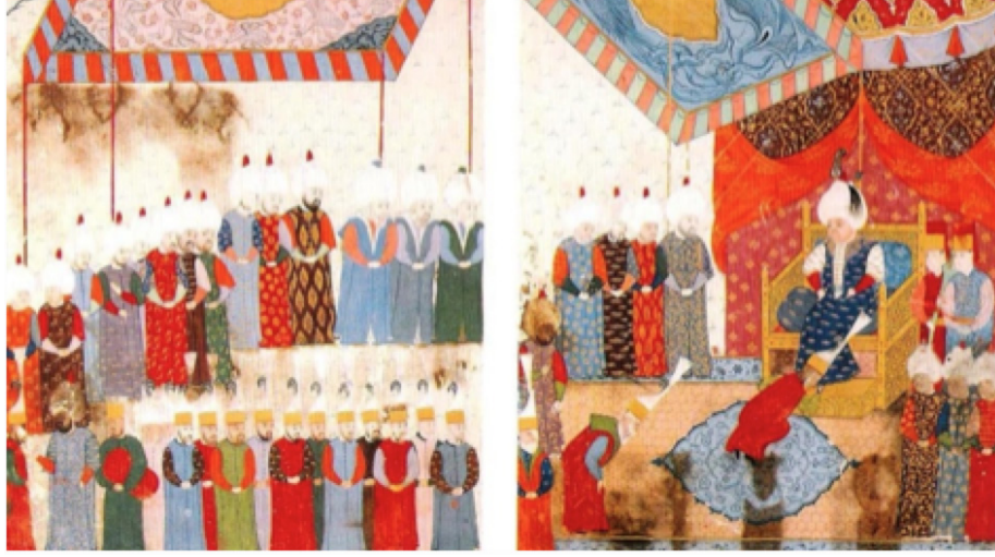
Fotoğraf:10 II Selim'in cülus töreniyle tahta çıkışı, Nüzhet-el Ahbar el-Esrar der Sefer-i Sigetvar