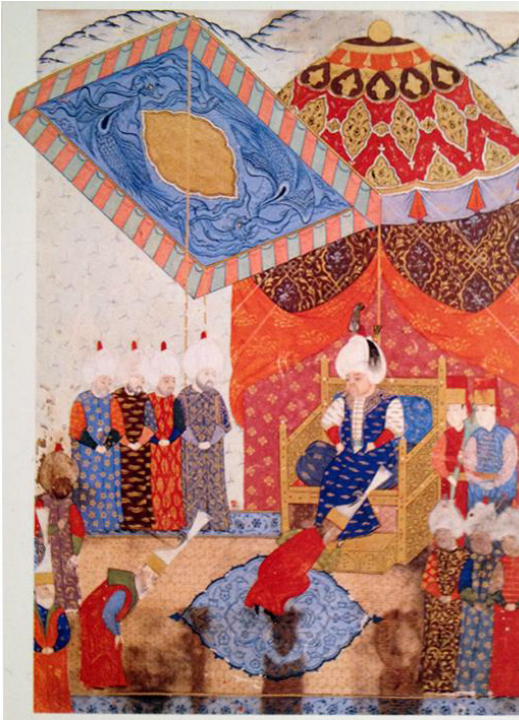
Fotoğraf:14 Kanuni'nin cülusu, Nüzhet-el Ahbar el-Esrar der Sefer-i Sigetvar, 1568

Görülüyor ki, kurulan çadırlar, ister ziyafet, şenlik ve ya düğün için olsun, isterse de kuşatma için... Amacına bakılmaksızın çadırından, zukağına, yastığından, yer minderine kadar renkli, ipekli ve altın işlemeli değerli kumaşların kullanıldığının en güzel kanıtını, nakkaş tarafından her yeri tezhip desenleriyle bezenmiş minyatür örnekleri gözler önüne sermektedir.