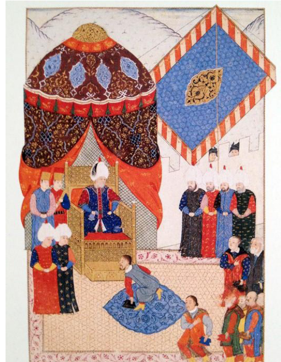
Fotoğraf:15 Kanuni ve Macar İstefan, Nüzhet-el Ahbar el-Esrar der Sefer-i