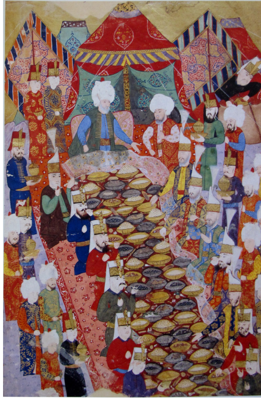
Fotoğraf:8 Lala Mustafa Paşa'nın Yeniçeri ağalarına verdiği ziyafet tasvir edilmiştir. Nusret name

Fotoğraf 7'deki minyatürde Levni, 1720'deki sünnet düğünü şenlik eğlencelerini kubbeli tribünden izleyen padişahı ve sadrzamı da kendi çadırında izlerken tasvir etmiştir . Padişahın yer aldığı adalet kulesi basit bir ahşap yapıdan meydana gelen, kırmızı renkli kubbeli bir tribündür. Adalet Kulesi, otağ-ı hümayunların saray mimarisinin bir örneği olduğunu ortaya koyan bir saray birimidir. Kaynaklara göre adalet kulesi de taht gibi basit bir yapıya sahip, örtülerle güzelleştirilen bir çadırır. Astarlı, etekli ve değerli örtülerle döşenerek padişahın kullanımına hazır hale getirilmiş bir yapıdır. Bu örtülerin hepsinin dışı çoğunlukla kırmızıdır. Diğer kullanılan renk ise yeşildir (Çalışkan 2013, s. 81-82). Kırmızı rengin kullanılması çadırın padişaha ait olduğunun bir göstergesidir. Bu minyatürde padişah sağa dönük vaziyette sol eliyle pembe kürkünün yakasını tutarken resmedilmiştir. Sırtını yasladığı yastık duman rengi ve üzerinde sarı renkli işlemler vardır. Üzerine oturduğu minder ise açık mavi renk üzerinde mavinin koyu bir tonuyla damla formunda süslemeler mevcuttur . Padişahın arkasında çadırın içini göstermeyen kırmızı bir fon vardır. Çadırının iki yana açılan eteğindeki süslemeler dikkat çekicidir. Sarı renk üzerinde şemse formundan oluşan tekrarlı bir kompozisyon hâkimdir. Minyatürdeki süslemelerden anlaşıldığı üzere gerçekte de padişahın çadırında değerli ve süslü kumaşların kullanıldığı sonucuna varılabilir.