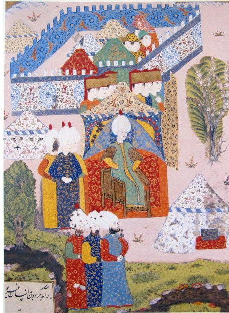
Fotoğraf:13 Kanuni Sultan Süleyman otağının önünde kurulan tahtta oturmuş, Belgrat Kuşatmasını izlemektedir. Süleyman name, 1558

Çadırın bir diğer kullanım yeri askeri seferlerdir. Fotoğraf 12 de ki bu minyatür, Sigetvarı kuşatan Osmanlı ordusunun otağlarının, harita tarzında kuşbakışı görünümünün resmedildiği bir eserdir. Etrafta çok sayıda beyaz çadır yer almaktadır. Harita illüstrasyonu tarzında resmedilmiş bir eser olduğundan kumaş süslemesi gibi ayrıntılara yer verilmemiştir.