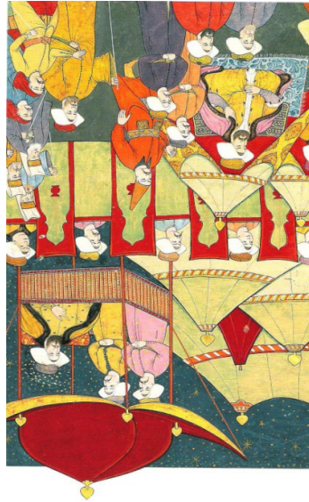
Fotoğraf:7 III. Ahmed, 1720 düğününde şenlikleri izlerken, III. Ahmed Surnamesi

Fotoğraf 6'daki minyatürde Okmeydanı'nda kurulmuş otağların kuşbakışı görünümü resmedilmiştir. Minyatür, yeşil ve beyaz renkli, gösterişli süslemelerin göze çarpmadığı otağların bir araya gelmesiyle kurulmuş olan çadır kente güzel bir örnektir. Etrafta beyaz etekli küçük seyir çadırları ve görevlilere ayrılmış çadırlar yer almaktadır. Sağdaki büyük çadır, saltanat çadırıdır. Etrafına kumaştan bir çit çekilmiş, çitin içerisinde seyir çadırları, kırmızı kubbeli bir tribün ve üç direkli büyük kabul çadırı vardır (Atıl, 1999, s. 42). Sol sayfada yer alan turuncu renkli germeli mutfak çadırının tepesinde iki direğin arasında dumanın çıkması için özel yapılmış siyah bir kısım vardır. Otağların vazgeçilmez bir parçası olan zukak bulunmaktadır. Zukak, çadır ve çadır gruplarını çevreleyen bir tür tekstil kuşatma duvarına verilen addır. Arazide veya ordugâhta, özellikle padişah ve erkâna ait çadırların istenmeyen bölgelerle bağlantısını kesen zukaklar önemli bir elemandır. Zukakların çoğunda olduğu gibi bu minyatürdeki zukağında üst kenarları kale mazgalları gibi dendanlı yapılmıştır.