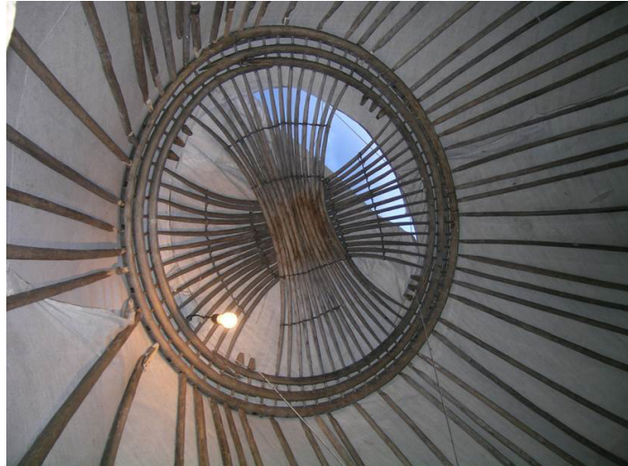
Fotoğraf:4 Yurt-alaçık-topak ev denilen çadır türüne ait bir Türkmen çadırının iç-dış-tavan görünümü örneği

( http://blog.kavrakoglu.com/tag/turk-cadiri/ )