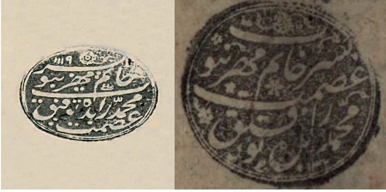
Şekil 1: Mehmed İsmet'e Ait Mührün 1119 ve 1137 Tarihli İki İstifi