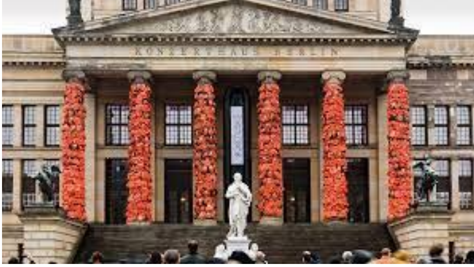
Resim 6. Ai Weiwei, Berlin Konzerthaus 2016.

yerinden edilmiş insanlar için bir sembol olarak görmekten ilham almıştır. Çeşitli yerlerdeki genç ve yaşlı 100 kişinin çamurlu ayak izini almış ve bunları tasarımında birleştirmiştir (Ponzanesi, 2022, s. 214). Sanatçı tasarımının insanlara insan haklarının anlamı konusunda kendilerini eğitmeleri, umut vermeleri ve insan haklarının önemi konusunda daha fazla tartışmayı teşvik etmeleri için görsel bir hatırlatma yapmıştır.