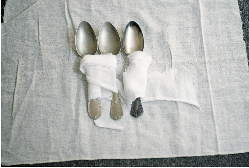
Resim 1. Gülsün Karamustafa, Vatan Doğduğun Değil Doyduğun Yerdir, 1994.

Karamustafa'nın diğer çalışmalarında da dokunaklı göç ayrıntılarını görmek mümkündür. 'Vatan Doğduğun Değil, Doyduğun Yerdir' çalışmasında sarmalanmış kaşıklar göçe tanıklık etmektedir. Sergide üç kaşık, beyaz sargı bezinin içinde sarmalanmış ve yemek masası örtüsünü andıran beyaz kumaşın üstüne yerleştirilerek göçü temsil eden bir sanat nesnesine dönüşmüştür. Çalışmada biçimsel olarak birbirinden farklı olan üç kaşığın biri tek diğer ikisi ise çift sarmalanmıştır. Kaşıkların ikiye bir şekilde sarmalanması aslında merak uyandırmaktadır. Mutfağın aracı olmaktan çıkan bu kaşıklar belki de aynı ya da farklı coğrafyalardan göç eden insanların hikâyesini bir arada tutmaktadır (Demirci, Kurt, 2022, s. 91).