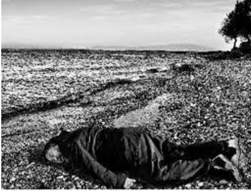
Resim 8. Ai Weiwei, Fotoğraf, Aylan Kurdi, 2016.

https://www.milliyetsanat.com/haberler/plastik-sanatlar/ai-weiwei-aylan-kurdi-ve-benzedi-mi-/6326