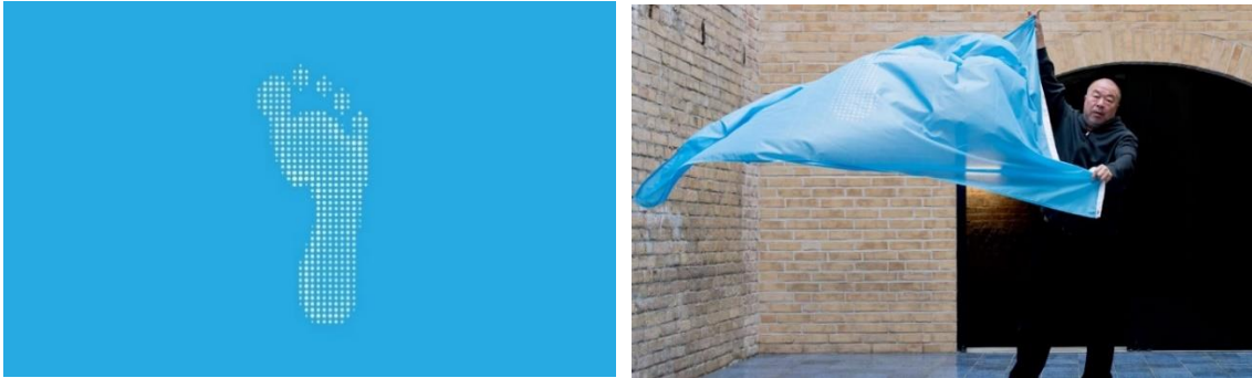
Resim 5. Ai Weiwei, İnsan Hakları Evrensel Beyanamesi İçin Bayrak, 2018.

İfade özgürlüğü ve baskıya karşı direniş üzerine yaptığı bir dizi çalışması bulunmaktadır. Bir insan olduğu kadar bir sanatçı olarak da onun bakış açısıyla temel insan hakları, özgürlük ifadesi, bir toplumdaki bireylerin 'saygın insan' olarak yaşamaları için gerekli en temel hak olmuştur. Herkesin hakları vardır, düşünce ve ifade özgürlüğü hakkı; bu hak, herhangi bir görüşe sahip olma özgürlüğünü de içermektedir. Ai Weiwei'nin sanatında 'insan' aynı anda takip edilecek bir değer ve sanatın anlamlandırılabilceği bir ortam ve durum olmuştur. Hem ifade özgürlüğünün peşinde koşmuş hem de baskı ve gözetlemeye meydan okumuştur. Sanatçı insanları adil olmayan durumlar hakkında konuşmaya teşvik etmede aktif olmuştur ve eylemleri, gerçek dünyada bir fark yaratmıştır. Başka bir deyişle, düşünür, hayal eder ve bir gerçeklik yaratmak için çaba gösterir ('Ai Weiwei: Defend the Future').