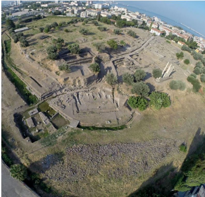
Şekil 3-. Eski Smyrna, Kuzeydoğudan görünüm.