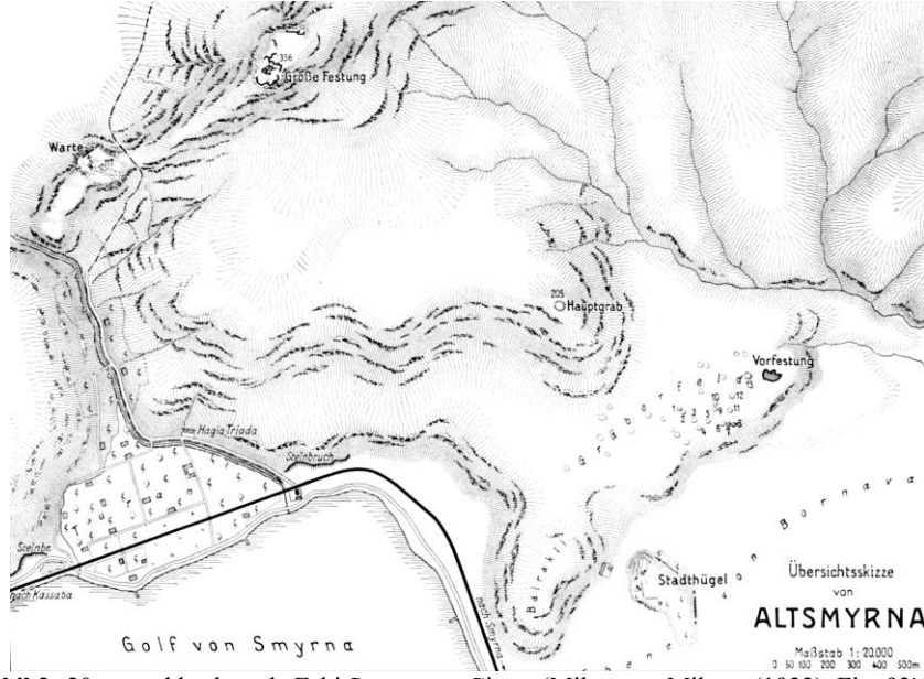
Şekil 2- 20. yüzyıl başlarında Eski Smyrna ve Civarı (Miltner ve Miltner (1932). Fig. 93'den)