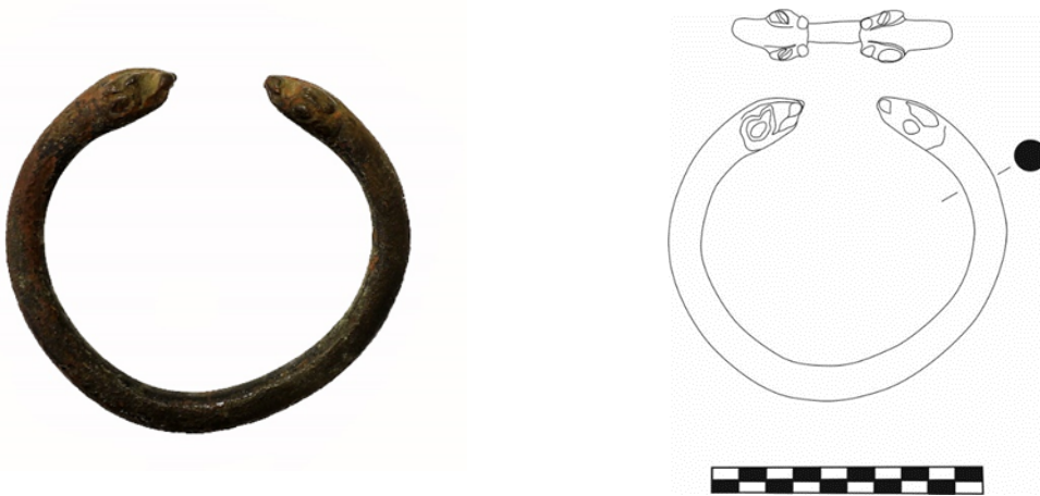
Figür 2: Bronz Bilezik, Envanter No: 7.4.78, Çap: 7 cm, Açık uçlu ve yuvarlak profillidir. Uç kısımları yılan-ejder başı şeklinde yapılmıştır. Göz, burun ve kulakları kabartı halinde yapılmıştır. Burun küt işlenmiş olup ağız ve baş üzeri kazıma çizgi ile detaylandırılmıştır.