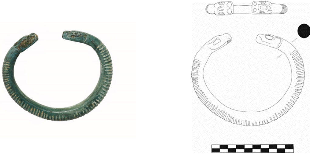
Figür 5: Bronz Bilezik, Envanter No: 7.3.78, Çap: 7 cm, Açık uçlu ve yuvarlak profillidir. Uç kısımları yılan-ejder başı şeklinde yapılmıştır. Küt burunlu ve ağızlı, burun üzeri, göz ve kulaklar derin kazıma çizgi ile belirginleştirilmiştir. Bileziğin yüzeyi derin yivlerle süslenmişken alt kısmı düz bırakılmıştır.