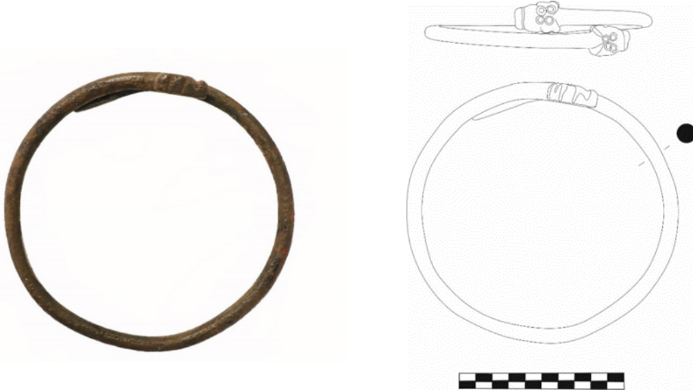
Figür 8: Bronz Pazıbent, Envanter No: 2.25.77, Çapı: 9 cm, Uçları birbiri üzerine bindirilmiş, yılan-ejder başı şeklindedir. Küt burunlu ve yassı başlı ejderin tepe kısmında dörder adet kazıma daire motifi yer almaktadır. Küt burun ucunun kalkık yapılarak belirginleştirildiği pazıbente, gözler, kulaklar ve burun uçları kabartma halinde belirginleştirilmiştir.