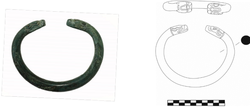
Figür 6: Bronz Bilezik, Envanter No: 7.5.78, Çap: 7 cm, Açık uçlu ve yuvarlak profillidir. Uç kısımları yılan-ejder başı şeklinde yapılmıştır. Küt burunlu, göz ve kulaklar kabartma halinde işlenmiş gerek başın yan kısımları gerekse üst kısmındaki ayrıntılar ise kazıma çizgiler ile detaylandırılmıştır.