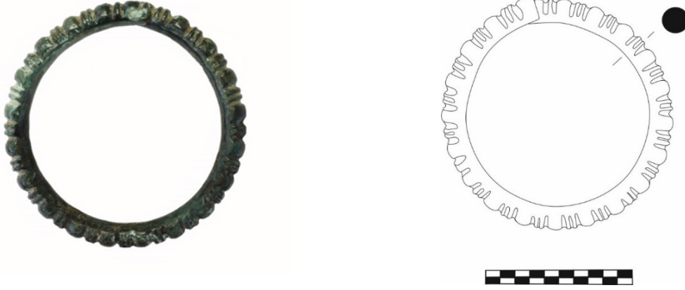
Figür 1: Bronz Bilezik, Envanter No: 7.2.78, Çap: 8 cm, Yuvarlak profilli ve uçları birbiri üzerine bindirilmiş. Dış yüzeyi, ikişer halka arasında bir boğum gelecek şekilde yerleştirilmiş kabartmalı bir bezeme ile süslenmiştir.