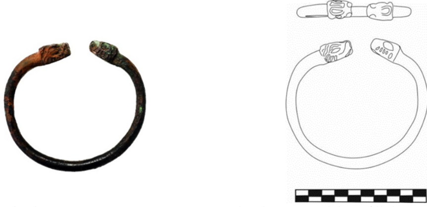
Figür 7: Bronz Bilezik, Envanter No: 2.13.77, Çapı: 6, Açık uçlu ve yuvarlak profillidir. Uç kısımları yılan-ejder başı şeklinde yapılmıştır. Burun küt biçimli, kulak birer kabartı, gözler ise çukur halindedir. Başın çene kısmından ağza doğru giden kazıma ile yapılmış derin kısa çentikler bulunmaktadır. Aynı şekilde baş üzerinde de derin kazıma ile yapılmış yarım daireyi andıran bezeme vardır.