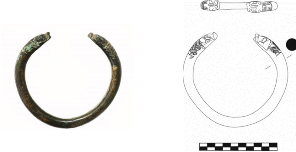
Figür 4: Bronz Bilezik, Envanter No: 7.6.78, Çap: 7 cm, Açık uçlu ve yuvarlak profilidir. Uç kısımları yılan-ejder başı şeklinde yapılmıştır. Göz, burun ve kulakların kabartı halinde verildiği bilezikte burun küt işlenmiştir. Göz ile burun arasındaki çukurlukta, baş üzerinde detaylarda ve boyun kısmındaki ince zikzakların oluşturduğu bezemde kazıma çizgiler kullanılmıştır.