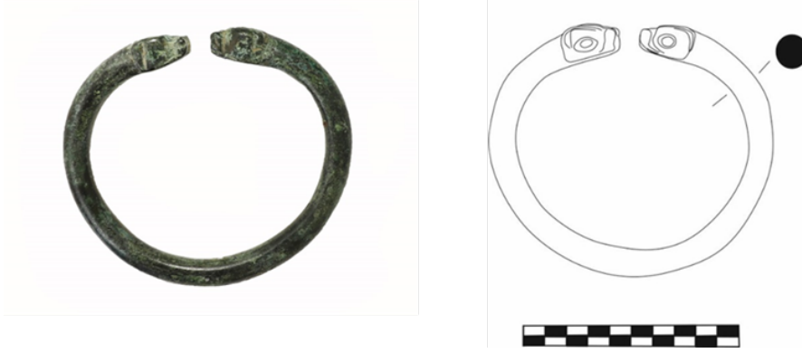
Figür 3: Bronz Bilezik, Envanter No: 2.21.77, Çap: 7 cm, Açık uçlu ve yuvarlak profilidir. Uç kısımları yılan-ejder başı şeklinde kabaca işlenmiş olup, gözler ve burun kabartma halinde verilmiştir.