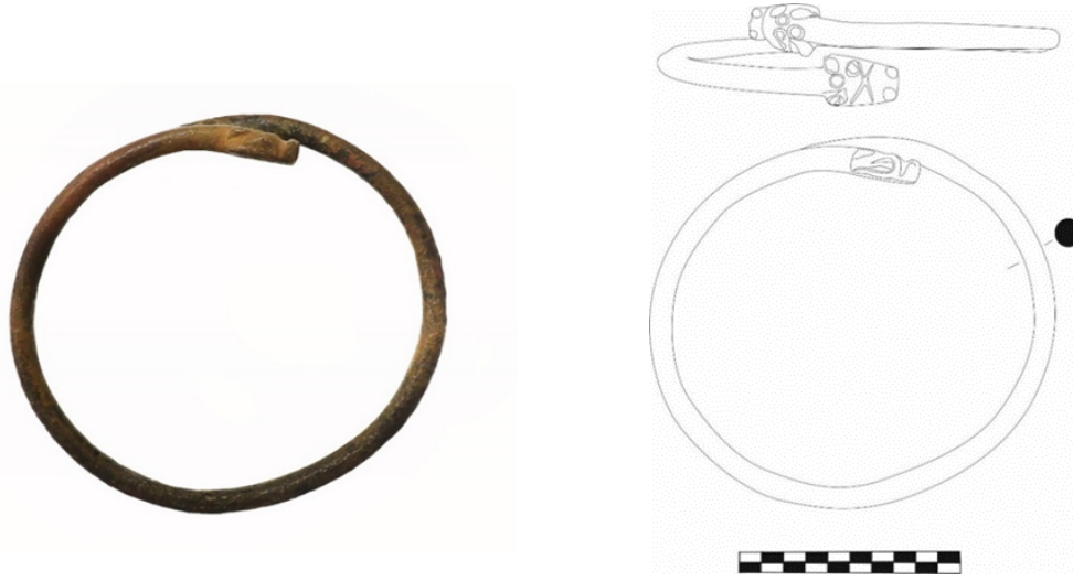
Figür 9: Bronz Pazıbent, Envanter No: 2.25.77, Çapı: 10 cm, Uçları birbiri üzerine bindirilmiş, yılan-ejder başı şeklindedir. Küt burunlu ve yassı başlı ejderin tepe kısmında dörder adet kazıma daire motifi yer almaktadır. Küt burun ucunun kalkık yapılarak belirginleştirildiği pazıbentte, gözler, kulaklar ve burun uçları kabartma halinde belirginleştirilmiştir.