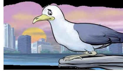
Görsel Öge: 5. A ders kitabından örnekler