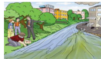
Görsel Öge: 2. B ders kitabından örnekler

C ve D ders kitaplarında da metinde yer alan görsel öğeler genel olarak metnin içeriği ile örtüşmemektedir.