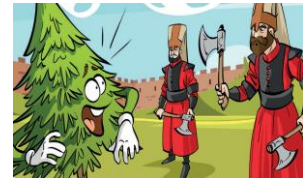
Görsel Öge: 1. A ders kitabından örnekler

B ders kitabında görsel öğeler, metnin içeriği ile tutarlı değildir. “Bu Nehir Bizim” adlı metinde çocukların parkta olduğu ve sohbet ettiği anlatılırken görsel metinden bağımsızdır. Metindeki görseller genel olarak anlatılan olaylar ile örtüşmemektedir (Görsel öge 2).