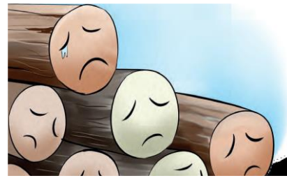
Görsel Öge: 8. B ders kitabından örnekler