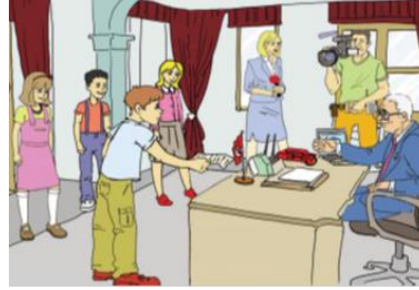
Görsel Öge: 4. B ders kitabından örnekler

C ve D ders kitaplarında da görsellerde kullanılan nesnelerin ve renklerin dengeli bir şekilde yerleştirilmediği ve orantıya da dikkat edilmediği tespit edilmiştir. Görseller, bazı metinlerde öğrenci düzeyine ve gerçeğe uygun biçimde, ancak bazı metinlerde de fazla renkli ve gerçeklikten uzak bir biçimde hazırlanmıştır. Bazı görsellerde ışık ve aydınlatma yetersiz olduğu için bu durum anlaşılabilirliği azaltmış ve görsellerin yeterince net olmamasına yol açmıştır. Kullanılan görsellerin bazılarının türü fotoğraf bazılarının ise türü resimdir. Kullanılan bu fotoğraf ve resimlerde renk unsuru abartılmıştır. Işık, gölge, doku, ton ve doğru renk kullanımı gibi unsurlar yetersiz olduğu için görseller öğrencide estetik bir duyarlılık geliştirecek nitelikte değildir.