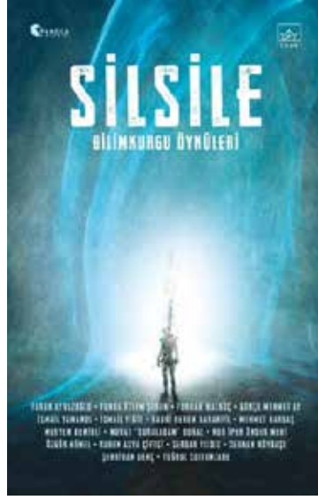
Görsel 4. "Silsile" (2021, İthaki Yayınları) Kitap Kapağı, Tasarımcılar: Ebrahel Lurci ve Hamdi Akçay.