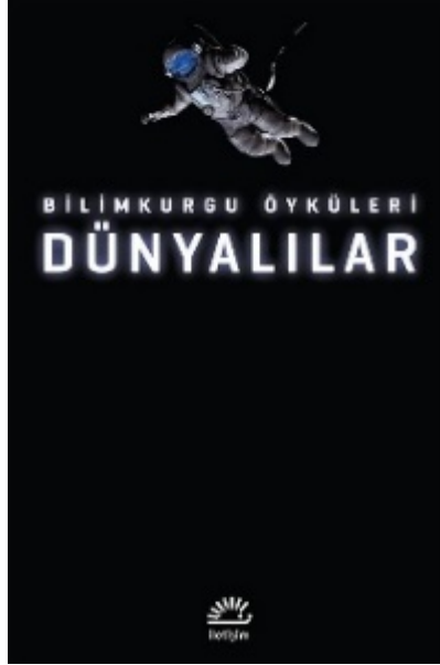
Görsel 3. “Dünyalılar” (2016, İletişim Yayınları) Kitap Kapağı, Tasarımcı: Deniz Karagül.

Analiz: Uzayda süzülen bir platform olarak, bazı tuşları yerinden çıkmış, parçalanmakta olan bir klavyenin üzerinde duran iki figür vardır. Bunlardan biri ayakta duran, bir elinde dürbün tutan, diğer eliyle ise bir istikameti gösteren bir uzaylı iken, diğeri bir insan kadındır. Kadın, platformda dizleri üzerine çökmüştür. Uzaylıya göstermek istemiyor gibi bir açıyla, bir cam şişeye kağıt not yerleştirmektedir. Uzaylının yüzünde pozitif bir ifade varken, kadının yüzünde güvensiz ve somurtkan bir ifade vardır. Parçalanmakta olan klavye ile teknolojinin geçiciliği ve günümüz normlarının zaman geçtikçe geçerliliğini yitirip eskimesi, kadın figür ile de işaret edilen geleceğe dair güvensizlik, bilinmezlik duyguları ve tehlike ihtimaline karşı geride kalanlara bir mesaj, bir iz bırakma isteği anlatılmaktadır. Geçmiş, eski olsa da tanıdık ve güvenilirken, onun yürürlükten kalkmasıyla zoraki olarak gidilecek gelecek, teknolojik açıdan daha gelişmiş olmasına rağmen bilinmez olduğu için tedirgin edici bir yanı da vardır (Görsel 2 ve Tablo 3).