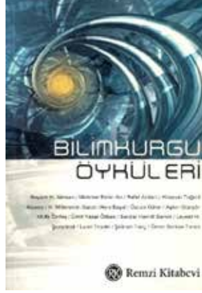
Görsel 1. “Bilimkurgu Öyküleri” (2005, Remzi Kitabevi) Kitap Kapağı, Tasarım: Ömer Erduran.