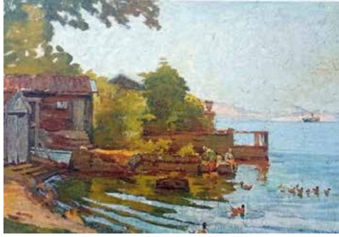
Görsel 4. Halil Paşa, “Ördekli Peyzaj”, 1904, Tuval Üzerine Yağlıboya, 34,5x 48,5 cm. (Turani, 1994: 59).

Tansuğ'a göre Halil Paşa'nın İstanbul ve Mısır peyzajı çalışmalarından oluşan yapıtları sosyo kültürel bir atmosferin yansıtıldığı örneklerdir. Bu resimlerde batı izlenimciliğinden etkiler ve esinler kuşkusuz vardır ancak bunların hiçbiri Batı izlenimcilerinin yöntem, kural ya da gelişim süreçlerine uymadıkları gibi bazıları da batı izlenimci standartların çok ötesine varabilen birer “meşk” olgusuna dönüşmüşlerdir (Tansuğ, 1994, s. 3). Turani ise Halil Paşa'nın izlenimciliğinin kendi kültürel temelleri üzerine oluştuğunu söyler. Ona göre Halil Paşa'nın resimleri ne saf bir doğa algısının izlenimi olarak tuvale aktarılmış ne de doğanın nesnel gerçekçi birer ifadesi olmuştur. Sanatçının empresyonist anlayışı nesnel bir doğa gerçekliği ile empresyonizmin ışık renk ve renk uyumları içerisinde gerçekleşmiştir. Bir yanda doğanın gerçekliğini nesnel bir şekilde ortaya koyan ifade biçimi, diğer yanda doğanın anlık ışık renk algısını vermeye çalışan bir amacın ürünüdür. Bu bağlamda Turani, Halil Paşa'nın sanatı için “aldığı eğitime paralel olarak izlenimci olmayan bir portre ile yer yer kimi izlenimci etkileri de yansıtan bir peyzaj resminin sınırları içerisinde kalmıştır” der (Turani, 1994, s. 6).