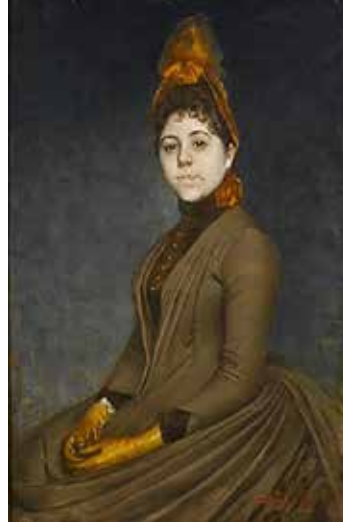
Görsel 1. Halil Paşa, Madam X'in Portresi , 1889, Karton Üzerine Pastel, 100 x 65 cm. ( http 2 ).

atanmış olan Halil Paşa, Sultan Abdülaziz tarafından 1880 yılında Paris'e gönderilmiştir. Paris'e resim eğitimi için gönderilen Halil Paşa geleneksel kurallara bağlı olan Paris Güzel Sanatlar Akademisinde görüneni resme aktarmada objektif bir tavır benimseyen Gerome ve Courtois atölyelerinde çalışır. Paris'te eğitim aldığı süre zarfında sanatçı romantik, klasik, realist tarzda yapılan eserleri incelemiştir. Bunun yanı sıra Fransız sanatçı Claude Monet'in "Güneşin Doğumu" adlı eseri ile ortaya çıkan ve 1880'lerde yaygınlaşan izlenimcilikle de karşılaşmıştır (Terzi, 1994, s. 210). İlgili eser ve dâhil olduğu empresyonizm (izlenimcilik) akımı sanatçının çalışmaları üzerinde etkili olmuştur. Ancak bu etki empresyonizmin ışık anlayışıyla sınırlı kalmıştır. Turani'ye göre "Halil Paşa'nın resimlerinde ışık önemli bir motif olarak gelişir. Fakat Fransız empresyonistlerinin renk sistemleri ve atmosfer oyunları onun eserlerinde görülmez" (Turani, 1994, s. 669).