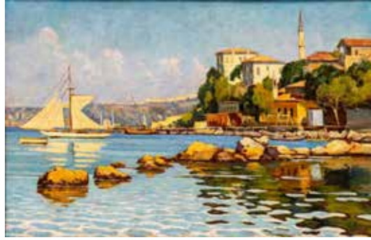
Görsel 6. Halil Paşa, "Peyzaj", 1929, Tuval Üzerine Yağlıboya, 81x 114 cm. (http 3).

Türk izlenimci resminin öncülerinden biri olarak bilinen Halil Paşa, Hoca Ali Rıza, Hüseyin Zekai Paşa gibi sanatçıların da aralarında bulunduğu 3. Asker Ressamlar Kuşağı'ndandır. İslimyeli'ne göre Halil Paşa Osmanlı'ya empresyonizmi getiren, Hüseyin Zekai Paşadan sonra ikinci empresyonist sanatçımızdır. Halil Paşa'nın aynı zamanda Hüseyin Zekai Paşa, Hoca Ali Rıza, Süleyman Seyyit beylerle birlikte Türk sanatına büyük hizmetleri olmuştur. Sami Yetik, İbrahim Çallı ve arkadaşlarının Paris dönüşü memlekette getirdikleri empresyonizm artık Türk sanatında da zirve yapmıştır. Halil Paşa kabul ettiremediği bu ekolün Türk sanatına hâkim olduğunu görme bahtiyarlığına ermiştir (İslimyeli, 1965, s. 46-47). Halil Paşa, Hoca Ali Rıza ile Çallı Kuşağı arasında bir geçiş sağlamıştır. Sanatçının 1914 kuşağı üzerinde önemli derecede etkileri vardır.