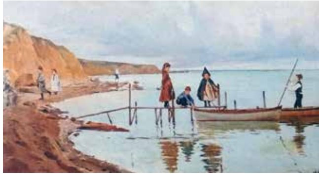
Görsel 3. Halil Paşa, "Oynayan Çocuklar", 1904, Tuval Üzerine Yağlıboya, 35x 60 cm. (Turani, 1994: 40).

adlı eserini çalıştığı, kumsalda ve arka planda yer alan yamaçlarda realist anlayışa yakın boyama tekniği kullanırken denizin dalgalı sularını serbest fırça vuruşlarıyla yansıttığı görülmektedir. Ancak bu resimdeki insan figürlerini, tekneleri ve derme çatma olan iskeleyi renklendirirken, empresyonizmin renk anlayışının ağır bastığı dikkatleri çeker. Halil Paşa'nın 1904 yılında ortaya koyduğu "Ördekli Kompozisyon" (Görsel 4) ve 1912 yılında yaptığı "Peyzaj" (Görsel 5) adlı eserleri empresyonisttir. Sanatçının bu eserlerinde empresyonist ilkelere sıkı sıkıya bağlı kaldığı anlaşılmaktadır. Resim ışık, renk, perspektif, fırça vuruşları ve doğanın anlık bir görünümü yansıtmaları bakımından izlenimci özellikler taşımaktadır. Halil Paşa'nın 1929 yılında yaptığı "Peyzaj" adlı eseri serbest fırça vuruşları, renk ilişkileri ve atmosferik perspektifi bakımından empresyonisttir. Sanatçı eserlerinde gün ışığının nesnelere üzerindeki anlık görüntüsünü de yansıtmaktadır. Halil Paşa "Peyzaj" (Görsel 6) adlı eserinde denizin hafif dalgalı sularının anlık hareketlerini tuvale aktarmıştır. Sanatçının "Peyzaj" adlı eserinde güneş ışığının doğadaki nesnelere üzerinde bıraktığı renk etkilerini izlenimci bir duyarlılıkla yansıttığı görülmektedir. Resmin arka planında yer alan ağaçlar ve binalarda renk kontrastlığına bağlı kalınmıştır. Sanatçı eserin arka planında, ufukta yer alan kente dair görünüm ve gökyüzü izlenimlerini atmosferik perspektif içerisinde empresyonist tarzda ele almıştır.