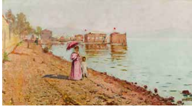
Görsel 2. Halil Paşa, “Bostancı Sahilinde Gezinti”, 1899, Tuval Üzerine Yağlıboya ( http 4 ).

insan tasvirleri, portreler, natürmortlar, savaş betimlemeleri, han kapıları ve çoğunluğunu manzara resimleri oluşturur. İslimyeli'ye göre (1965, s. 47-48) Halil Paşa'nın çalışmış olduğu bu konularda ortaya koyduğu eserler atölye içi çalışmalarından oluşması sebebiyle gerçek anlamda bir empresyonist sayılmaz. Empresyonist sanatçılar doğa üzerindeki güneş ışığının an be an değişen anlık görüntüsünü yakalamak için doğaya çıkmıştır. Halil Paşa akademik tavra olan bağlılığını sürdürerek ilk dönem çalışmalarını atölyeyi terk etmeden ortaya koymuştur. Buna rağmen sanatçının atölye içi çalışmalarından oluşan eserleri renk anlayışı ve fırça vuruşları bakımından empresyonist izler barındırmaktadır. Halil Paşa'nın açık alan çalışmaları için doğaya çıkararak yaptığı son dönem resimlerini ise empresyonist tarzda kabul edeceğimiz manzara resimleri oluşturur.