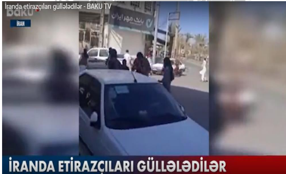
Fotoğraf 5: Bakü Televizyonu, 29.10.2022 Tarihli Haberin Görseli