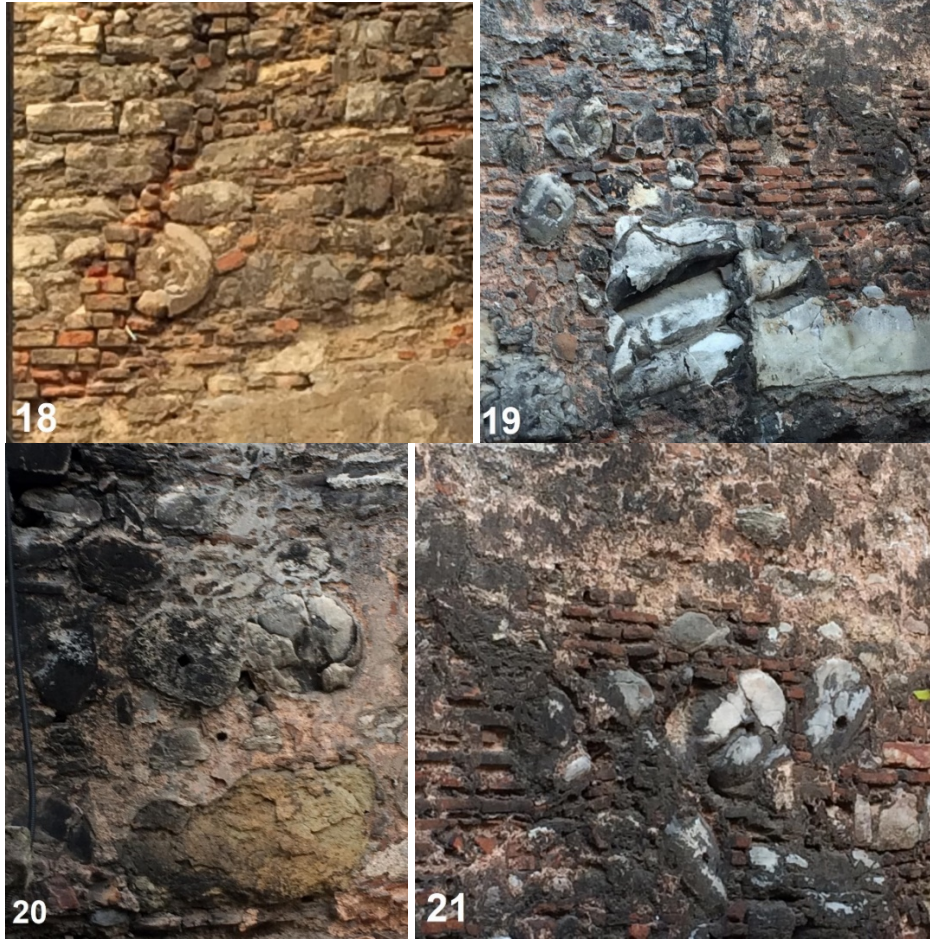
Resim 18-21. Yeraltı Camii'nin Kuzeydoğu Yan Cephesinin Kuzey Yarısının Üst Bölümlerinde, Son Kumtaşı Blok Seviyesinin Üzerinde Yer Alan Beyaz Mermerden Devşirme Sütun Tamburları Ve Blok

Kastellion'un kuzeydoğu cephesinde, yaklaşık 3,50 m kotunda gözlemlenen son kumtaşı blok örneklerinin hemen üzerinde başlayarak 10 m yüksekliğindeki en tepeye kadar devam eden duvar tekniği, yukarıda irdelenenden oldukça farklı olduğu üzere, kalenin Geç Antik Çağ inşasının ardından kapsamlı bir onarım geçirdiğini ortaya koyar. Bazı çalışmalarda yapının üst seviyeleri boyunca daha önce de tespiti yapılmış bu bölümlerde, kısmi ölçekli muhdes ekler ve geç müdahaleler hariç tutulursa, karışık tipte kaba yontu ve küçük boyutlu molozlar, derzlerde tuğla kırıklarıyla beraber düzensiz sıralar meydana getirecek şekilde kullanılmıştır. Kırmızı-kahverengi tonlarında taşların baskın olduğu duvar örgüsünde, bütün ya da kırık halde derinlemesine yerleştirilerek devşirilmiş ve yatayda kısmi sıralar oluşturan beyaz mermerden çok sayıda sütun tamburu, ayrıca kaideyi andıran bir adet irice blok dikkat çeker (Sağlam 2018: 43; 2020b: 551). Kastellion'un ikinci ve son inşa evresi olarak yorumlanabilecek bu duvarlara aslında ilk rastlayan araştırmacı olan Gottwald (1907: 30-34), sütun gövdelerinin başı çektiği mimari parçalara kısaca değinmiştir. Erkal (2011: 205) ise ayrıntıya girmeden, tutarlı bir Orta-Geç Bizans Dönemi izleniminde bulunmuştur (Resim 18-21).