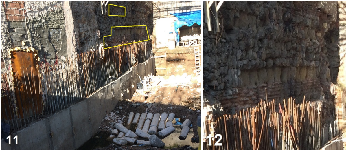
Resim 11-12. Yeraltı Camii'nin Kuzeydoğu Yan Cephesinin Güney Yarısında Ortaya Çıkan Bölümler Ve Üzerinde Tuğla Duvar Örgüsü Arasında Kesme Taş Sırası Detayı (Yönlendirici Olması Amacıyla İlk Görselde Sınırları Sarıyla İşaretlenmiştir)

Temel seviyesinin yukarısında, yaklaşık 3,50 m yüksekliğinde ve yapının ana inşa evresine ait karakteristik bir duvar örgüsü kısmen belirmiştir. Sonradan bitişen Osmanlı Dönemi liman yapılarından geriye kalan yıkıntılar görüşe bir hayli engel olsa da altta 1 sıra taş ve 6 sıra tuğla açıkça gözükmekte, bu kurgunun biraz daha üstünde kendini belli eden ikinci ve son bir taş sırası ise taş sıraları arasında toplam 10-12 sıra tuğla olduğunu göstermektedir. İlk kez belgelenen bu almalı düzendeki duvar tekniğinde, sarımsı renkli kumtaşından iyi kesilmiş irice boyutlu ve yan yana sıralanan uzunlamasına dikdörtgen tek sıra taşlar dikkat çekicidir. Kalınlığı tuğlalardan daha ince olmayan derzlerde, pembemsi bir harç kullanılmıştır. Bu duvarların, mahzenin 2,80 m iç yüksekliğindeki tonozlarının üzerine uzanan seviyesi, aralarında bir yapısal bütünlük aklı getirir (Resim 11-14).