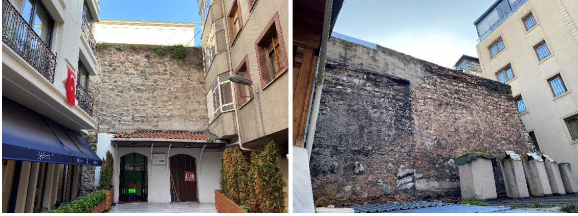
Resim 6. Yeraltı Camii'nin Karantina Sokak'tan Ulaşılan Arka (Kuzeybatı) Cephesi Orta Bölümü