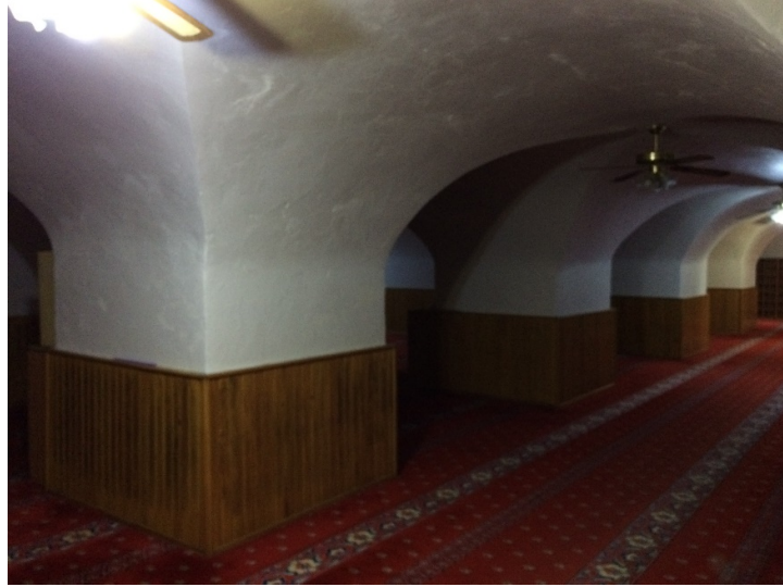
Resim 8. Yeraltı Camii'nin Mahzen Biçimindeki İbadethane Bölümünden Taşıyıcı Ve Örtü Sistemi Detayı

Yeraltı Camii'nin kuzeydoğu cephesine bitişik 94 Ada 7 Parsel üzerinde 2019'de başlayan inşaat sırasında, yapının bu cephesi temeliyle beraber bir bütün halinde ortaya çıkmıştır. Kale olarak kullanıldığı dönemin yapım evrelerine dair önemli veriler sağlayan bu yeni vaziyet, Galata'nın arkeolojik potansiyeli bağlamında kısaca paylaşılmış, lakin ayrıntılı bir mimari tarih irdelemesinde bulunulmamıştır. Söz konusu cephe, inşaat halindeki bitişik binanın 2020'de yükseltilmesi sonucu, ancak kısıtlı görüş sunan daha önceki durumuna geri dönmüştür (Sağlam 2020b: 550-552).