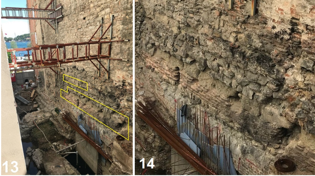
Resim 13-14. Yeraltı Camii'nin Kuzeydoğu Yan Cephesinin Güney Yarısında Ortaya Çıkan Bölümler Ve Üzerinde Tuğla Duvar Örgüsü Arasında Kesme Taş Sırası Detayı (Yönlendirici Olması Amacıyla İlk Görselde Sınırları Sarıyla İşaretlenmiştir)

Kastellion'un yeni tespit edilen inşa tekniği, özellikle de 6. yüzyıl yapılarıyla doğrudan eşleşir. Örneklere ilk olarak, 6. yüzyıl civarına tarihlenen Antik Otel Sarnıcı gösterilebilir. Bazı bölümlerinde taş sıraları, kalınlığı 5 cm, derz genişliği ise 6-10 cm olan 17-20 sıra tuğlayı böler (Altuğ 2013: 318-319). Bir diğeri, 536'da yapılan Hagioi Sergios ve Bakkhos (Küçük Ayasofya) olup, apsis cephesindeki blokların arasında 11-16 sıra tuğla mevcuttur (Müller-Wiener 2001: 177). Aynı tekniğe, I. Ioustinianos'un (hük. 527-565) 537'de inşa ettirdiği Hagia Sophia'da (Ayasofya), vaftizhane yapısı başta olmak üzere rastlanır (Müller-Wiener 2001: 85-86, 90-91). 552'de yaptırdığı Hagia Irene'den kalan, San Domenico/Arap Camii avlu girişi güneydoğu cephesinde de taşların arasında 14 sıra tuğla şeklinde görülür ve yine I. Ioustinianos'a atfedilir (Palazzo 2014: 83). Özetle, akademik yazında "tuğla duvar örgüsü arasında tek sıra kesme taş" biçiminde tarif edilen ve İstanbul'da yaygın olarak belgelenmiş ilgili almaşık duvar tekniği, 6. yüzyıla özgü olarak değerlendirilir (Tunay 1984: 352). Buradan hareketle, Patria 'nın da ifade ettiği üzere, kalenin esasen II. Tiberios Konstantinos (hük. 574-582) inşası olması ihtimali öne çıkar (Resim 15-17).