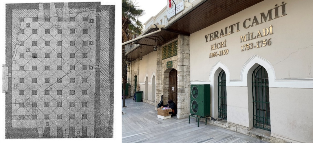
Resim 2. Yeraltı Camii'nin Kat Planı