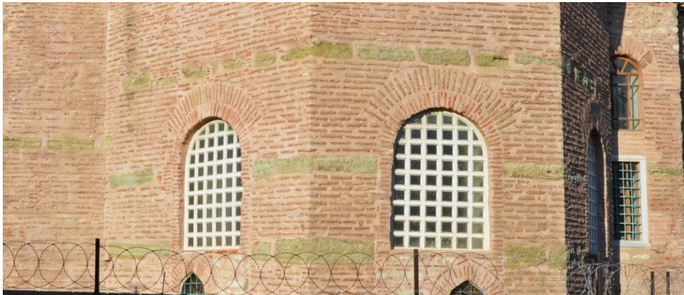
Resim 15. Küçük Ayasofya Apsis Bölümü Üzerinde Tuğla Duvar Örgüsü Arasında Tek Sıra Kesme Taş Sıraları Detayı

Kastellion'un yeni tespit edilen inşa tekniği, özellikle de 6. yüzyıl yapılarıyla doğrudan eşleşir. Örneklere ilk olarak, 6. yüzyıl civarına tarihlenen Antik Otel Sarnıcı gösterilebilir. Bazı bölümlerinde taş sıraları, kalınlığı 5 cm, derz genişliği ise 6-10 cm olan 17-20 sıra tuğlayı böler (Altuğ 2013: 318-319). Bir diğeri, 536'da yapılan Hagioi Sergios ve Bakkhos (Küçük Ayasofya) olup, apsis cephesindeki blokların arasında 11-16 sıra tuğla mevcuttur (Müller-Wiener 2001: 177). Aynı tekniğe, I. Ioustinianos'un (hük. 527-565) 537'de inşa ettirdiği Hagia Sophia'da (Ayasofya), vaftizhane yapısı başta olmak üzere rastlanır (Müller-Wiener 2001: 85-86, 90-91). 552'de yaptırdığı Hagia Irene'den kalan, San Domenico/Arap Camii avlu girişi güneydoğu cephesinde de taşların arasında 14 sıra tuğla şeklinde görülür ve yine I. Ioustinianos'a atfedilir (Palazzo 2014: 83). Özetle, akademik yazında "tuğla duvar örgüsü arasında tek sıra kesme taş" biçiminde tarif edilen ve İstanbul'da yaygın olarak belgelenmiş ilgili almaşık duvar tekniği, 6. yüzyıla özgü olarak değerlendirilir (Tunay 1984: 352). Buradan hareketle, Patria 'nın da ifade ettiği üzere, kalenin esasen II. Tiberios Konstantinos (hük. 574-582) inşası olması ihtimali öne çıkar (Resim 15-17).