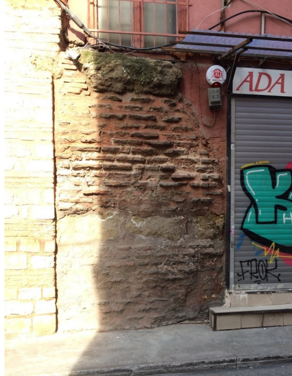
Resim 17. Arap Camii’nde Tuğla Duvar Örgüsü Arasında Tek Sıra Kesme Taş Sıraları Detayı

Kastellion’a yönelik saha verisine dayanmayan tarihsel yorumlar sonucu varsayımsal şekilde öne sürülmüş III. Tiberios Apsimaros (hük. 698-705) tarihlemesine dönülürse, bu dönemin inşalarında, yukarıda irdelenen 6. yüzyıl duvar işçiliğine rastlanmaz. Örneğin, Konstantinopolis Kara Surları’nda belgelenmiş Bizans Karanlık Dönemi bölümleri olan, Herakleios (hük. 610-641) inşası “Mumhane Suru” üzerinde, ayrıca bazı kulelerdeki II. Ioustinianos (hük. 685-695, 705-711) onarımlarında ve 740 depremi sonrası III. Leon (hük. 717-741) ile V. Konstantinos (hük. 741-775) onarımlarında, Bizans’ın hemen her döneminde mevcut orta-ufak boyutlarda düzgünce yontulmuş beyaz tonlarında kireçtaşı ile tuğla malzemeden düzenli sıralar oluşturan