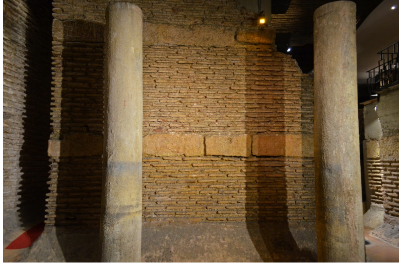
Resim 16. Antik Otel Sarnıcı Üzerinde Tuğla Duvar Örgüsü Arasında Tek Sıra Kesme Taş Sıraları Detayı