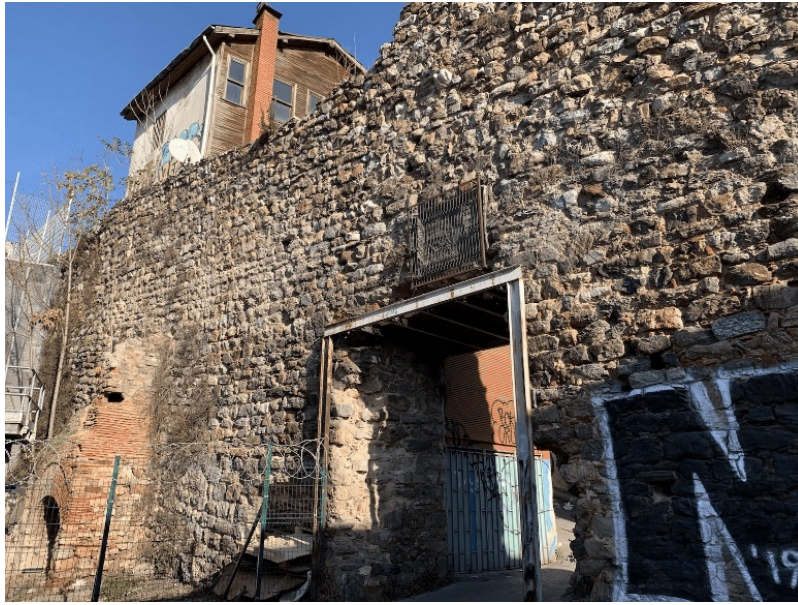
Resim 22. Galata Surları’nın 1386-1387’ye Tarihlenen Harip Kapı Bölümü