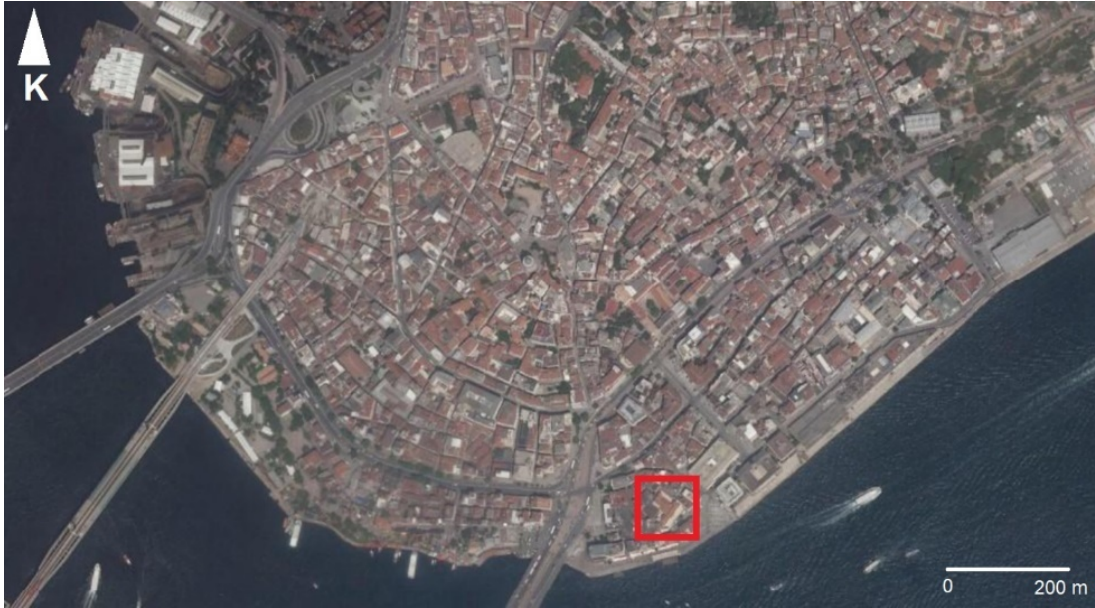
Resim 1. Kastellion/Yeraltı Camii'nin Günümüzde Karaköy'deki Konumu

Tarihi Galata bölgesinin güneydoğu kıyısında, günümüzde Karaköy semtiyle kesişen Kemankeş Karamustafapaşa Mahallesi'ndeki 94 Ada 9 Parsel üzerinde, sahile yaklaşık 50 m mesafede yer alan Kastellion (günümüzde Yeraltı Camii), İstanbul'un aslen Bizans Dönemi anıtlarından nispeten küçük bir savunma yapısıdır (Resim 1). Yaklaşık boyutları 40 m genişlik, 50 m uzunluk ve maksimum 10 m yüksekliktir. Güneydoğuda Kemankeş Caddesi, kuzeybatıda Karantina Sokak üzerinden ulaşılan dikdörtgen planlı yapının bu cephelerinde basamaklarla inilen girişler, ayrıca iç mekâna bakan kemerli açıklıklar vardır. Uzun yaşamı boyunca çokça değişikliğe uğramış bu anıtın korunabilmiş esas bölümü, tonozlu birimlerden oluşan, yarım bodrum görünümlü basık mahzendir (Resim 2-3). Bunun üzerinde yükselen duvarlar ise ortada platform biçiminde bir avlu meydana getirir. Etrafını, modern yıkımlar nedeniyle bugün ancak yarı yarıya, kuzeybatı ve kuzeydoğu cepheler boyunca çevreleyen duvarların kesiştiği kuzey köşe, payanda biçiminde aşağı doğru hafif eğimlidir.