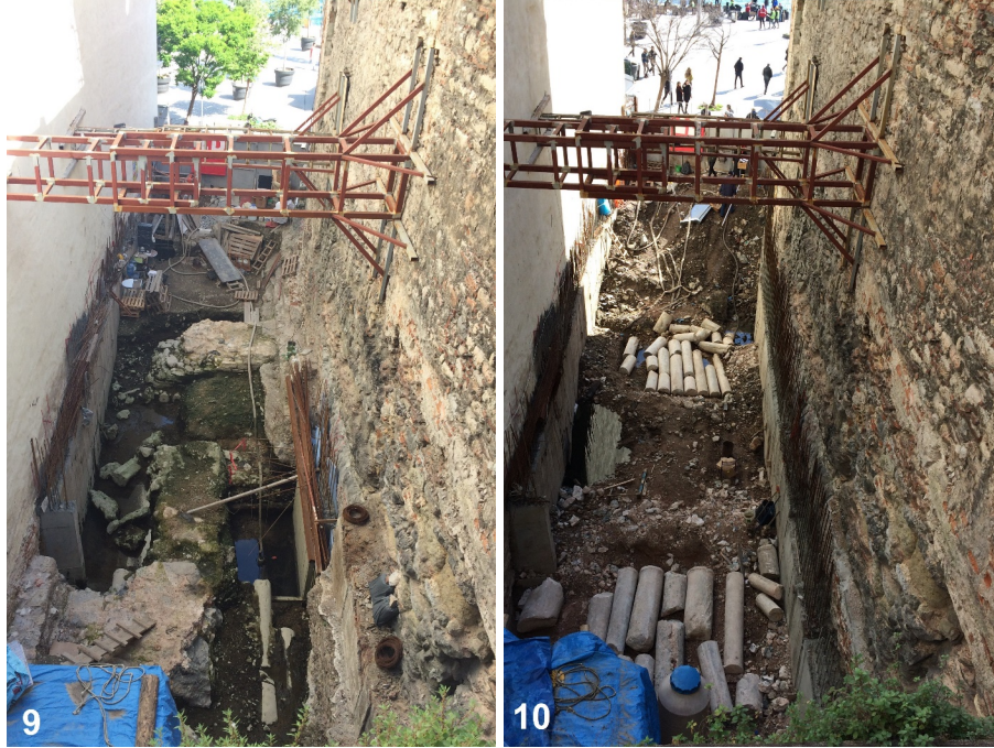
Resim 9-10. Yeraltı Camii'nin Kuzeydoğu Yan Cephesinin Güney Yarısına Bitişik İnşaat Ortaya Çıkan Temel Kalıntıları Ve Devşirme Sütun Gövdeleri

Temel seviyesinin yukarısında, yaklaşık 3,50 m yüksekliğinde ve yapının ana inşa evresine ait karakteristik bir duvar örgüsü kısmen belirmiştir. Sonradan bitişen Osmanlı Dönemi liman yapılarından geriye kalan yıkıntılar görüşe bir hayli engel olsa da altta 1 sıra taş ve 6 sıra tuğla açıkça gözükmekte, bu kurgunun biraz daha üstünde kendini belli eden ikinci ve son bir taş sırası ise taş sıraları arasında toplam 10-12 sıra tuğla olduğunu göstermektedir. İlk kez belgelenen bu almalı düzendeki duvar tekniğinde, sarımsı renkli kumtaşından iyi kesilmiş irice boyutlu ve yan yana sıralanan uzunlamasına dikdörtgen tek sıra taşlar dikkat çekicidir. Kalınlığı tuğlalardan daha ince olmayan derzlerde, pembemsi bir harç kullanılmıştır. Bu duvarların, mahzenin 2,80 m iç yüksekliğindeki tonozlarının üzerine uzanan seviyesi, aralarında bir yapısal bütünlük aklı getirir (Resim 11-14).