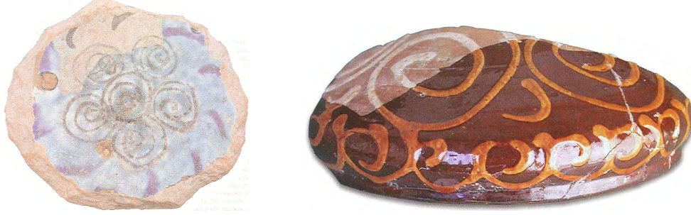
Görsel 11. (Solda) Çeken, Muharrem. (2007). Hasankeyf Kazısı Seramik Fırınları Atölyeleri ve Seramikleri. Anadolu'da Türk Devri Çini ve Seramik Sanatı. Ankara: T.C. Kültür ve Turizm Bakanlığı Yayınları. s. 252.

Spiral/sarmal motifi, Hasankeyf kazılarında ele geçen buluntulardaki sıralı dekorlu seramikler üzerinde görülen geometrik motiflerden biridir. Bunların dışında yıldız, zikzak, üçgen, diyagonal çizgiler, çarkifelek, zincir, nokta vb. biçimlerde geometrik motifler bulunmaktadır (Çeken, 2007, s. 257).