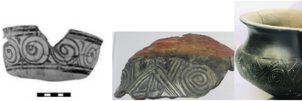
Görsel 7. (Solda) Böhlendorf Arslan, B. (2008), Keramikproduktion im Byzantinischen und Türkischen Milet, ISTMITT 58, s. 405.

Milet İşi seramiklerde de sıklıkla kullanılan spiral motifi, bir nokta etrafında dönerek uzaklaşan eğrilerdir. Milet İşi seramiklerde helezon ve spirallerin doğadan esinlenerek yapıldığı düşünülmekte, seramiklerin kenar, dip ve gövdelerinde dekor olarak kullanıldığı görülmektedir. Kenar kısımlarda tek sıra halinde dar bir şekilde uygulanmış, bir noktadan başlayarak giderek uzaklaşarak düzenli halkalar şeklinde devam eden eğri hat olarak tanımlanmaktadır. Seramiklerin gövde kısımlarında ise spiral motifi bitkisel ve geometrik motiflerle bir arada kullanılmıştır (Demirci, 2006, s. 76-83).