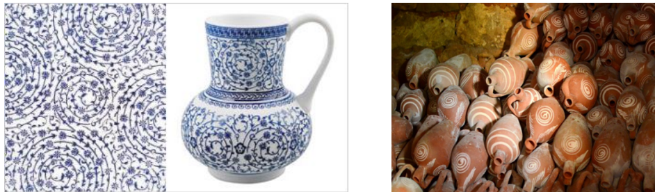
Görsel 12. (Solda)Haliç işi. 2024. İdesanat. Erişim Tarihi: 05.02.2024, URL5 – (Sağda) Doğanhisar'ın Geleneksel El Sanatları. (t.y.). Doğanhisar. Erişim Tarihi: 12.07.2024. URL6