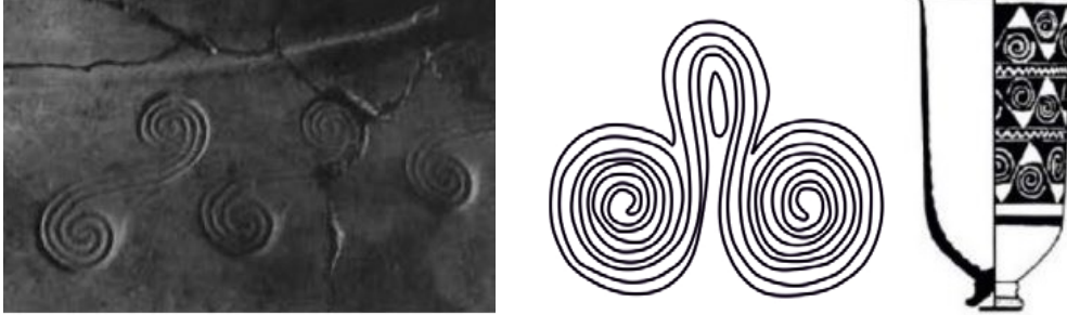
Görsel 6. (Solda) Pamuk, Serkan. (2021). Yeni Kronoloji ve Yeni Bulgular Işığında Phryg Seramiği ve Yayılım Alanı, Gordion “S” Sarmalları. Antalya: Akdeniz Üniversitesi. s. 403.

senli seramiklerinde klasik spiral formuna göre “S” spiralleri daha yoğun olarak görülmektedir. Anadolu’da (Görsel 6) görülen “S” sarmalı deseninin klasik Frig sarmalı olduğu belirtilmiştir (Yakar, 2016, s. 173-175; Pamuk, 2021, s. 102; Kızıl, 2021, s. 79).