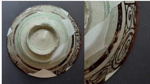
Görsel 10. Ak, Hülya. (2023). Adıyaman Müzesi'ndeki 12. ve 13. yy. Samsat Seramiklerinin Motif Restitüsyonu ve Örnek Uygulamalar. Lüster Dekorlu Kap- Arka Yüz. İzmir: Dokuz Eylül Üniversitesi, Güzel Sanatlar Enstitüsü. s. 41.

Adıyaman Müzesi'nde bulunan Samsat kazılarında ele geçen buluntular arasında envanterlik bir kâsenin, arka kısmında ağız kenarında bulunan geniş bordür içerisine yassı spiral şekiller işlenmiştir. Bu lüster dekor tekniği kâsenin, dış kısmına yapılan spiral motifinin benzer örnekleri Suriye lüster dekorlu kaplarda da görülmektedir (Ak, 2023, s. 419).