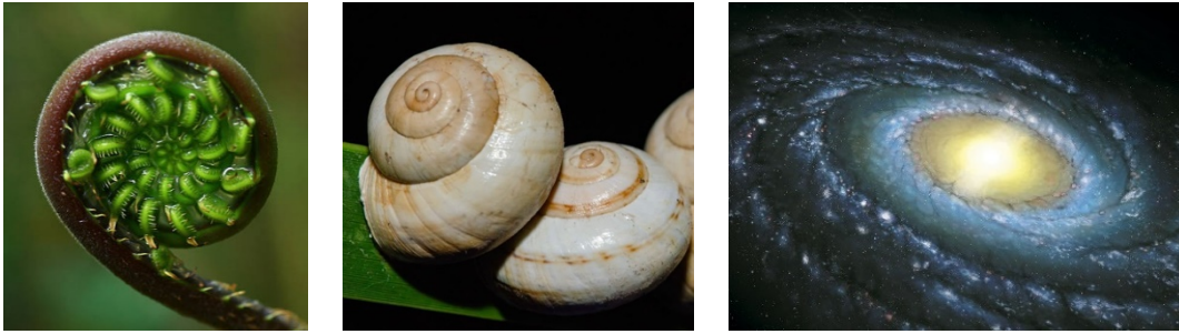
Görsel 1. (Solda) Spiral Fern. 2013. İstock. Erişim Tarihi: 05.01.2024. URL1 (Ortada) Salyangoz Kabuğu. (t.y.). İstock. Erişim Tarihi: 05.01.2024. URL2 (Sağda) Samanyolu 'komşu galaksi Andromeda'ya doğru genişliyor. 2018. BBC NEWS. Erişim Tarihi: 20.01.2024. URL3