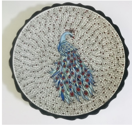
Görsel 15. Sıraltı Teknikli Tabak, 930°C, 43 cm, 2023.

Bu çalışma kapsamında ele alınan spiral motifi ve sembolizminden esinlenerek yapılan çini tabak dekorunun, merkezinden başlayarak dışına kadar çizgisel bir zemin tasarlanarak oluşturulmuştur. Bu çizgisel zemin üzerine “Haliç İşi” bitkisel motifle desteklenerek çizilmiş, sıraltı siyah tahrir kullanılarak fırça ile yapılmıştır. Tabağın merkezine de sonsuz hayat ve güzelliği simgeleyen tavus kuşu motifi çizilmiş, dış konturları siyah tahrir, iç kısımları da sıraltı boyalar kullanılarak fırça ile uygulanmıştır. Bu uygulama, sıraltı dekor tekniği kullanılarak yapılmış, üzerine şeffaf sır uygulanarak 930°C de sırlı pişirimi gerçekleştirilmiştir. Spiral motifinin derin anlamları, yaşamdaki döngüsellığı, sonsuzluk ve yenilenme gibi soyut kavramlarla olan ilişkisi ve bunun sonucunda yapılan bu tasarım, spiral şeklinin hem estetik hem de sembolik yönlerinin seramik sanatında nasıl somut bir formda hayat bulabileceğini göstermektedir. Nihayetinde, spiral motifinin sadece dekoratif bir unsur olarak değil, aynı zamanda derin bir anlam taşıyan bir sembol olarak seramik sanatı içerisinde kullanımı farklı bir bakış açısıyla gerçekleştirilmiştir. Bu biçimlenme, sanatın sembolizmle birleşerek, anlam ve estetiğin birlikte harmanlandığı modern bir yaklaşımla oluşturulmuştur.