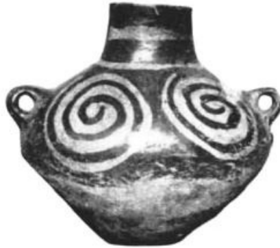
Görsel 5. Mellaart, James. (1961). Hacılar: A Neolithic Village Site, Scientific American 205(2). s. 95.

Anadolu tarihine bakıldığında, seramikler üzerindeki en eski dekor örneklerinin astar, çizim, kazıma ve kabartma teknikleriyle yapıldığı, sonraki dönemlerde ise boyama ve sır tekniklerinin de kullanıldığı görülmektedir. Aynı sembolden yapılmış dekorlar dahi, Çatalhöyük ve Hacılar'daki seramik buluntularında veya Yunan ve Çin vazolarındaki spiral motifli dekorlarda olduğu gibi, farklı kompozisyonlarda ve anlamlarda uygulanmış olabilir. Anadolu'da geometrik motiflerin yoğun olarak kullanıldığı Frig kültüründe de karmaşık bezemeler arasında spiral/sarmal motiflere yer verilmiştir. Bu durum, dekorların evrensel bir form kazansa da her coğrafya ve kültüre göre anlamlarının farklılık gösterebileceğini ortaya koymaktadır.