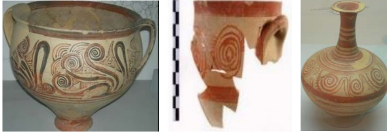
Görsel 8. Konakçı, Erim. (2016). Geç Tunç Çağ'ında Ayasuluk Tepesi, Spiral Motifli Miken Kapları, Pamukkale Üniversitesi Sosyal Bilimler Enstitüsü. s. 143.

Bir başka spiral/sarmal dekorunu Mühr-ü Süleyman motifinin dekorlandığı seramik üründe, yıldızın her bir köşebentlerin spiral/sarmal motiflerle dolgu yapıldığı görülmektedir (Görsel 9 solda) (Baş, Dursun, 2019, s. 65). Görsel 9'da (sağda) Kubad Abad Sarayı seramiklerine ait yıldızda, figürün etrafına yapılan bitkisel bezemenin zemin hareketini oluşturan spiraller olduğu görülmektedir.