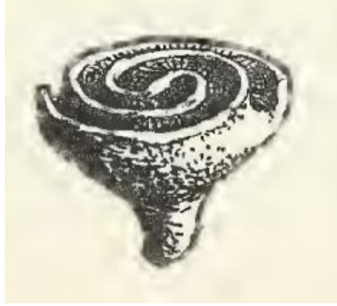
Görsel 4. Mellaart, James. (1967). Çatal Hüyük: A Neolithic Town in Anatolia, Kil Mühür (Damga), Neolitik Dönem. New York: McGraw-Hill Book Company. s. 220.

tasarımını taşıyan mühür (Görsel 4), kumaş üzerine desen basmak için veya insan derisini boyamak içinde kullanılmış olabilmektedir (Mellaart, 1967, s. 219; Morrison, 2005, s. 308).