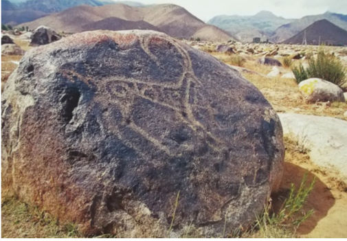
Resim- 15. Kırgızistan Çolpan- Ata.