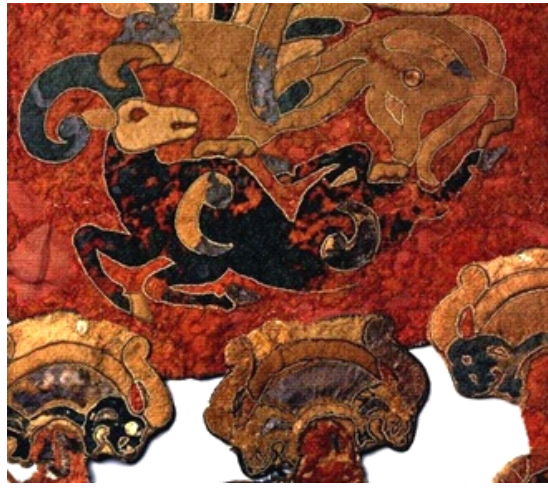
Resim-4: Pazyryk Kurganından Çıkarılmış Keçe Kılıf