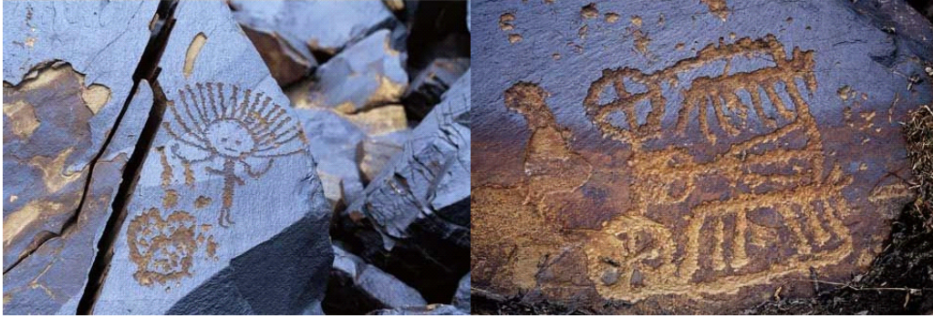
Resim-1: Saymalı Taş'ın Sembol Resimlerinden 'Güneş Adam' Resimleri