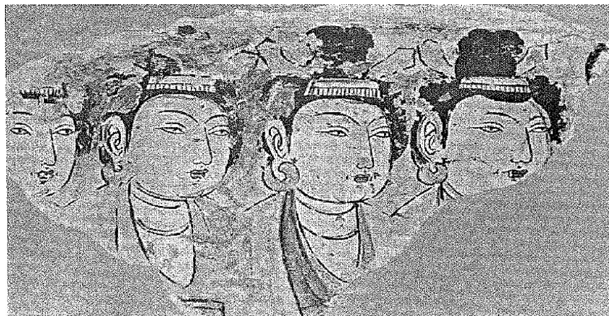
8. ve 9. Yüzyıldan Kalma Duvar Resimleri