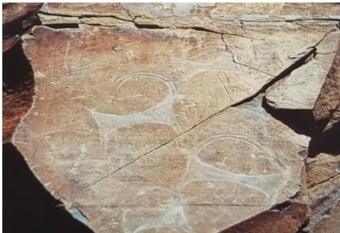
Resim- 17. Türkiye Kars Kağızman Kurban Ağa.