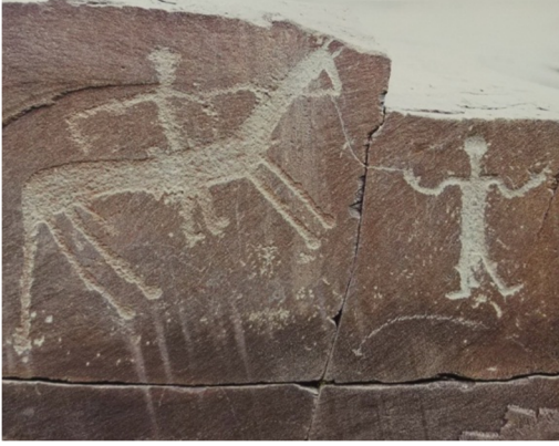
Resim- 13. Kırgızistan Talas Çiğimtaş.