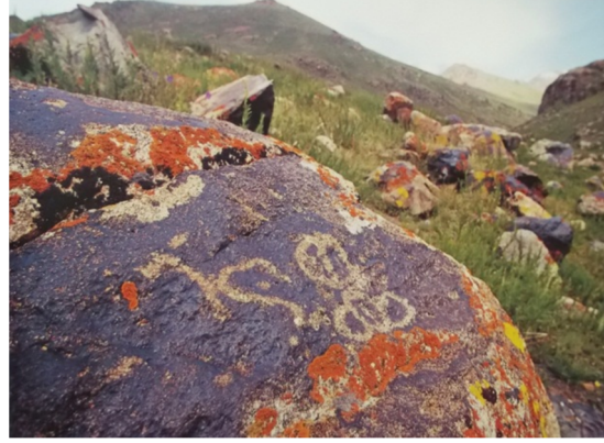
Resim-14. Kırgızistan Talas Karakol Yaylası.