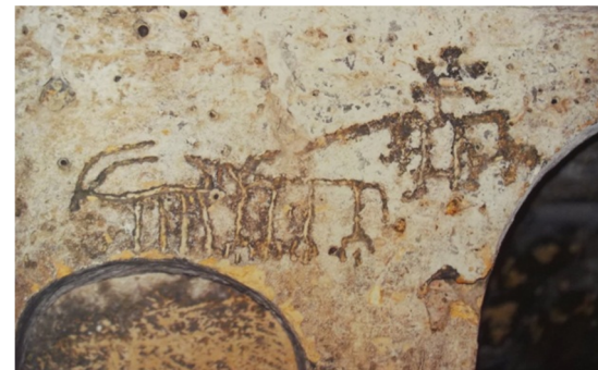
Resim- 18. Türkiye Urfa Şuayp Şehri.