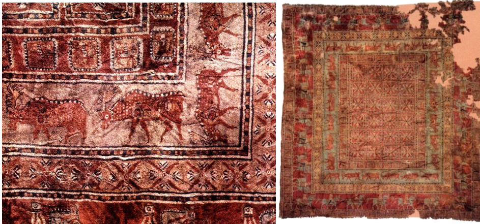
Resim-5: Pazyryk Halısı Örnekleri