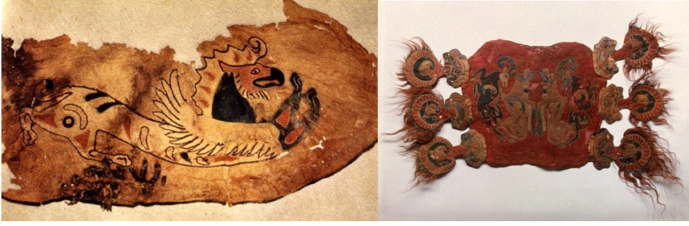
Resim-3: Pazyryk Kurganlarından Çıkarılmış At Başına Takmak İçin Süs ve At- Geyik Maskesi