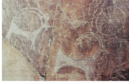
Resim- 16. Türkiye Kars Kağızman Kurban Ağa.