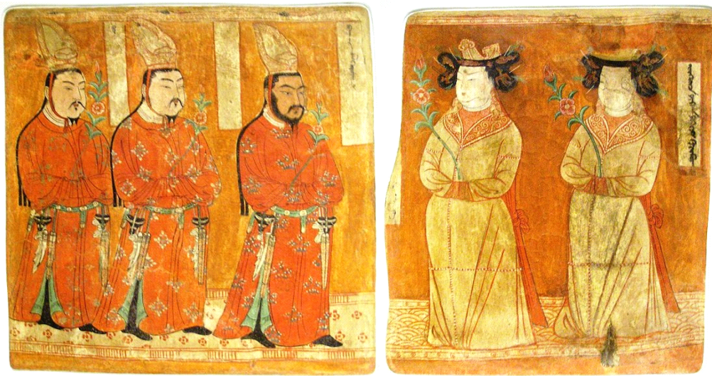
Resim-7: Uyghur Kağan Ardılları (a) ve Vakıf Sahipleri (b)