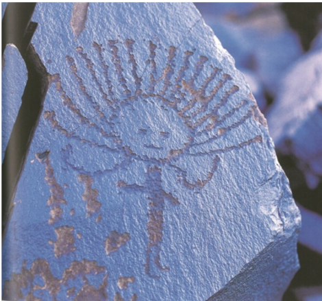
Resim- 11.Kırgızistan Saymaltaş insan- inanç ilişkisi.