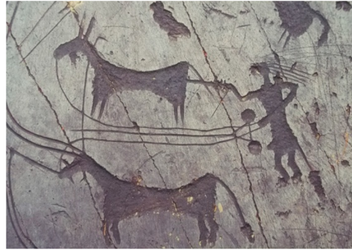
*Resim- 9.Kırgızistan Saymaltaş tabiat taklidi.