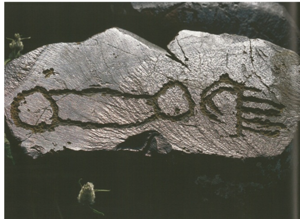
Resim-12. Kırgızistan Saymaltaş Soyut resimler ve damgalar.