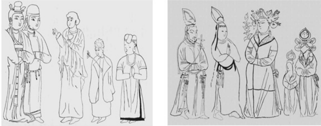
Resim 6: Lotus Çiçeği ve Uyghur Rahipleri