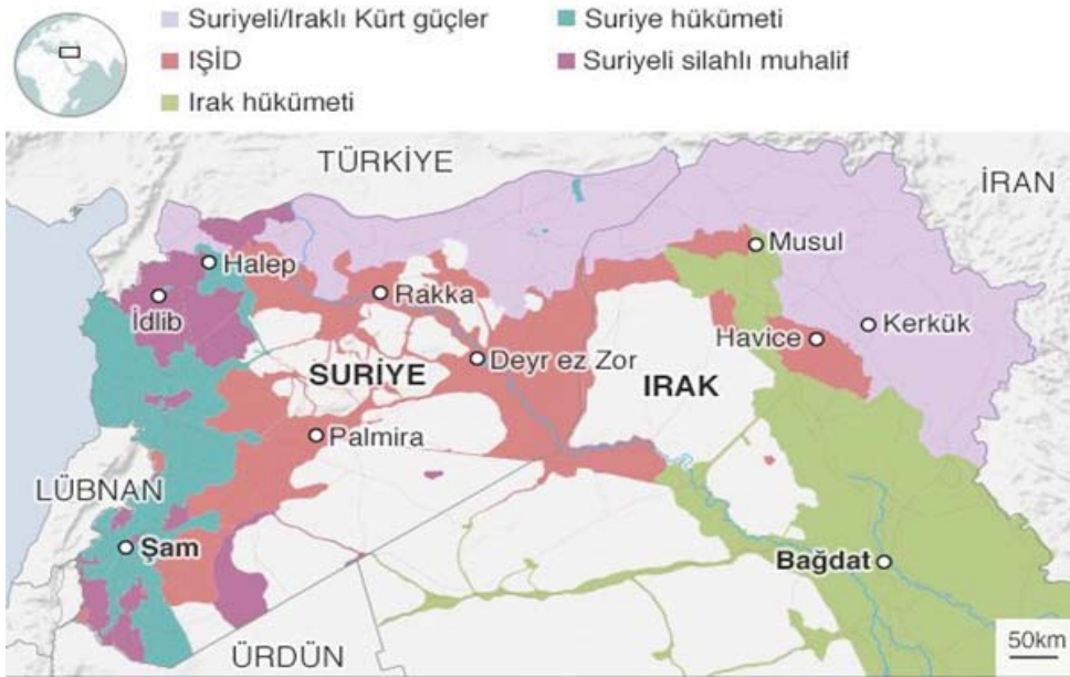
Şekil 2: Irak ve Suriye Haritası, Ocak 2017

51