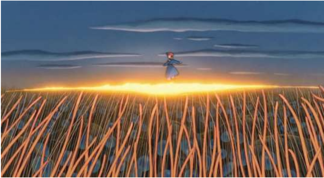
Şekil 7. Prenses Nauska’nın doğa ile kurduğu uyum ve yüzyıllardır anlatılan efsanenin gerçeğe dönüşmesi (Researchgate.net, 2024).

Çocukluğundan beri om yavrularını korumaya, onlarla iletişim kurmaya çabalayan Prenses, Pejaytlıların yakaladığı om’u sürüye geri götürür. Om’un öfkesini dindirmeye çalışırken kendisini feda eder. Om’ların ayakları altında kalan Prenses Nauska, yavru om’un onu kurtarmaya çalışmasıyla sürü tarafından gökyüzüne kaldırılır. Bütün om’lar birleşir, sarı bir ışık yayılır, ortalık sapsarı bir tarlaya döner. Mavi elbisesiyle Prenses Nauska, gökyüzünde parlar, çocuk sesleri duyulur. Kasaba halkının yüzyıllardır beklediği, aradığı kurtarıcı; Nauska’dır (Şekil 7). Rüzgârlı Vadi’de yüzyıllardır anlatılan efsane, sonunda gerçeğe dönüşür.