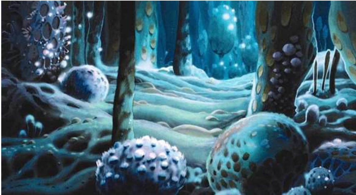
Şekil 3. Rüzgârlı Vadi filminde Zehirli Orman (Ghibli.fandom, 2024).

Miyazaki'nin filminde yemyeşil, pembe tohumlarla dolu, tılsımlı bir ormanın üzerine örümcek ağları atılmış gibidir. Filmde büyülü bir dünya ile distopik bir dünya yan yana gelir. Rengârenk ağaçların, bitkilerin, suların etrafını zehir, asit ve sarmaşıklar sarar. Miyazaki'nin çizdiği bu ikili dünya, insanoğlunun yeryüzünün güzelliğini kendi eliyle nasıl bozduğunu dile getirir.