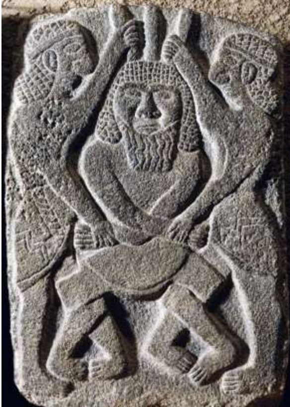
Şekil 1. Gılgamış'ın, katran ormanının bekçisi Humbaba ile savaşı.

Gılgamış, katran ağaçlarını devirdikten sonra yine gücünü ispatlamak arzusuyla Gökyüzü Boğası'nı öldürür (Şekil 2). MÖ. 2000 yılından beri, insan benzer bir hikâyeyi yeniden yazıyor: Tarımsal üretimi arttırmak amacıyla kimyasal ilaçların kullanılması, site yapmak için orman alanlarının yok edilmesi, maden çıkarma arzusuyla doğanın tahribi, nükleer santral kurma hedefiyle radyasyona maruz kalan bir dünyanın inşa edilmesi... Belli bir sınıfın, iktidarın; gücünü garanti altına almak ve pekiştirmek arzusuyla ormanı, suyu, toprağı ve yeryüzündeki tüm canlıları harcanabilir görmesinin hikâyesi bu.