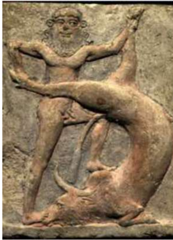
Şekil 2. Gılgamış'ın, Gökyüzü Boğası'nı öldürmesi (Wikipedia.org, 2024).

Ekoeleştiri kuramı bu hikâyeye karşı bir anlatı geliştirmek amacıyla ortaya çıkar ve merkezinde insanın olduğu sisteme, yapıya sorular sorar. Doğaya zarar vermeden nasıl üretim yapılabilir? İnsan ve doğa ilişkisinin sınırı ne? Doğaya ne yaptık, ne oluyor? Merkezinde insanın olmadığı bir sistem yaratmak mümkün mü? İklim krizi ve çevre felaketleri neden var?