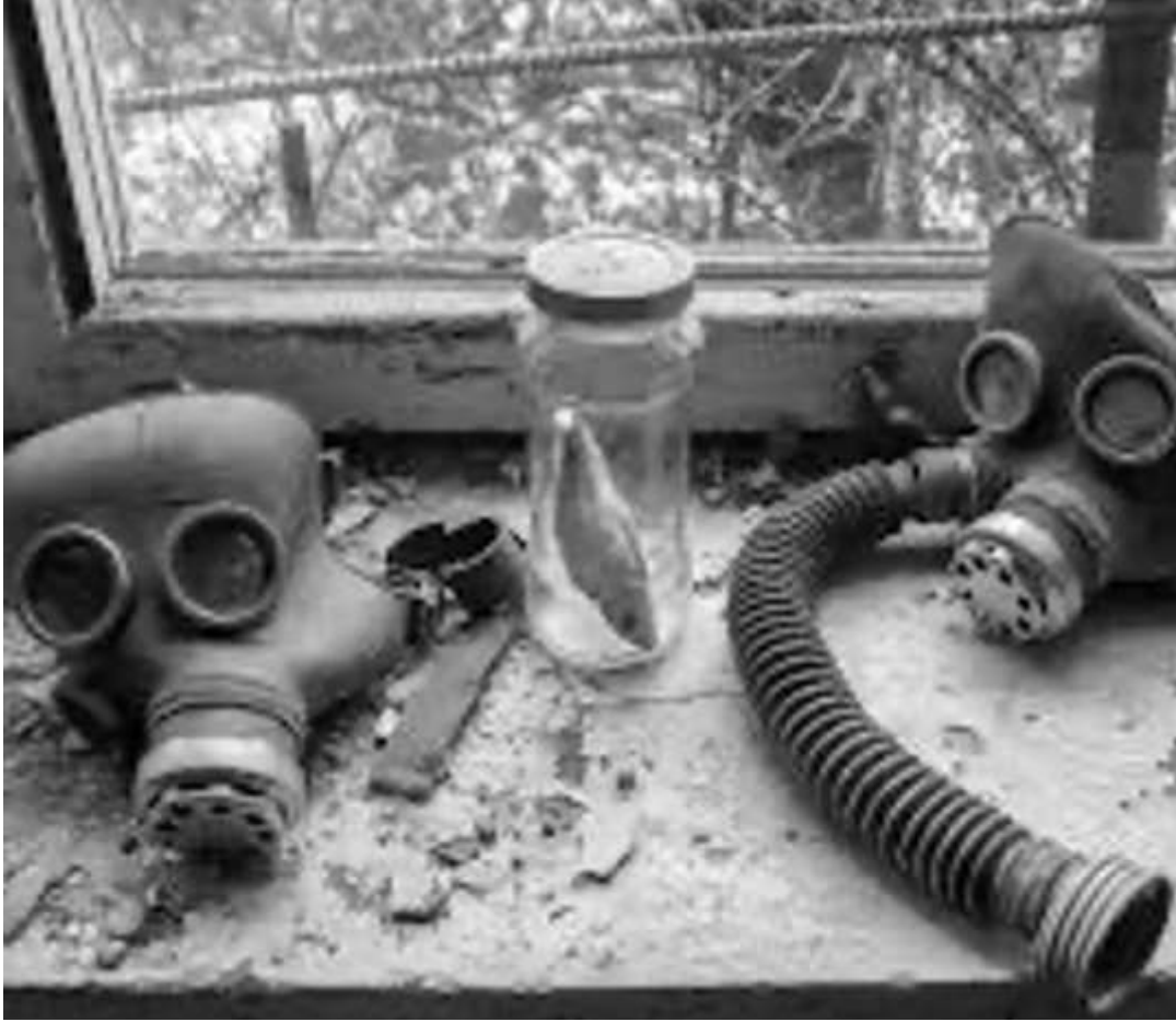
Şekil 6. 1986 yılında Pripyat şehri yakınlarında gerçekleşen Çernobil Faciası görüntüleri (Dogabilim.org, 2024).

emiıyor ve ölünce temiz kuma dönüşıyor.”