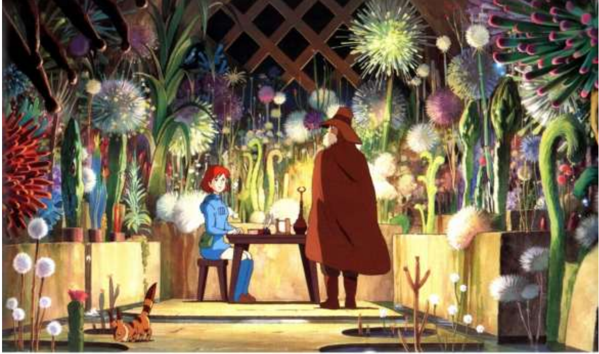
Şekil 5. Prenses Nauska'nın Zehirli Orman'ın zehrine çare bulmak için çalıştığı gizli bahçe.

yaratır. Luc Ferry Transhümanist Devrim adlı kitabında yapay zekânın, dijitalleşmenin, nanoteknolojinin ve biyoteknolojilerin, uzaktan yönetilen dronların, füzelerin, robotların insan yaşamı için ciddi bir tehdit oluşturduğunu dile getirir (Ferry, 2023, s. 152). Miyazaki de Rüzgârlı Vadi 'de insanın elindeki araçları ölçsüz kullanmasının sonuçlarını gösterir. Zehrin, irinin, hastalığın ilacını üretmeye, ölçsüzlüğün zıddına ölçüyü yaratmaya çalışır.