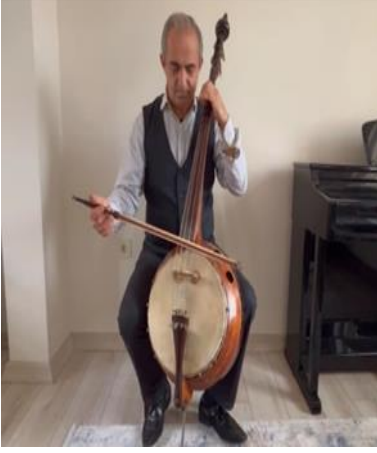
Resim 10. Arslan Akyol / Bas Kemane

duyabilmesi için, gövde kısmı üzerine delikler açılmıştır. Bas kemane akordu en ince tel olan birinci telden itibaren (re-la- re- la) şeklindedir ve tuşe kısmına perdeler bağlanmıştır (Akyol, 2024: 61-62).