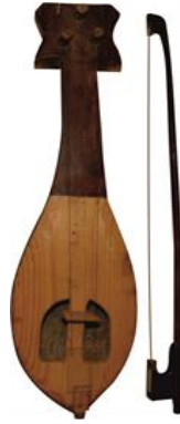
Resim 2. Kauş 3