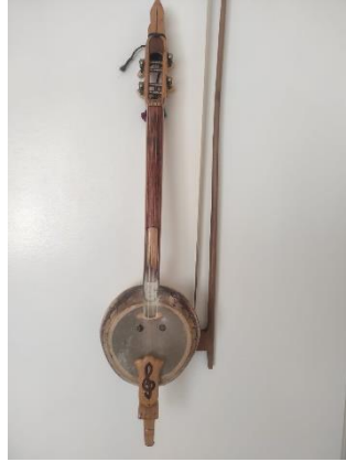
Resim 12. Kabak Kemane

Kabak kemanenin yereldeki icra ortamlarının çoğunlukla köy kahvelerinde gerçekleştirilen sohbet ortamları, zaman zaman düğünler ve özel eğlence ortamları olduğu tespit edilmiştir. Bu icra ortamlarından kabak kemane eşlik eden çalgılar genellikle bağlama, kaval ve ritim çalgılarıdır. Günümüzde hemen hemen her yörede icra edilen bir çalgı haline dönüşen kabak kemane, çok daha geniş çalgı toplulukları içinde yer almaya başlamıştır. Kabak kemanenin yerel yapımcıları ve icracıları, kabak kemane çalarak veya satarak geçimlerini sağlayamadıkları için mutlaka ikinci bir işe sahiptirler. Bu yerel yapımcılar ve icracıların geçim kaynakları çoğunlukla çiftçilik, hayvancılık veya farklı iş kollarıdır. Kabak kemane kent ortamına taşınmasıyla birlikte, kabak kemane icracılığı ve yapımcılığı profesyonel bir iş kolu haline dönüşmüştür.