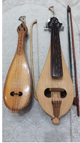
Resim 6. Tırnak kemane / Hegit

Bayram Salman, Fethiye’de tırnak kemane olarak adlandırılan çalgıyı ilk defa babasından öğrendiğini, bu çalgının yörede özellikle Yaka köyünde gerçekleştirilen düğünlerde çalınan bir çalgı olduğundan bahsetmiştir. Bayram Salman, bu çalgının su kabağından yapılan çeşitlerini bilmediğini, gövde kısmı ağaçtan oyularak yapılan çeşitlerini icra ettiğinden söz etmiştir. Tırnak kemane gelenekte üç telli bir çalgıyken, hegit adlı çalgının dört ve beş telli olan çeşitleri de bulunmaktadır (Salman, 2024: 63-65).