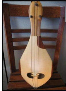
Resim 1. Kastamonu kemanesi

Türkiye sahasında, tırnak tekniği ile icra edilen yaylı halk çalgılarından olan Kastamonu kemanesi Kastamonu’nun İnebolu ve Cide yöreleri dışında yine Kastamonu’ya bağlı Azdavay, Bozkurt, Küre ve Şenpazar ilçeleri ve bazı köylerinde de müzik icra ortamlarında yaygın olarak icra edilmektedir. Kastamonu kemanesi tırnak tekniği ile icra edilmektedir. Diğer taraftan çalgının, düğünlerde, festival, dernek etkinlikleri, piknik, kır eğlencesi, asker eğlencesi, halk oyunları gibi icra ortamları yanı sıra televizyon programları, oturak alemleri ve albüm kayıtlarında da yaygın olarak icra edilmektedir. İnebol ve Cide yöresi kemaneleri arasında yapısal olarak bazı farklar olduğundan bahseden Çakmakçıoğlu, İnebol yöresinde icra edilen kemanenin toplam uzunluğunun 49 cm olduğunu, Cide yöresinde icra edilen kemanelerin ise 42 cm uzunluğunda olduğunu tespit etmiştir. Diğer taraftan çalgının eni İnebol yöresinde 19-21 cm civarındayken, İnebol yöresinde ise kemanenin eni 15-17 cm civarındadır. Her iki yörede de çalgının derinliği 2- 2.5 cm’dir. Kastamonu kemanesinde tel olarak hayvan bağırsağı kullanılmakta olup, genel olarak çalgının gövde kısmı ve sap kısmı, köknar, erik, ladin veya dut ağaçlarından hazırlanmaktadır (Çakmakçıoğlu, 2017: 1).