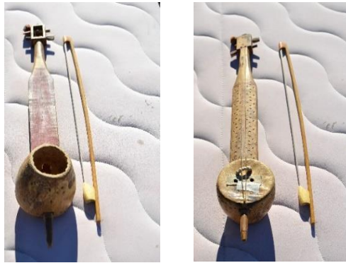
Resim 4-5. Ramazan Çankaya'nın ıklığı