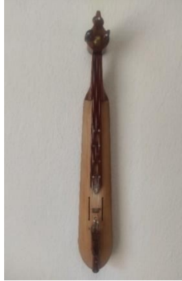
Resim 7. Karadeniz Kemeçesi

edilen “horon” olarak adlandırılan halk oyunlarına eşlik ederken ayakta icra edilmektedir. Kemeçenin akordu; birinci tel olan en alt telden itibaren “re-la-mi” şeklindedir ve farklı akortlar da çalınabilmesi için “mi, si, do, fa” gibi farklı kemeçe boyutları bulunmaktadır. Birçok kemeçe icracısı çalar söyler nitelikte icracılar oldukları için kendi ses genişliğine göre farklı tonlarda kemeçelere ihtiyaç duymaktadır. Farklı tonlar için hazırlanan kemeçelerin boyutları değişmektedir. Toplam uzunluğu ortalama 50-60 cm arasındadır. Ama hepsindeki ortak unsur, akordunun dörtlü olarak yapılmasıdır.