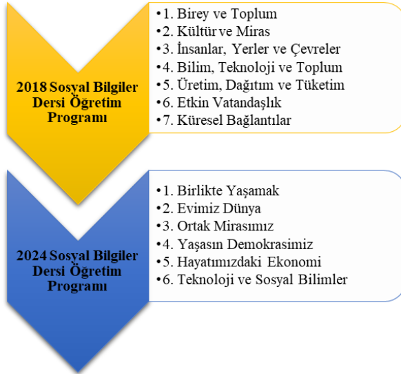
2018 ve 2024 Sosyal Bilgiler Dersi Öğretim Programları Öğrenme Alanları

Şekil 1 incelendiğinde öğrenme alanı sayısının azaltıldığı ve öğrenme alanlarının isimlerinde değişime gidildiği görülmektedir. Öğrenme alanlarının içeriklerine göre eşleştirme yapıldığında “Birey ve Toplum” öğrenme alanı yeni programda “Birlikte Yaşamak”; “Kültür ve Miras” öğrenme alanı “Ortak Miras”; “İnsanlar, Yerler ve Çevreler” öğrenme alanı “Evimiz Dünya”; “Bilim, Teknoloji ve Toplum” öğrenme alanı “Teknoloji ve Sosyal Bilimler”; “Üretim, Dağıtım ve Tüketim” öğrenme alanı “Hayatımızdaki Ekonomi”; “Etkin Vatandaşlık” öğrenme alanı “Yaşasın Demokrasimiz” olarak yer almaktadır. “Küresel Bağlantılar” konu başlığı içeriğindeki kazanımlar ya başka sınıf seviyesine aktarılmış ya da tamamen programdan çıkartılmıştır.