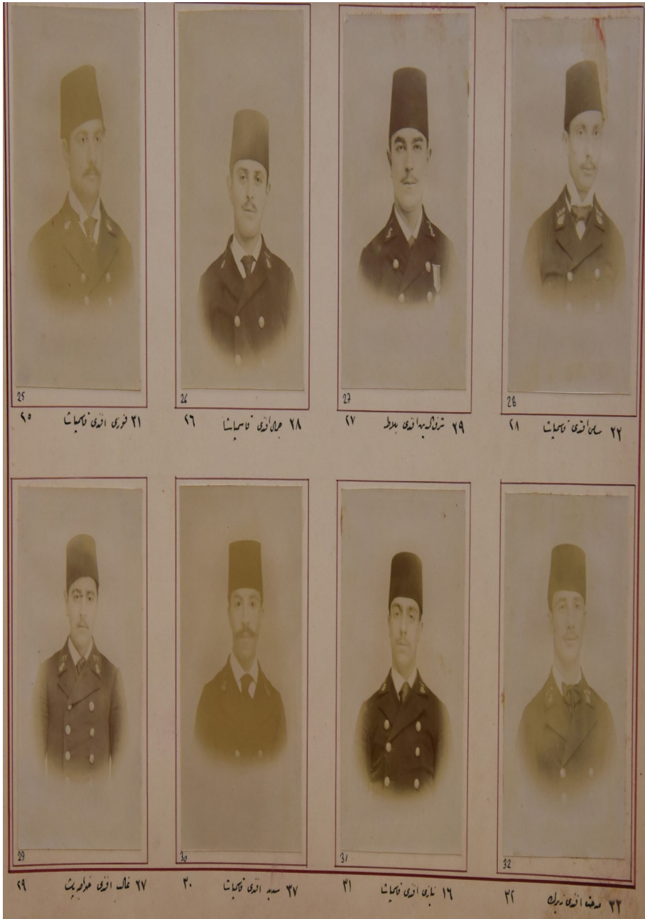
Ek-3: H. 1315 (M. 1898) senesi Mekteb-i Bahriye-yi Şahane mezunları albümünden talebe fotoğraflarıdır. Beşiktaş Deniz Müzesi , Envanter Nu: 7117.