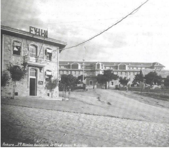
Şekil 1. Numune Hastanesi yakınındaki konaklama amaçlı vakıf taşınmazı

vd., 2019). Bu hanlar, ticari niteliği olan taşınmazlar olup vakıflara gelir sağlama amacıyla işletildiğinden, konaklama hizmeti sunmadıkları görülmektedir. Osmanlı'dan Cumhuriyet dönemine intikal eden vakıf taşınmazları arasında konaklama amaçlı tesislerin sayısının sınırlı olduğu, Ankara'da bulunan örneklerinden birisinin Numune Hastanesi kuzeyinde bulunan yapı olduğu ve konukevi olarak kullanıldığı belirlenmiştir (Aksoy ve Varol, 2015) (Şekil 1).