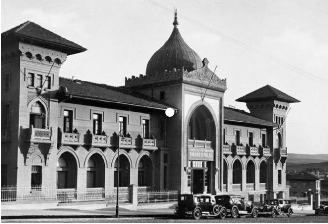
Şekil 2. Ankara Palas

hip olduğu altyapı imkânlarının yanı sıra ev sahipliği yaptığı konser, dinleti, toplantı ve balolarla yeni sosyal pratikleri sunan bir simge haline gelmiştir (Bayraktar, 2016). Başta kadın ve erkeklerin bir arada vakit geçirdiği alanları sunması, ulusal kimlik ve modern yaşam biçimlerini deneyimleme imkânı vermesiyle Palas simgesel değeri yüksek bir yapı olmuştur. Bununla birlikte, sahip olduğu teknolojik seviye de konukların konforu açısından olduğu kadar dönemin gelişmişlik düzeyini yansıtmaya yönünden oldukça önemlidir; ısıtma, elektrik, sıcak su ile banyo ve tuvalet bulunması çağdaşlaşma ilkesine paralel adımlar olarak görülmektedir. Ayrıca, yapının iç mekânı ve kullanılan mobilyalarıyla da batılı ve asri bir yaşam tarzı vurgusu yapılmıştır. Palas'ta Cumhuriyet Balolarının yanı sıra düzenlenen yılbaşı, tıp baloları, resepsiyonlar ve yardım geceleri ile kıyafet, kadın-erkek ilişkileri, Fransız mutfağı, dans, sohbet ve yemek kültürü öğretilerinin topluma aktarılması ve yaygınlaşması amaçlanmıştır. Böylelikle, modernleşen toplumsal yaşantının sergilenme mekânı haline gelmiştir (Sumbas, 2013).