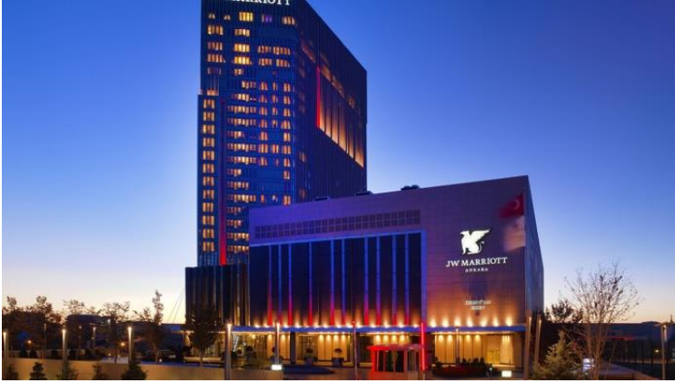
Şekil 5. JW Marriot Otel

2000’li yıllarda Başkentte ortaya çıkan mekânsal eğilim, kentin yoğun yapılaşmış merkezinden uzaklaşarak ana gelişme koridorları boyunca ko- nut alanları, iş, ticaret, kamu kurumları ve üniversitelerle birlikte görülen gelişmedir. Bu dönemde konaklama endüstrisi işletmeleri özellikle gü- neybatı ekseninde yoğunlaşan prestijli kullanımlardan etkilenmiş, ancak bununla sınırlı kalmamıştır. Kentin merkezden çepere uzanan ana ulaşım arterleri de otelciliğin yoğunlaştığı ışınsal gelişimleri teşvik etmiştir. 2000 sonrasında tanımlı bir çekirdek yapısı yerini saçaklanan merkezi alana bı- rakmıştır. Balgat, Söğütözü ve Ümitköy başta olmak üzere yayılan mer- kezi alanlar konaklama tesislerinin de tekil veya küme olarak yer seçtiği bölgelere dönüşmüştür (Orhan, 2023a). 13 Oteller bir yandan yüksek yapı- larla kentin silüetini değiştirirken, diğer yandan farklı formlarıyla görsel uyaranlar haline gelmişlerdir (Şekil 5-6).