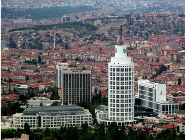
řekil 4. Sheraton Otel ve Hilton Otel

geniřletmeye bařlamıřtır. Bu dnemde, Bařkentte ulusal sermayeli byk otellerin yapıldıęını, Etap Altınel ve Byk Srmeli Otel gibi kent merkezinde yer seęen yeni otellerin oluřtuęunu izlemek mmkndr. Bununla birlikte, kentin siluetini etkileyecek ve modern mimari slupları yansıtacak uluslararası temsilcileri de sektrde yer edinmiřtir (Orhan, 2023b). 80 metre ykseklięindeki Hilton Otel 1988 yılında, ona komřu silindirik formlu Sheraton Otel ise 1991 yılında, hizmete aılmıř uluslararası řirketler zincirine baęlı otellerdir (İlerisoy ve Bařgl, 2019) (řekil 4). Bir yandan Ulus ve Kızılay daha alt hizmet kategorisindeki yeni otel iřletmelerine ev sahiplięi yapmayı srdrrken, dięer yandan uluslararasılařmanın ve turizm teřviklerinin etkisi ile st hizmet kategorilerindeki otel tesislerinin merkezin eperinde yer seęerek yeni geliřme dinamikleri yarattıęı gzlenmektedir. Dnemin Ulus blgesi otelleri yeni yapılařma kořullarında 6 katlı yapılarda ykselirken 10 , Kızılay’da oęunluęu 3 yıldıızlı hizmet veren oteller 11 , Kavaklıdere’de ise yeniliki ve yksek standartlı oteller 12 yer seęmiřtir.