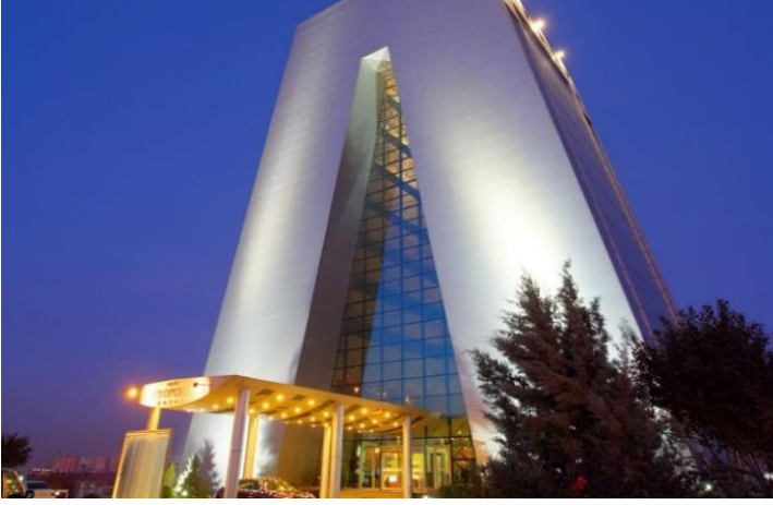
Şekil 6. Metropolitan Otel

Sonuç olarak, Ankara'nın doğal, dini ve kültürel cazibesinin görece sınırlı olduğu ve ziyaretçileri kente çeken temel işlevin başkentlik rolü olduğu düşünüldüğünde, kent otellerinin idari işlevlerin yoğunlaştığı kent merkezinde iş alanlarında kümelendiği ileri sürülebilir. Zaman içinde, iş ve ticaret aktivitelerinin yoğunlaşması kentin, uluslararası pazara entegre olmasına ve yabancı yatırımcıları çekmesine yol açmıştır. Özellikle 1980 sonrası dönemde başlayarak ve 2000lerde artan bir ivmeyle uluslararası zincirlere ait otel işletmeleri kentte yer seçmiştir. Konumlanmalarında, Kuruluş döneminde olduğu gibi idari işlevleri izledikleri söylenebilir; ancak bu kez kamu kurumlarının da merkezden desantralizasyonu söz konusudur ve oteller bu eğilimi izlemektedir.