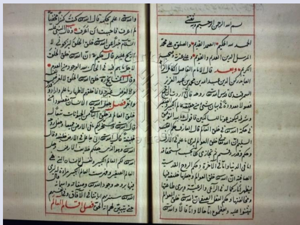
صورة 3: الورقة الأولى لنسخة ش