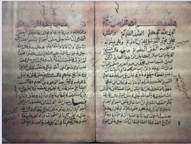
صورة 1: الورقة الأولى لنسخة آ