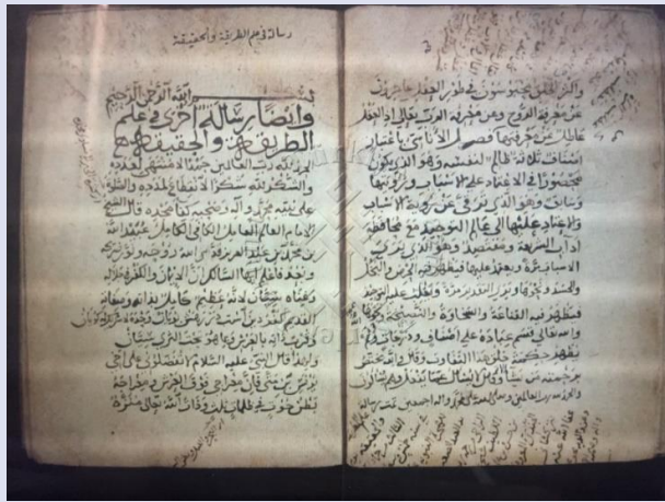
صورة 2: الورقة الأخيرة لنسخة آ