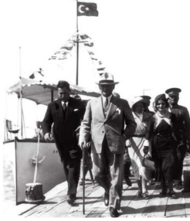
Fotograf 1. Mustafa Kemal Atatürk'ün Baltacı Çiftliği'ni Ziyareti

Yalova kaplıcalarında Gazi Mustafa Kemal Paşa'nın ikamet etmesi için Atatürk Köşkü inşa edilmiştir. Köşkün eşyalarının bir kısmı Milli Saraylar Müdüriyetinin depolarında bulunan eşyalardan karşılanmış bir kısmı da dışarıdan satın alınmıştır (BCA. 30.18.1.2, 13/51/15).