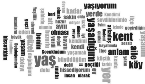
Görsel 2 Kelime bulutu

Hayatları ve yaşadıkları yerleri düşündüklerinde katılımcılarda olumlu etkiler bıraktığını hissettikleri ile anlam ifade ettiğini söyledikleri yer sorularına verilen yanıtlarda en sık tekrarlanan kelimeler "yaş, yer, yaşadığım, köy, aile, anlam, güzel" olmuştur. Yanıtların Kelime bulutu analizi ile değerlendirilmesi sonucunda Görsel 2 elde edilmiştir.