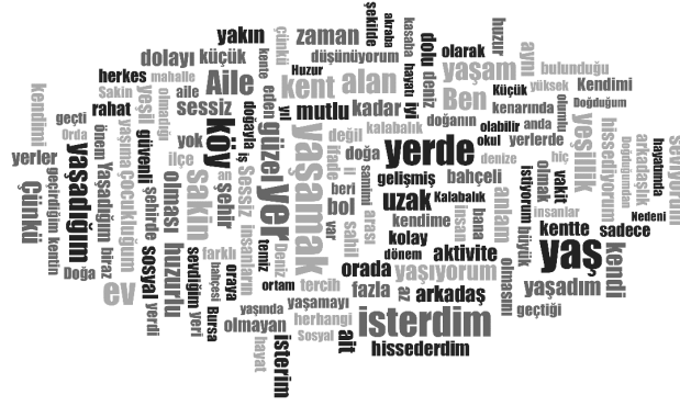
Görsel 1 Kelime bulutu

Anketin açık uçlu soruları Kelime Bulutu Analizi ile değerlendirilmiş ve Görsel 1 elde edilmiştir. Buna göre; hayatları ve yaşadıkları yerleri düşündüklerinde katılımcılarda olumlu etkiler bıraktığını hissettikleri ve anlam ifade ettiğini söyledikleri yer, tercih şansları olsa nerede yaşamak istedikleri ve nedenini ifade ettikleri sorulara ilişkin değerlendirmelerinin analizi sonucunda en sık "isterdim, yaşamak, yaş, yer, hissettiğim, aile, ev, köy, kent, doğa, sakın, alan" gibi kelimelerin daha sık tekrar edildiği sonucuna ulaşılmıştır.