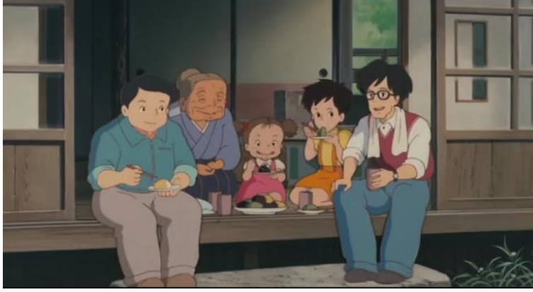
Görsel 8. “Komşum Totoro”da aile üyelerinin bir arada olduğu çay içme anı.

Miyazaki’nin klasikleşmiş eserlerinden biri olan Komşum Totoro , Japon kültürünü ve doğa ile uyum temasını en iyi şekilde yansıtan animasyonlardan biridir. Film, çocukların doğayla ve çevreleriyle kurduğu bağları keşfederken, aynı zamanda aile ilişkilerini ve toplumsal değerleri de derinlemesine işlemiştir. Büyükanneyle gerçekleşen çay sahnesiyle hem Japon çay kültürünün hem de ailenin önemini vurgulanır. Totoro ’nun mistik ve doğa ile iç içe dünyasında, çay içme ritüeli, büyükanneyle Satsuki ve Mei arasındaki samimiyeti ve sıcaklığı yansıtmış ve filmdeki aile temasını güçlendirmiştir. Büyükanne, çay içme eylemi aracılığıyla çocuklara hem sıcak bir karşılama sunmuş hem de onların evdeki rahatlık ve güven duygusunu pekiştirmiştir.