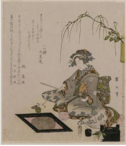
Görsel 2. Çay Töreni Yapan Kadın