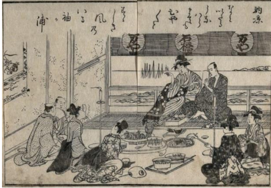
Görsel 1. Bir çay evi sahnesi: akşam serinliği.

Japon çay kültüründe önemli bir yere sahip olan Matcha, özel bir yeşil çay türüdür. Matcha, sıcak su ile karıştırılarak hazırlanır; bu işlem, özel bir bambu çarpıcı (chasen) kullanılarak çayın köpüklü ve homojen bir kıvama gelmesini sağlar. Genellikle geleneksel Japon çay seremonilerinde sunulan matcha, yoğun yeşil rengi ve hafif acımsı tat profili ile tanınır. Ayrıca, matcha yüksek oranda antioksidan içerir, kafein ve L-teanin sayesinde enerjik bir uyanıklık sağlar ve zihinsel odaklanmayı artırabilir.