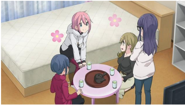
Görsel 4. Yuru Camp 'te bir çay sahnesi.

Yuru Camp 'te çay içme sahneleri, karakterlerin doğayla olan bağlarını ve kamp yapmanın verdiği basit mutluluğu gösterir. Anime boyunca karakterler kamp yaparken sıkça çay içerler ve bu anlar, arkadaşlık bağlarını güçlendiren ve geçmişteki anıları canlandıran anlar olarak öne çıkar. Çay içme anları ayrıca kamp alanında geçirilen zamanın bir parçası olarak, karakterler arasında iletişimi ve samimi bir atmosfer yaratmıştır. Özellikle Rin Shima 'nın yalnız başına kamp yaptığı anlarda, çay içme eylemi bir huzur ve rahatlama aracı olarak öne çıkmıştır. Rin 'in çayı hazırlama ve içme anları, onun yalnızlıkla barışık halini ve doğayla uyum içinde olma arzusunu temsil etmiştir. Bir daha asla gelmeyecek olan anın değerlendirilmesi ve yaşanması vurgulanmıştır. Çay, Rin için bir sığınak ve içsel huzur bulma aracıdır, bu da onun kamp yaparken yaşadığı mutluluğu ve tatmini gözler önüne sermiştir. Diğer yandan, çay içme anları, grup olarak kamp yapan karakterler arasında da sosyal bağları güçlendirmiştir. Nadeshiko Kagamihara 'nın ve arkadaşlarının birlikte çay içtiği sahnelerde; çay, arkadaşlık ilişkilerini ve grup dinamiğini olumlu bir yönde etkileyen bir araç olarak kullanılmıştır.