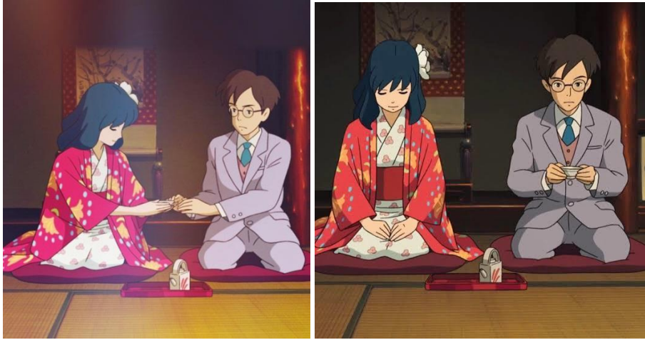
Görsel 9. Jiro ve Naoko 'nun çay içme eylemi.

Jiro ve Naoko 'nun çay sahneleri, filmdeki ilişkilerinin ve duygusal bağlarının derinleştiği anlar olarak öne çıkar. Çay, burada iki karakterin birbirleriyle olan ilişkilerini güçlendiren ve samimi bir bağ kurmalarına yardımcı olan bir öğedir. Çay içme eylemi, Jiro ve Naoko 'nun birbirlerine duyduğu güveni ve sevgiyi ifade eder. Çay, bu anlarda bir sakinlik ve rahatlama aracı olarak işlev görür, iki karakterin stresli ve zorlu anlarda bir araya gelmelerine olanak tanır. Bu içsel sohbetler ve paylaşılan çay, aralarındaki duygusal bağın güçlenmesine katkıda bulunur ve ilişkilerinin derinliğini artırır.