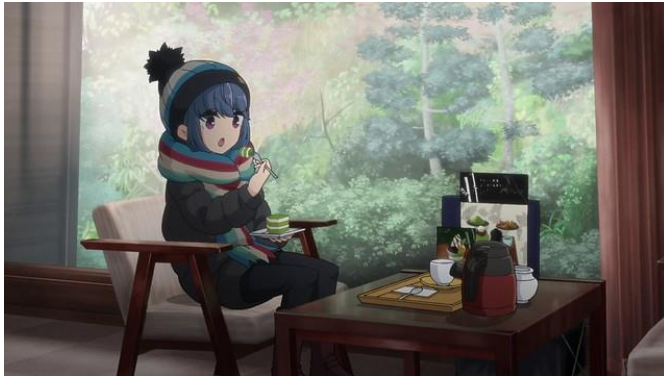
Görsel 6. Rin çay dükkânında.

Anime de vurgulanan çay ögesi, doğal ve rahatlatıcı bir atmosfer yaratmış, bu da izleyicilere çay metaforuyla birlikte kamp yaşamının keyfini ve doğayla uyum içindeki basit anların değerini hissettirmiştir. Anime de yeşil çayın rahatlatıcı ve sakinleştirici özelliği de vurgulanmıştır. Çay içme sahneleri, genellikle karakterlerin huzurlu ve derin düşüncelere daldığı, geçmişi hatırladığı ve birbirleriyle duygusal bağlantı kurduğu anlarla ilişkilendirilir. Çay dükkânındaki sahne de bu gözlemlenmiş, Rin'in yeşil çayını yudumlarken geçmişe duyduğu özlemi yansıtılmıştır.