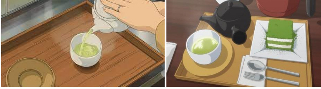
Görsel 5. Yuru Camp animesindeki çay detayları.

Animenin çoğu bölümünde karşımıza çıkan Matcha çayı estetik detay olarak sıkça kullanılmıştır. “Japonya dendiğinde akla ilk gelen şey Japon çay töreni ve matcha çayıdır. Matcha aslında Japon Çay töreni için sadece bir içecekten daha fazlasını ifade eder. Zarafet, sessizlik ve özenle gerçekleştirilen Japon çay seremonisi aslında saygı ve odaklanmanın birleşimiyle bütünleşir.” (Akdaş, 2023: 35). Yuru Camp 'te fazlasıyla yer alan yapılaş, sunum ve içerken ki Matcha çayı görselleri, Japonya'nın günlük yaşamında oldukça popüler olarak kullanıldığını göstermiştir. Ayrıca anime de yeme-içme sahneleri oldukça fazladır. Özellikle Japonlara özgü yöresel pratik yemek ve içecekler tercih edilmiş; araya tanıtıcı sahnelerin girmesiyle yemeğin ne olduğu ve nasıl yapıldığı hakkında kısa bilgilendirmeler yapılmıştır.