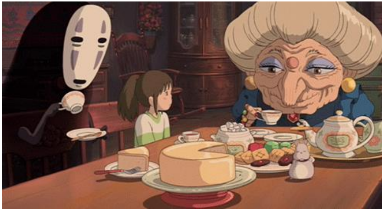
Görsel 7. No-Face ve Zeniba (Yubaba'nın ikiz kız kardeşi) öğleden sonra çayında.

“Ruhların Kaçışı”nda kullanılan çay ögesi, Japon kültüründeki misafirperverlik ve huzur temalarını vurgular. Çay, bu filmde karakterin içsel yolculuğunu destekleyen bir araç olarak işlev görürken, aynı zamanda Japon kültürünün zarif yönlerini izleyiciye gösterir. Zen felsefesine bakıldığında, benzerlik veya bağlantı olduğunu hissettiren kavramlar farkındalık, geçicilik ve kabullenmedir. Bu kavramları ve misafirperverliği birleştiren bir Japonca ifade vardır: Omotenashi v . Omotenashi , farkındalık ve misafirperverlik anlamına gelir (Akdaş, 2023: 41). “Japon kültürünü ve nezaketini yansıtan sıcak bir karşılama olarak tanımlanan Omotenashi , ev sahiplerine ve sağlayıcılara bağlı olarak farklı şekilde algılanır ve uygulanır.” (Morishita, 2021: 88). Chihiro 'nun ruhlar dünyasında geçirdiği süre boyunca karşılaştığı zorluklar ve bu zorlukların üstesinden gelme süreci, onun kişisel gelişimini ve olgunlaşmasını sembolize eder. Çay, bu süreçte Chihiro için bir mola, bir rahatlama anı ve aynı zamanda bir bağlantı kurma aracıdır. Çayın sunumu ve içimi, Japonya'nın geleneksel misafirperverlik anlayışı olan Omotenashi 'yi yansıtır. Omotenashi , sadece bir misafire hizmet etmek değil, aynı zamanda onların ihtiyaçlarını önceden tahmin edip karşılamak anlamına gelir. Bu, farkındalık ve misafirperverlik kavramlarının birleşimiyle tanımlanır.