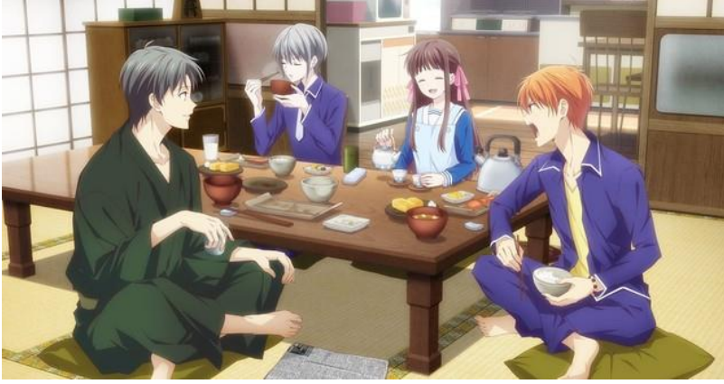
Görsel 3. Tohru ve arkadaşları.

Çay içme sahneleri, hem karakterlerin kişisel mücadelelerini hem de toplumsal değerlerini izleyiciye göstermiş; bu da izleyicilere karakterlerin içsel dünyalarını ve sosyal bağlamdaki yerlerini daha iyi anlama fırsatı vermiştir. Çay, Fruits Basket 'te hem estetik hem de duygusal bir anlam taşıırken, karakterlerin ilişkilerini ve anime içindeki tematik derinlikleri güçlendiren önemli bir öge olarak karşımıza çıkarmıştır.