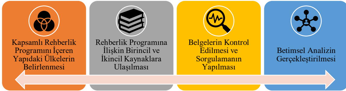
Şekil 1. Veri Toplama Süreci ve Analizi

Böylelikle, araştırma kapsamına uygun ülkelerin tespit edilmesi, bu ülkelerin rehberlik programlarının birincil ve bu programlara ilişkin belgelerin de ikincil kaynak olarak araştırmanın veri setini oluşturması ardından da gerekli kontrolün ve sorgulamanın yapılması, son olarak da analizin gerçekleştirilmesiyle tamamlanan tüm bu süreç karşılaştırmalı eğitim boyutuna giren nitel araştırma yöntemlerinden doküman analizine girmektedir (Özkan, 2019). Yapılan araştırma süreci Şekil 1’de görselleştirilmiştir.