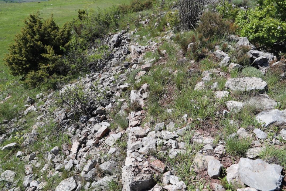
Ek-4: Namli Hisar Kalesi Güneybatı Sur Duvarı Kalıntıları.