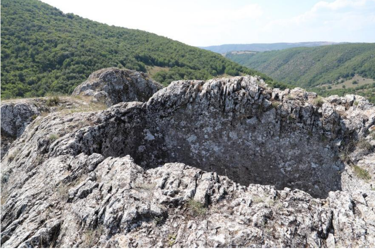
Ek-2: Yeşilalan (Arhoy) Kalesi'nin Zirvedeki Sarnıç.