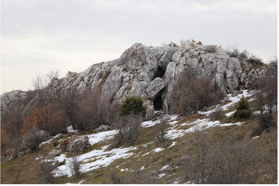
Ek-5: Namlı Hisar Kalesi'nin Kuzeybatı Ucundaki Koridor.