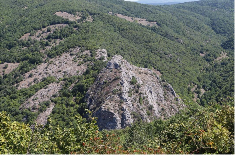
Ek-1: Yeşilalan (Arhoy) Kalesi'nin Yer Aldığı Asarkaya'nın Genel Görünümü.