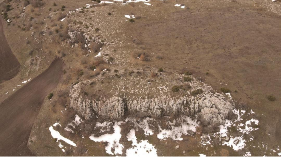
Ek-3: Namli Hisar Kalesi'nin Kuzeydoğudan Görünümü.