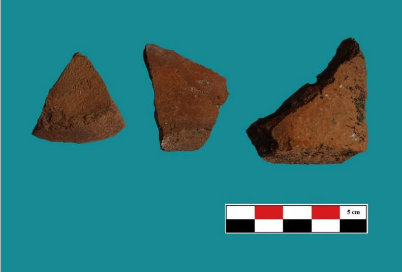
Ek-6: Namlı Hisar Kalesi Çanak-Çömlek Buluntuları.