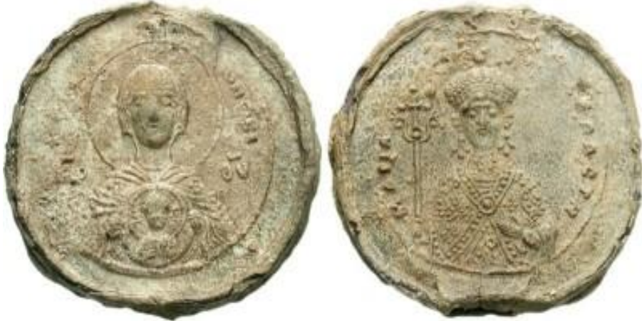
Ek-5. 1070 tarihli Mariam'a ait kurşun mühür örnekleri. Bkz. https://georoyal.ge/?id=963 veya https://kids.kiddle.co/Maria_of_Alania