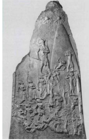
Fig 3: Narām-Sîn Zafer Steli 91

Anıt üçlü dikey bir yapıya sahiptir; en üstte soyut semboller, büyük tanrıları temsil eden yıldızlar, ortada Narām-Sîn ve muhtemelen Sidur Dağı olan düz bir dağ; aşağıda sağda düşmanlar (Lullubalılar) ve solda Akad askerleri yer almaktadır 92 .