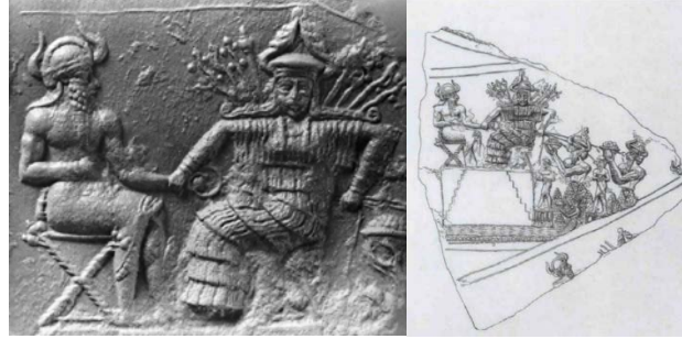
Fig 4: Narām-Sîn ve tanrıça İřtar 94

Bernbeck'in belirttiđi üzere, Narām-Sîn'in tanrılařtırılması uzun vadeli bir gelişme bağlamında görülmelidir. Bu durum özellikle Akad dönemine ait mühür ve mühürlemeler göz önünde bulundurulduğunda netlik kazanmaktadır 95 .