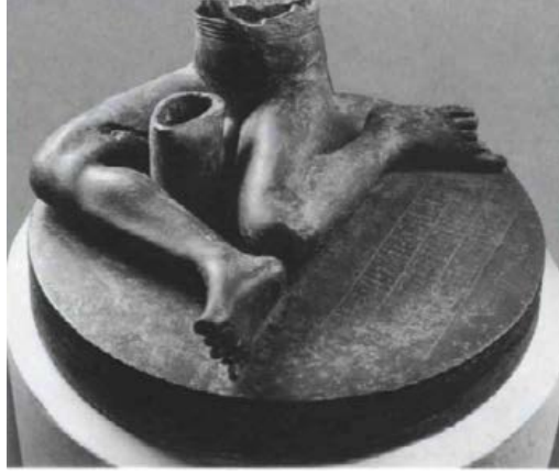
Fig 2: Bassetki'de bulunan bakır alaşımlı çıplak, kemerli bir figürün alt yarısı. 84

Gövdenin sadece alt kısmı kalmıştır, ancak heykelin üzerindeki yazıt oldukça iyi durumdadır. Kralın tanrılaştırılmasının Büyük İsyân'dan 85 kısa bir süre sonra gerçekleştiği düşünülmektedir. Bu döneme tarihlenen olaylar bu kraliyet yazıtında açıkça anlatılmaktadır.